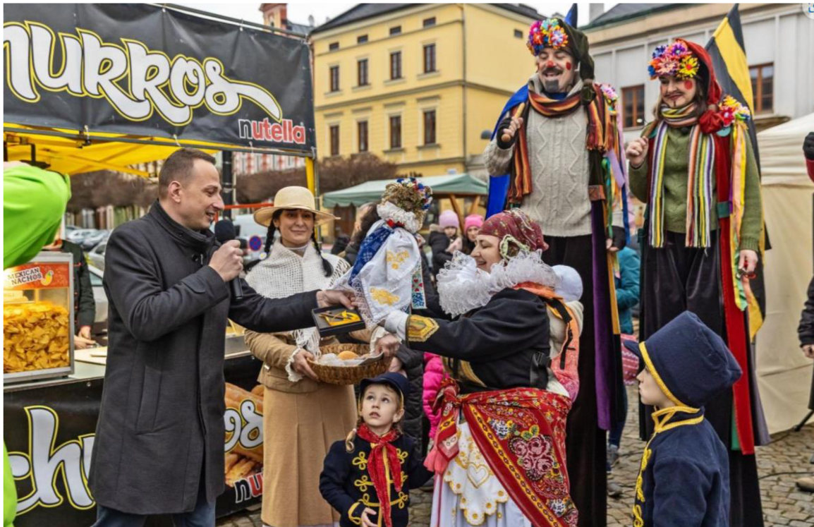
Obrázek č. 4. Masopustní veselice na náměstí ve Šternberku, 18.02.2023

(Dostupné z: Masopustní veselí oživilo centrum Šternberka - Oficiální stránky město Šternberk (sternberk.eu) )