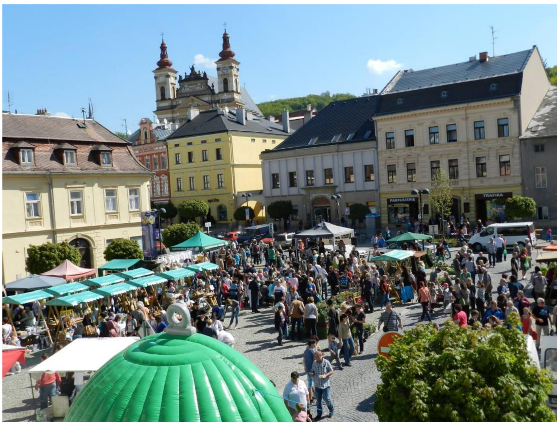
Obrázek č. 9. Venkovské trhy na náměstí ve Šternberku v roce 2016