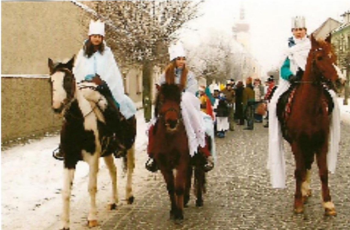
Obrázek č. 12. Přejezd Tří králů do Bohuňovic v r. 2008