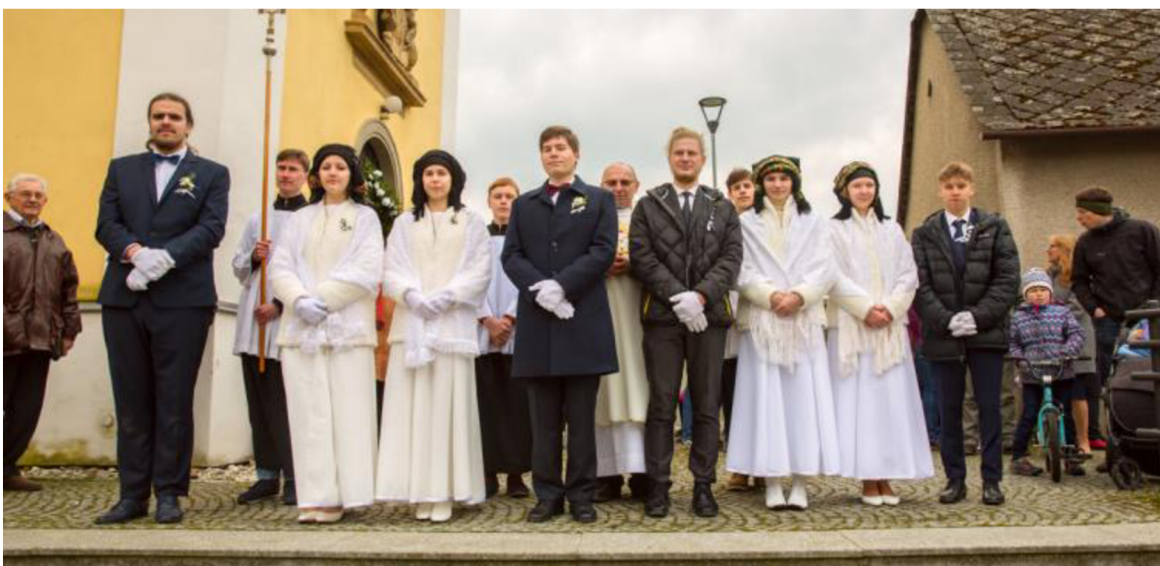
Obrázek č. 11. Matičky v Bohuňovicích. Slavnostní nedělní oděv matiček a mládenců