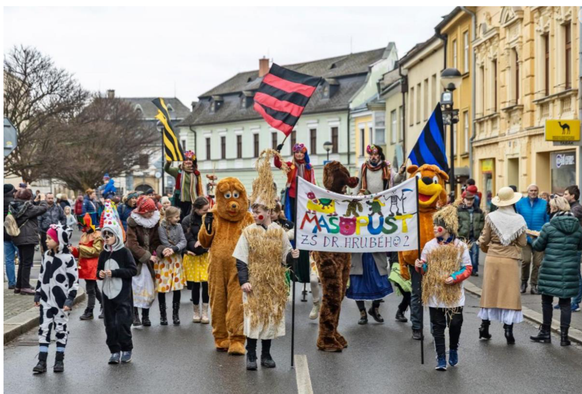
Obrázek č. 3. Masopustní průvod ve Šternberku, 18.02.2023

Tento tradiční křesťanský svátek byl ve Šternberku obnoven v roce 2018, kdy poprvé v novodobé historii prošel městem masopustní průvod. Tuto tradici nyní každoročně organizují Městská kulturní zařízení ve spolupráci se základní školou v ulici Dr. Hrubého ve Šternberku a městem Šternberk. Součástí masopustu je tradiční průvod maškar vycházející od školy směrem na Hlavní náměstí, hned po tom, co je předáno masopustní právo. Ukázka z tradičního průvodu je zachycena na obr. č. 3.