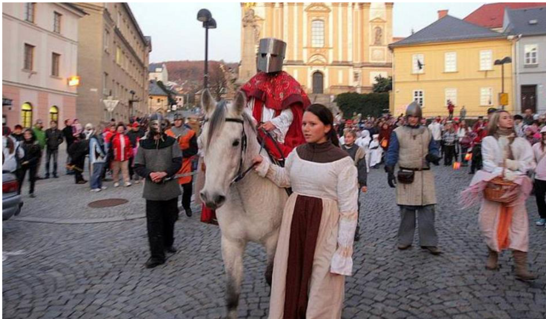
Obrázek č. 6. Svatomartinský průvod ve Šternberku v r. 2011

setkáváme – sv. Barbora, sv. Lucie, sv. Mikuláš a další. Prohlídky jsou pak zakončeny v liechtenštejnské kuchyni, kde bývají připraveny ochutnávky martinských specialit a vína. 108