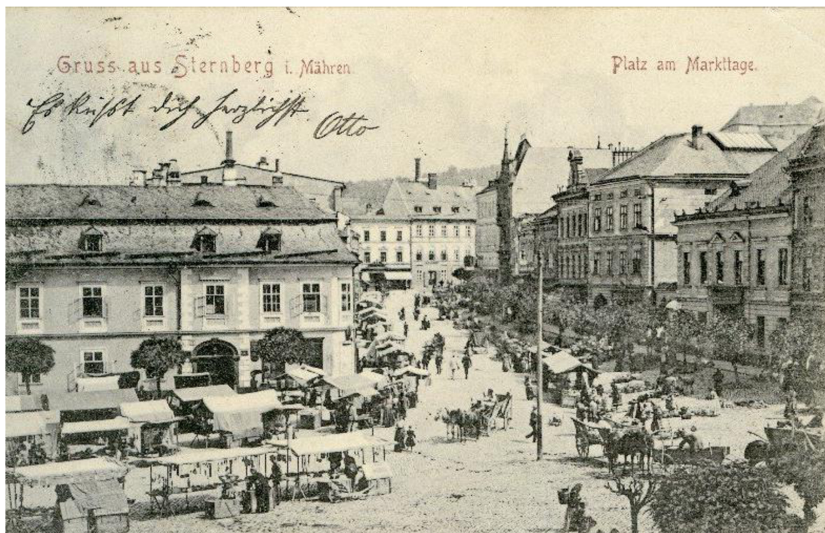
Obrázek č. 8. Trhy na náměstí ve Šternberku a na ul. Radniční na počátku 19. stol.

Atmosféru konání trhů na Hlavním náměstí ve Šternberku v minulosti a v současnosti nám přibližují obrázky č. 8 a č. 9.