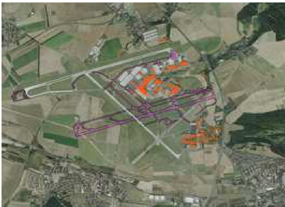
Obr. 3 Schéma návrhu nové přistávací a vzletové dráhy

Řešení kapacitních požadavků Správy Letiště Praha, s.p. výstavbou paralelní dráhy není žádnou novinkou. Se stavbou dvou souběžných drah se počítalo již při realizaci současné hlavní dráhy RWY 06/24. Projekt této dráhy se zrodil koncem padesátých let, realizace pak proběhla v letech 1960 – 1963. Na její umístění měla vliv nejen plánovaná poloha budoucího terminálu, ale také možnost v budoucnosti postavit novou, souběžnou dráhu.