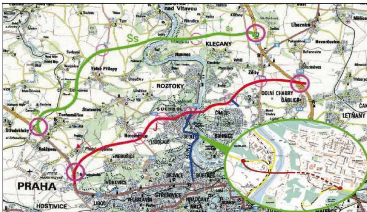
Obr. 1 Schématická mapa severní části Prahy -

http://www.drahan.chabry.cz/dokument.php?kat=1&p=1&rubrika=%