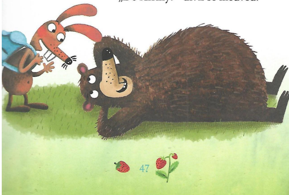
Obrázek 6 - Text pohádky 2 (Balík 2016, s. 47)