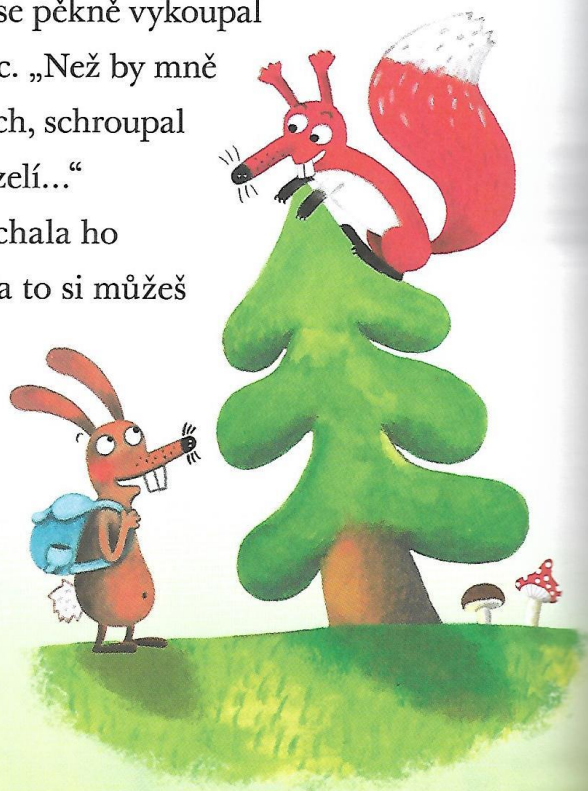
Obrázek 9 - Text pohádky 5 (Balík 2016, s. 50)

„A co mrkev, řepu a jetel?“ mračil se Běhálek.