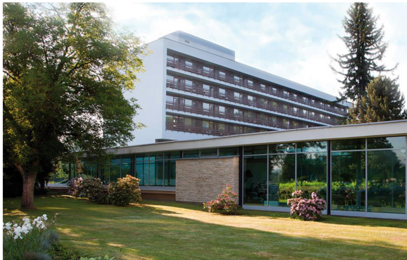
Obrázok 33 Kúpele Dudince