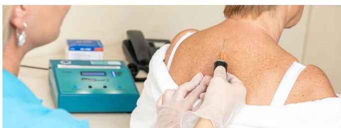
Obrázok 14 Plynové injekcie