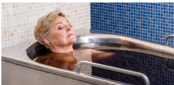
Obrázok 9 Minerálny vaňový kúpeľ