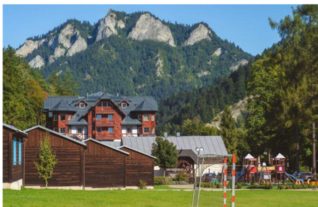
Obrázok 18 Červený Kláštor – Smerdžonka