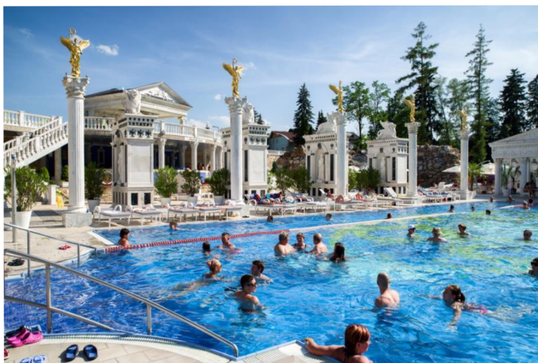
Obrázok 24 Kúpele Rajecké Teplice