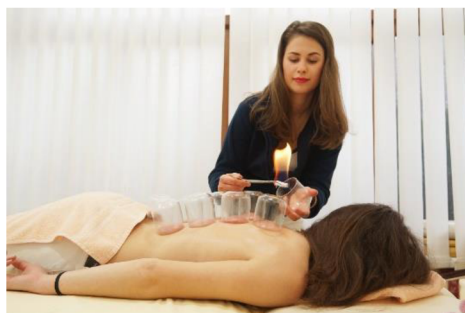
Obrázok 6 Reflexná liečba–bankovanie