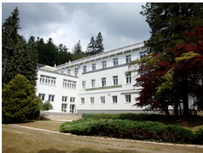
Obrázok 28 Kúpele Štós