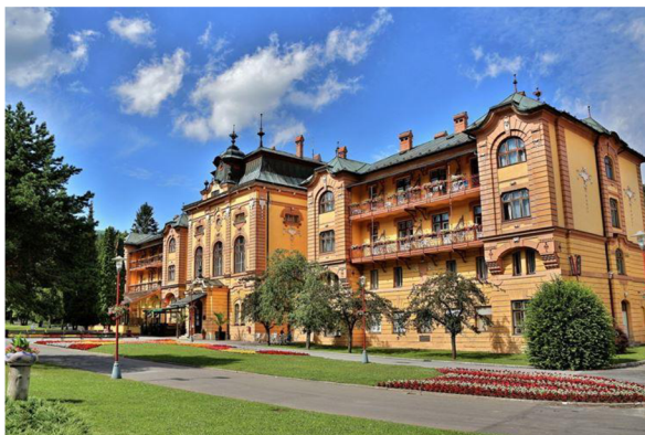
Obrázok 16 Bardejovské kúpele