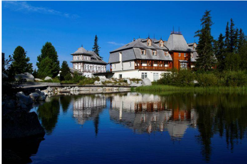
Obrázok 31 Kúpele Štrbské pleso