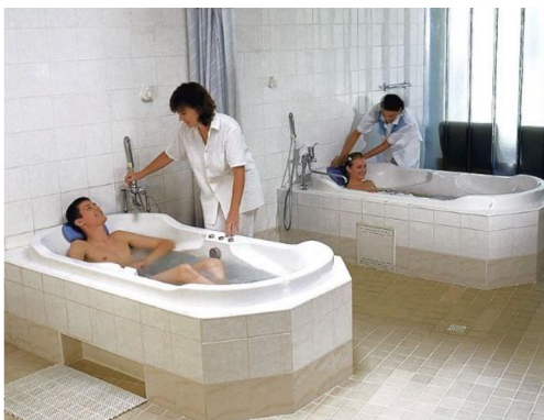
Obrázok 5 Balneoterapia–vodoliečba vo vani

Kúpele Bojnice ponúkajú tieto procedúry: