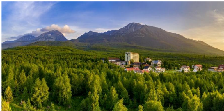
Obrázok 32 Kúpele Tatranské Zruby