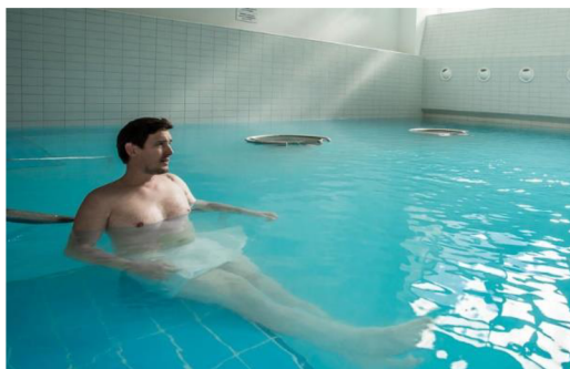
Obrázok 1 Kúpeľ v termálnom bazéne

Teplota liečivej vody sa pohybuje od 38,4 °C do 40 °C. Termálne liečivé pramene zlepšujú prekrvenie tkanív, uvoľňujú svalové napätie, čo vedie k zlepšeniu telesnej kondície a uvoľneniu psychického napätia. Kúpeľ trvá 20 minút a po kúpeli je 20-minútový relaxačný zábal.