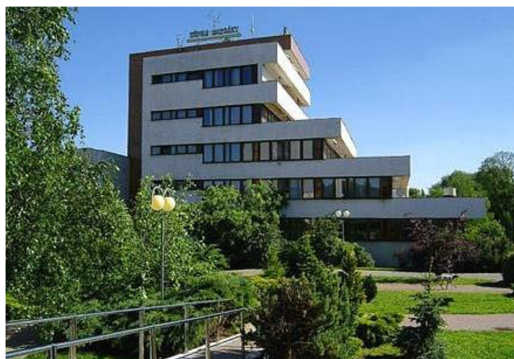
Obrázok 27 Kúpele Smrdáky