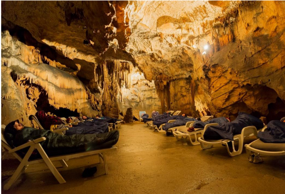
Obrázok 15 Speleoterapia v Jasovskej jaskyni