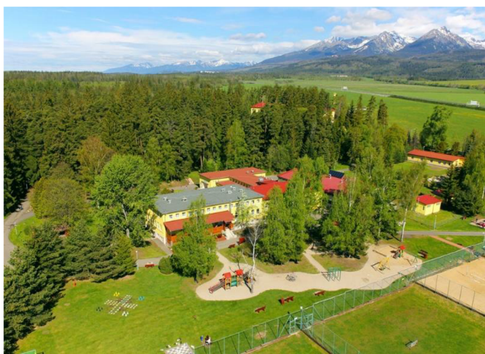
Obrázok 20 Kúpele Lučivná