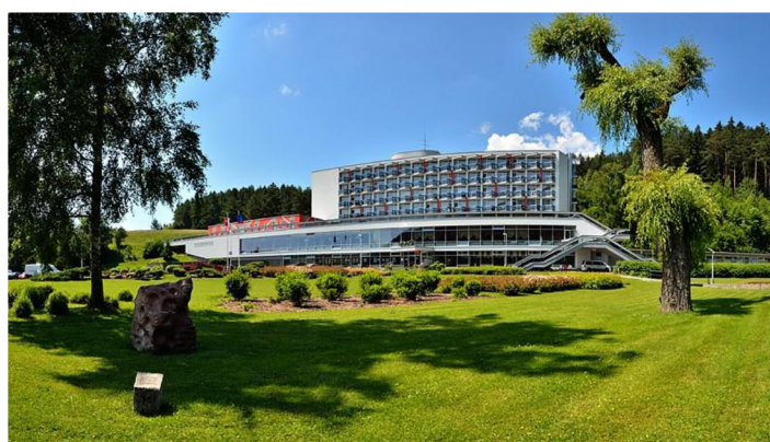
Obrázok 21 Kúpele Lúčky