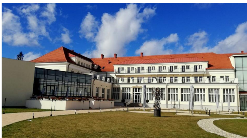
Obrázok 29 Kúpele Turčianske Teplice