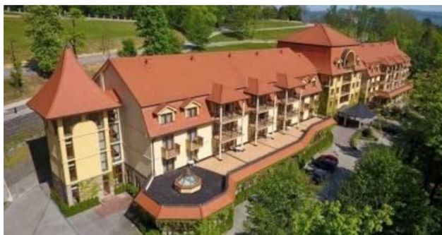
Obrázok 17 Kúpele Bojnice