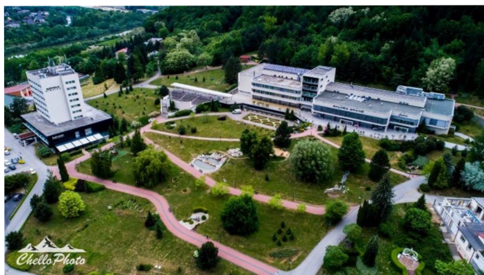
Obrázok 22 Kúpele Nimnica