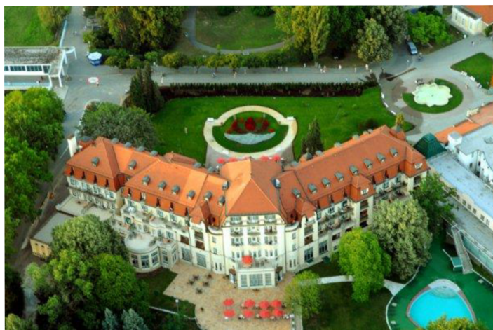
Obrázok 23 Kúpele Piešťany