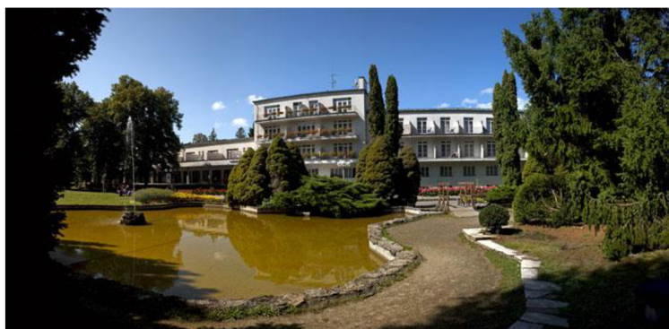
Obrázok 26 Kúpele Sliac