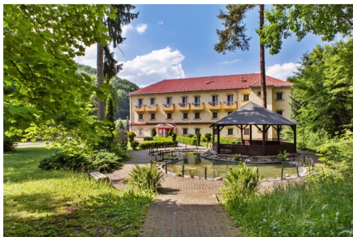
Obrázok 25 Sklené Teplice