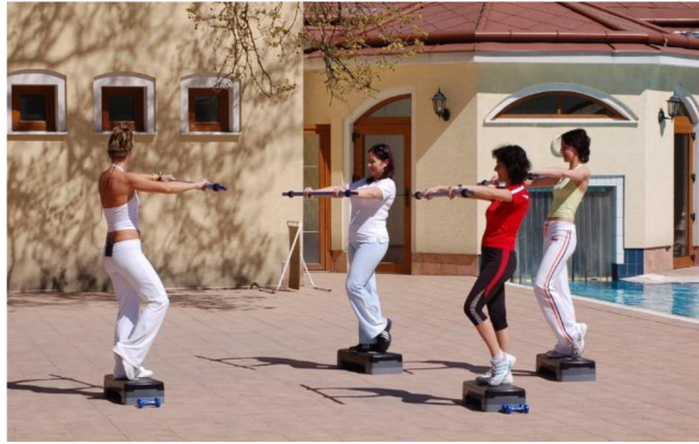
Obrázok 7 Liečebný telocvik