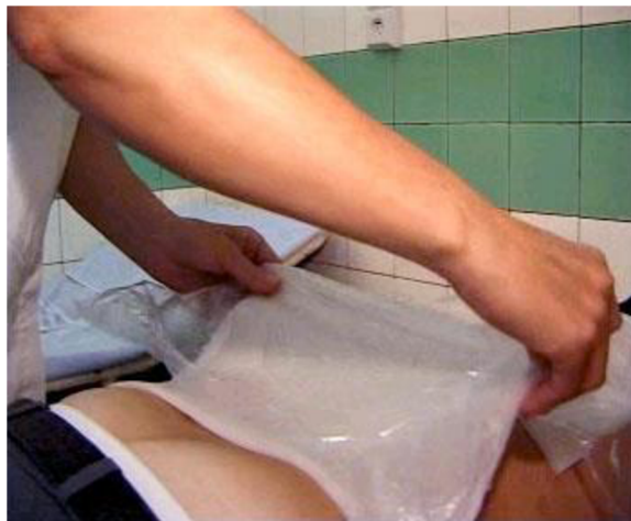
Obrázok 8 Teploliečba – parafinový zábal