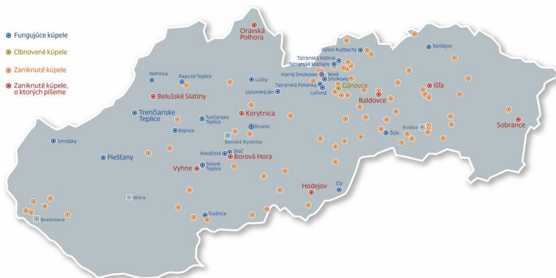
Obrázok 1 Kúpeľné miesta na Slovensku

Na konci 16. a v 17. storočí začali vznikať prvé kúpeľné bazény, ktoré využívala najmä šľachta. (9)