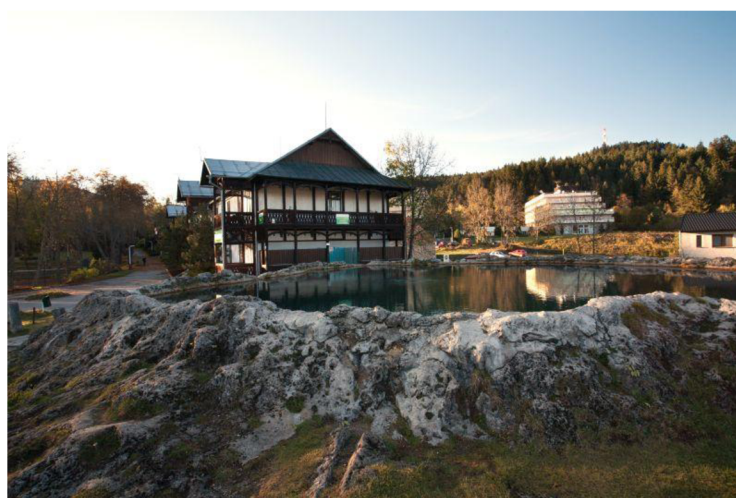
Obrázok 30 Kúpele Vyšné Ružbachy