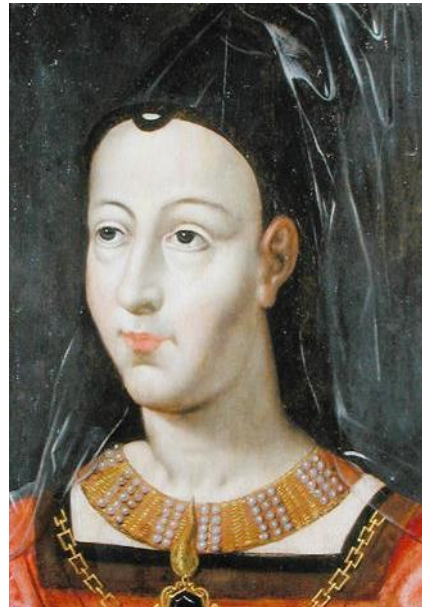
Afb. 11 Margaretha van Bourgondië (1374-1441)