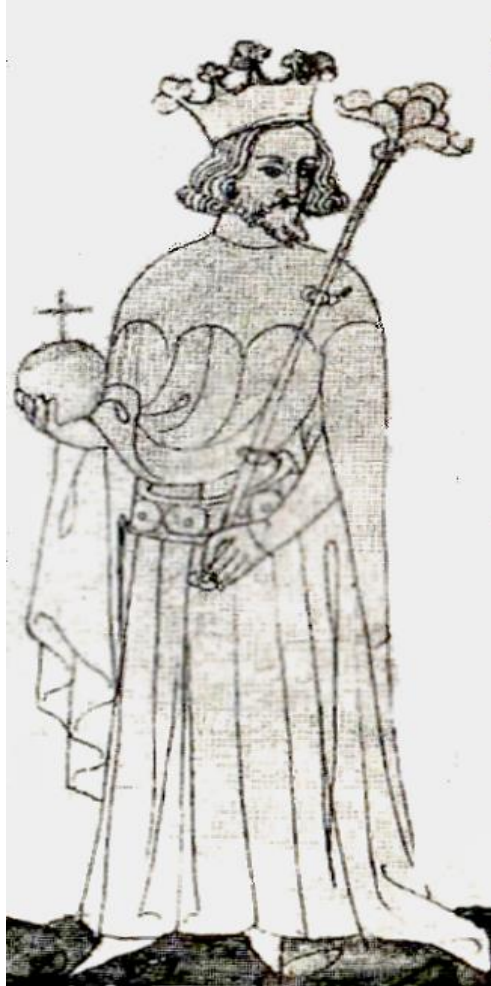
Afb. 6 Jan van Luxemburg in Chronicon Aulae Regiae