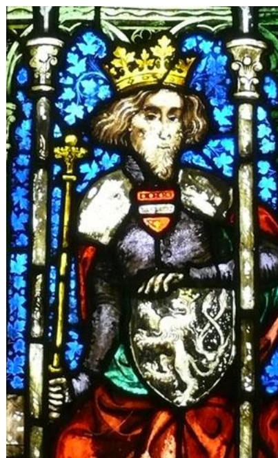
Afb. 5 Rudolf I op het glaspaneel in de Stephansdom, Wenen