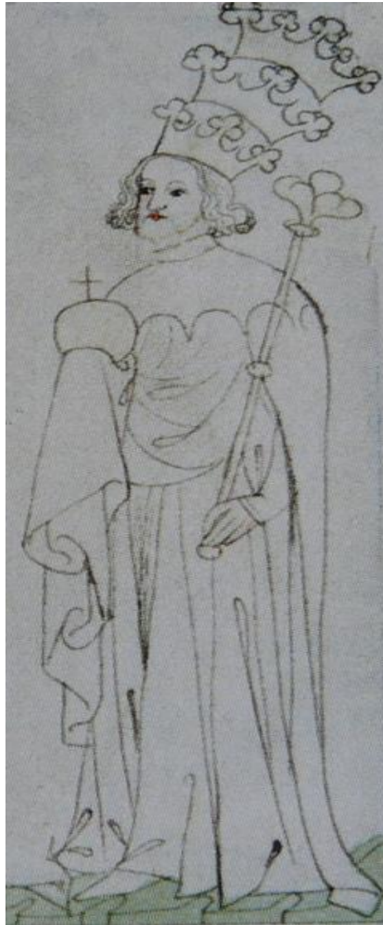
Afb. 3 Wenceslaus III in Chronicon Aulae Regiae