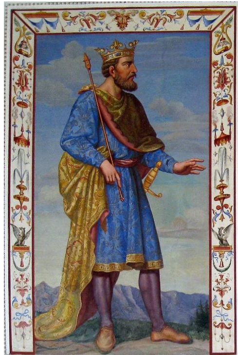
Afb. 4 De muurschilderij van Hendrik van Karinthië in het kasteel Ambras

Eerst moest er besloten worden of adelen en geestelijken de rechten van de Přemysliden dochters op de troon zouden erkennen. Hoewel hun rechten erkend werden, konden prinsessen zelf niet heersen. Het recht zouden zij krijgen voor hun echtgenoten die een koning zouden kunnen worden. Niettemin noemden zowel prinses Anna als later prinses Elisabeth zich erfgename van het Boheemse koninkrijk. Daaruit kunnen we afleiden dat zij zichzelf niet alleen als een middel gezien hebben om op de troon te komen. Deze regel maakte later mogelijk voor Jan van Luxemburg om op de troon zitten als de echtgenoot van de Přemysliden dochter Elisabeth.