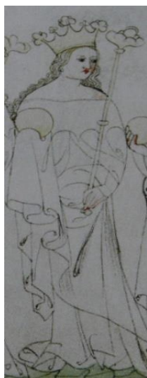
Afb. 2 Guta van Habsburg in Chronicon Aulae Regiae