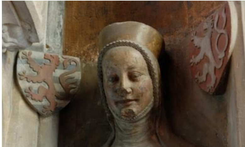
Afb. 1 Een borstbeeld van Elisabeth van Bohemen in Sint-Vituskathedraal

Elisabeth was de dochter van Boheemse koning Wenceslaus II en zijn eerste echtgenote Guta van Habsburg. Zij werd geboren op 20 januari 1292 als hun vijfde kind.