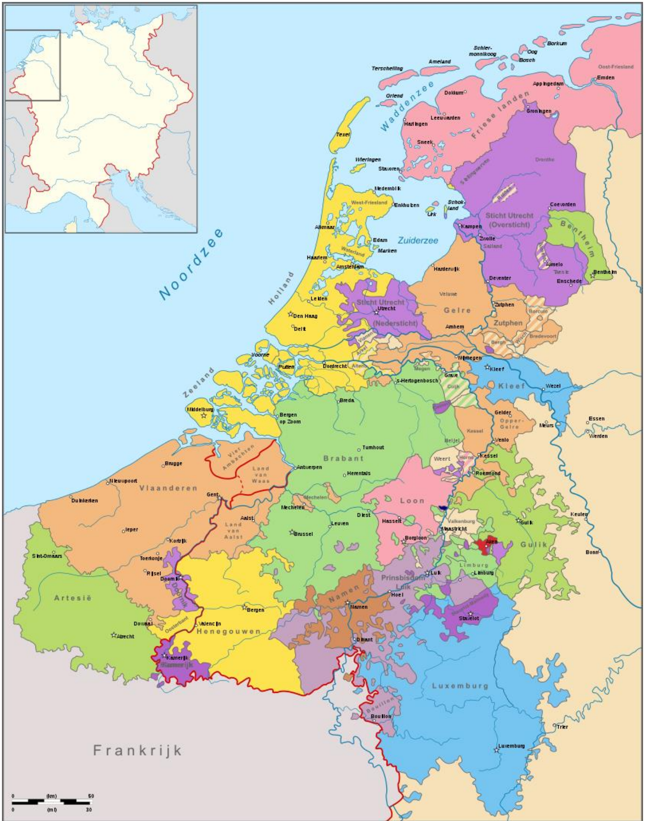
Afb. 8 De politieke kaart van de Nederlanden rond 1350