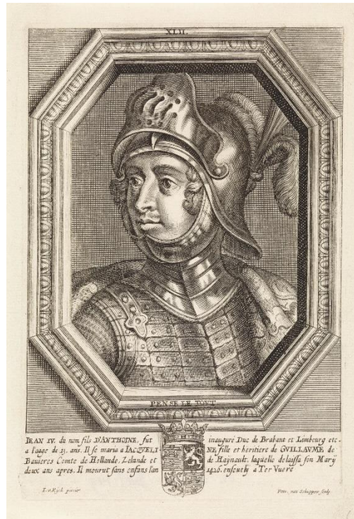
Afb. 10 Portret van Jan IV, hertog van Brabant, Pieter van Schuppen, naar Jan van Eyck, 1660 - 1669