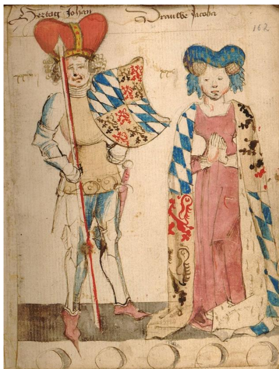
Afb. 12 Jan van Beieren en Jacoba van Beieren in Chronique des Comtes de Hollande Depuis Les Origines Jusque 1415, Hendrik van Heessel, cca. 1456

Daarentegen stond Jan van Beieren. Hij had zich oorspronkelijk als geen vijand van Jacoba gedraag. Om zijn latere gedrag tegen Jacoba beter te begrijpen, moeten we weten dat hij de tweede zoon Albrecht van Beieren en Margaretha van Brieg was. Omwille daarvan dat was hij bestemd voor een carrière in de kerk. Dankzij zijn ambities was hij prinsbisschop in Luik geworden. Niettemin was er weinig kans om hoger te presteren in deze loopbaan dan wat hij al bereikt had. De kans voor een bevordering kwam pas met de dood van Willem IV en hij heeft die volledig benut.