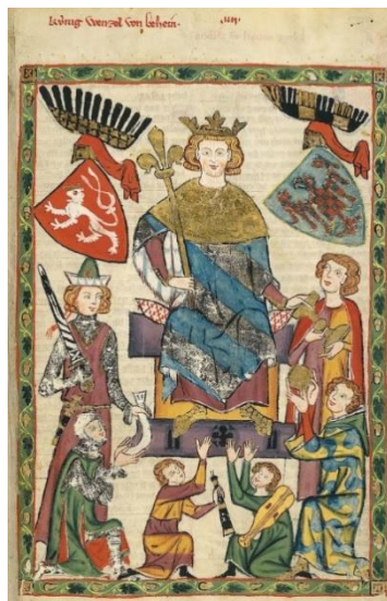
Afb. 3 Wenceslaus II in de Codex Manesse