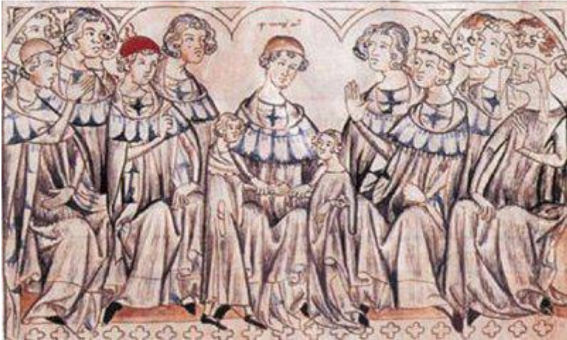
Afb. 7 Het huwelijk van Elisabeth I van Bohemen en Jan van Luxemburg in Codex Balduini Trevirensis