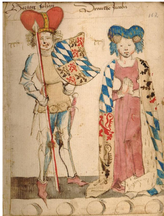
Afb. 12 Jan van Beieren en Jacoba van Beieren in Chronique des Comtes de Hollande Depuis Les Origines Jusque 1415, Hendrik van Heessel, cca. 1456

Daarentegen stond Jan van Beieren. Hij had zich oorspronkelijk als geen vijand van Jacoba gedraag. Om zijn latere gedrag tegen Jacoba beter te begrijpen, moeten we weten dat hij de tweede zoon Albrecht van Beieren en Margaretha van Brieg was. Omwille daarvan dat was hij bestemd voor een carrière in de kerk. Dankzij zijn ambities was hij prinsbisschop in Luik geworden. Niettemin was er weinig kans om hoger te presteren in deze loopbaan dan wat hij al bereikt had. De kans voor een bevordering kwam pas met de dood van Willem IV en hij heeft die volledig benut.