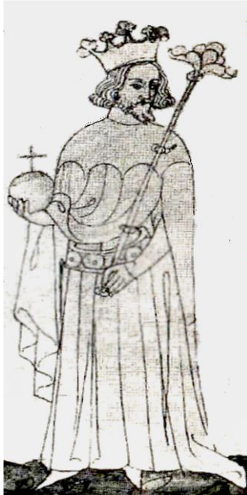
Afb. 6 Jan van Luxemburg in Chronicon Aulae Regiae