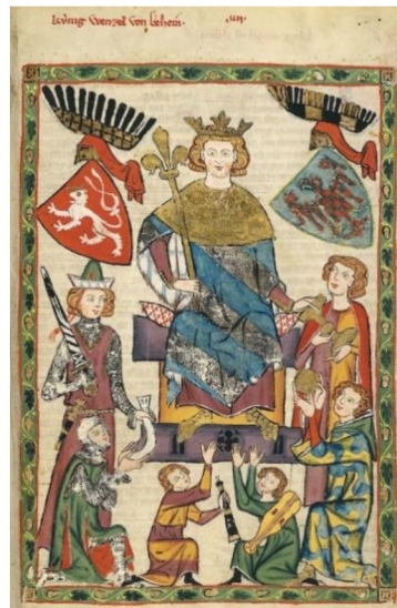
Afb. 3 Wenceslaus II in de Codex Manesse