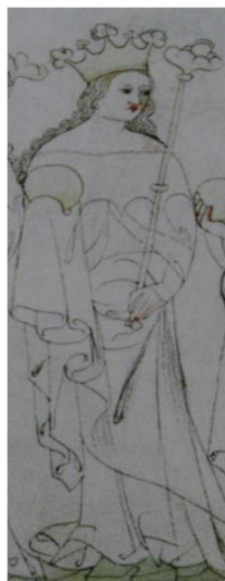
Afb. 2 Guta van Habsburg in Chronicon Aulae Regiae