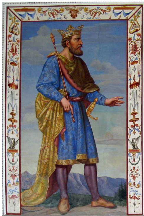
Afb. 4 De muurschilderij van Hendrik van Karinthië in het kasteel Ambras

Eerst moest er besloten worden of adelen en geestelijken de rechten van de Přemysliden dochters op de troon zouden erkennen. Hoewel hun rechten erkend werden, konden prinsessen zelf niet heersen. Het recht zouden zij krijgen voor hun echtgenoten die een koning zouden kunnen worden. Niettemin noemden zowel prinses Anna als later prinses Elisabeth zich erfgename van het Boheemse koninkrijk. Daaruit kunnen we afleiden dat zij zichzelf niet alleen als een middel gezien hebben om op de troon te komen. Deze regel maakte later mogelijk voor Jan van Luxemburg om op de troon zitten als de echtgenoot van de Přemysliden dochter Elisabeth.