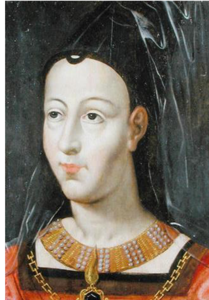
Afb. 11 Margaretha van Bourgondië (1374-1441)