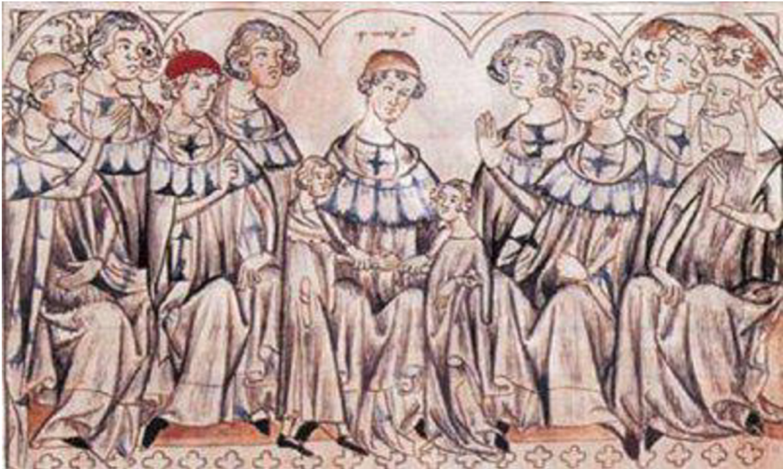
Afb. 7 Het huwelijk van Elisabeth I van Bohemen en Jan van Luxemburg in Codex Balduini Trevirensis