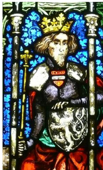
Afb. 5 Rudolf I op het glaspaneel in de Stephansdom, Wenen