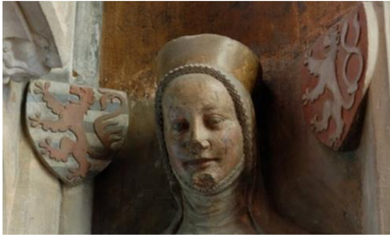
Afb. 1 Een borstbeeld van Elisabeth van Bohemen in Sint-Vituskathedraal

Elisabeth was de dochter van Boheemse koning Wenceslaus II en zijn eerste echtgenote Guta van Habsburg. Zij werd geboren op 20 januari 1292 als hun vijfde kind.