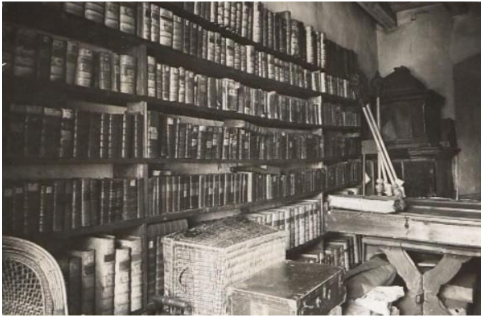
„der Raum für die alter wertvolle Minoritenbibliothek in I. Stock“ 133