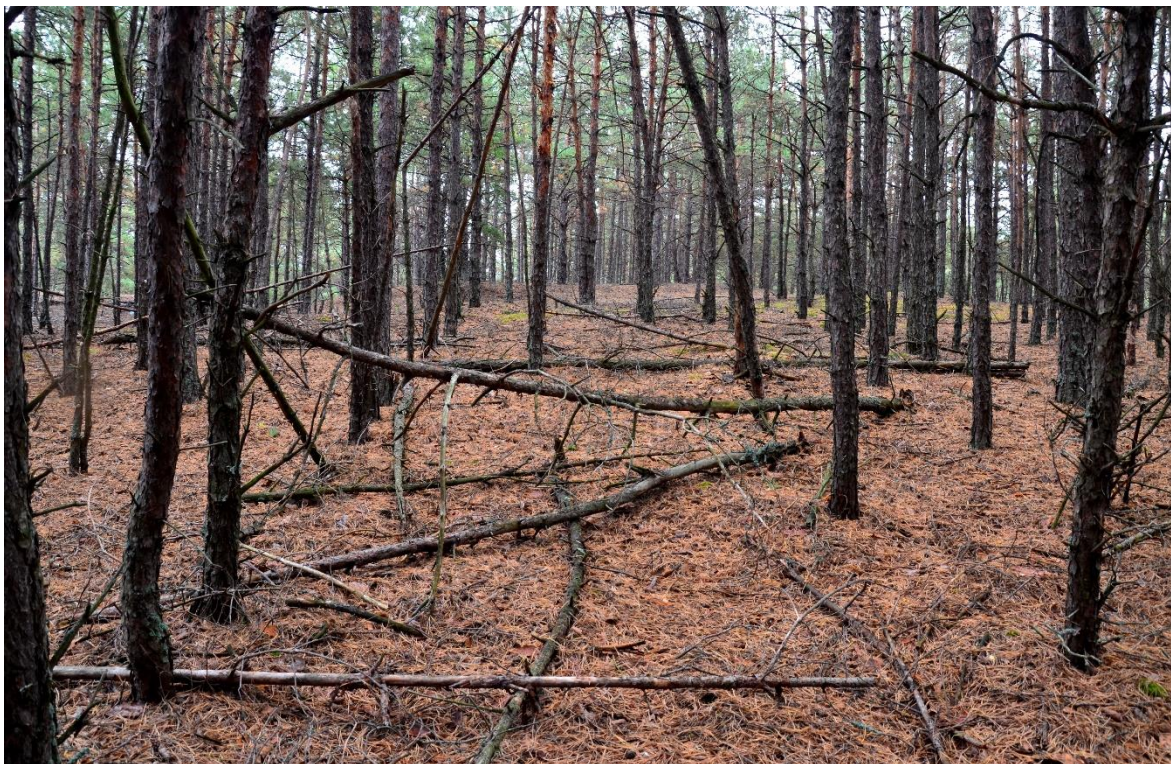
Obr. 12 – Borovicový porost (segment č. 15)