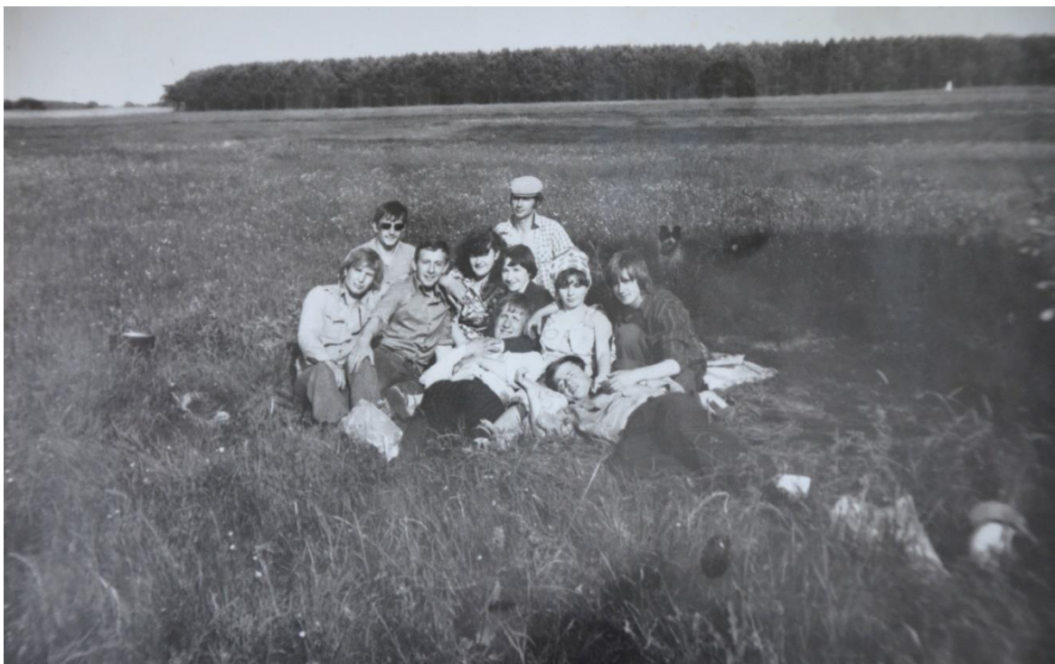
Obr. 31 – Lidé na loukách (1982)