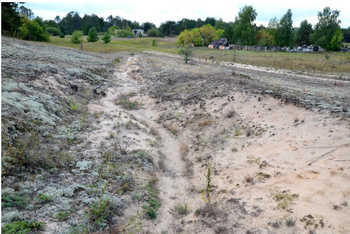
Obr. 15 – Objekt bývalého kolchozu (segment č. 19)