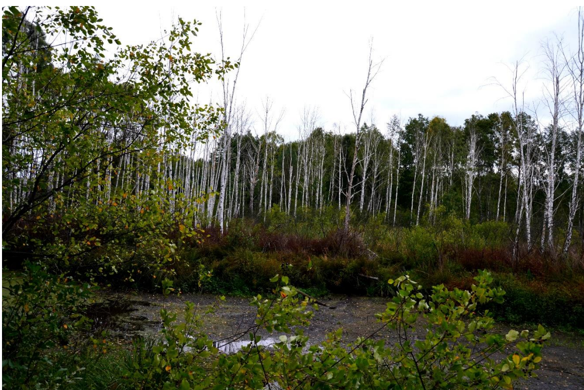
Obr. 22 – Rameno melioračního kanálu s mokřadem (segment č. 4 a segment č. 5)