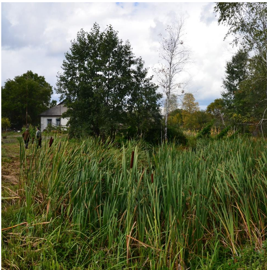
Obr. 24 – Bývalý rybník u rodiny Semenjukových