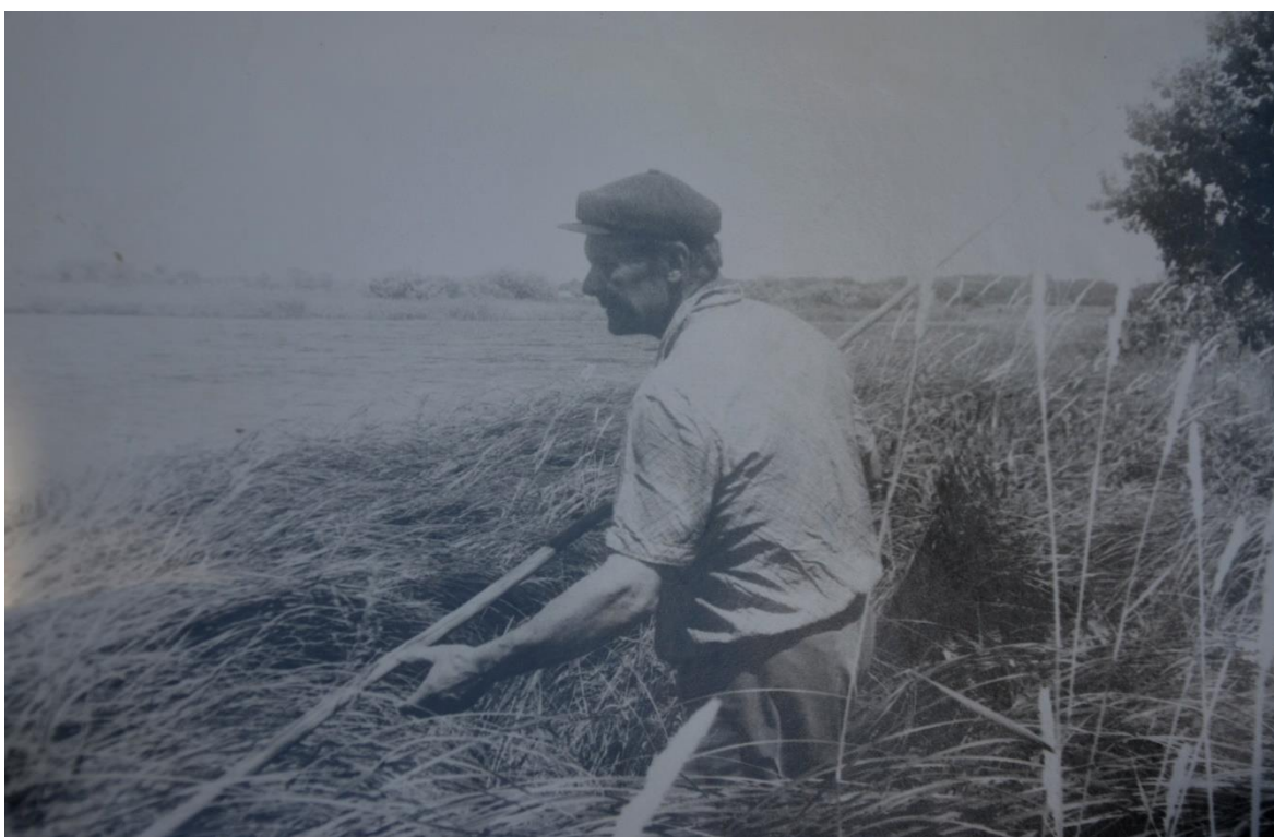
Obr. 32 – Kosení louky (1986)