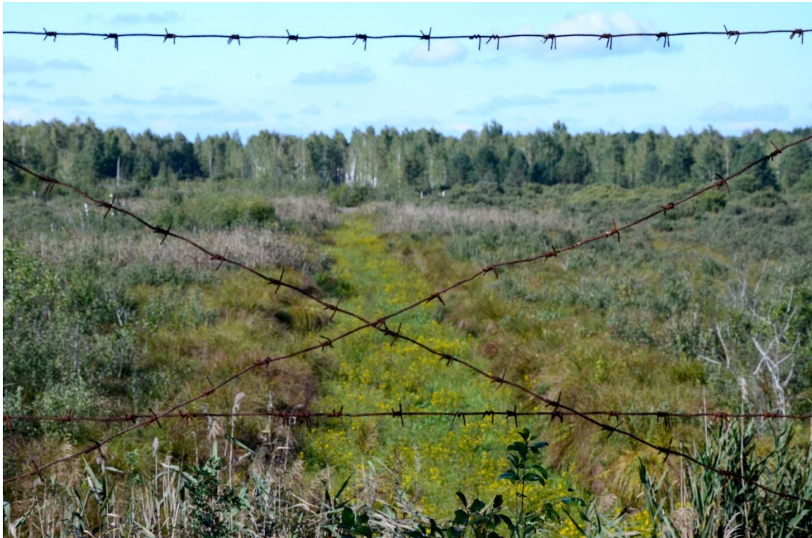
Obr. 11 – Pohled do bezzásahového území 10 km zóny