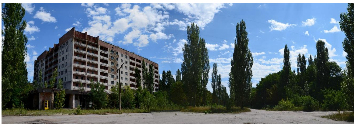
Obr. 4 – Město Pripyat