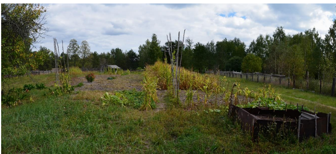
Obr. 26 – Zahrada a pole paní Semjonovny (segment č. 51)