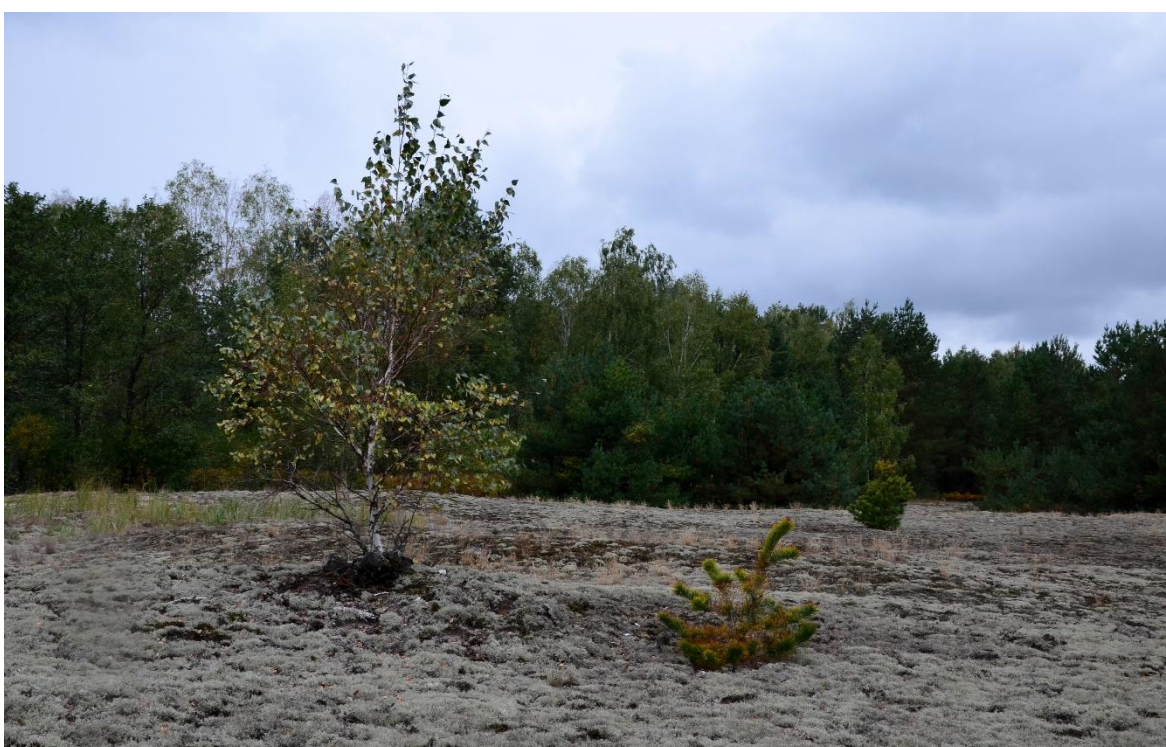
Obr. 20 – Písečná duna (segment č. 11)