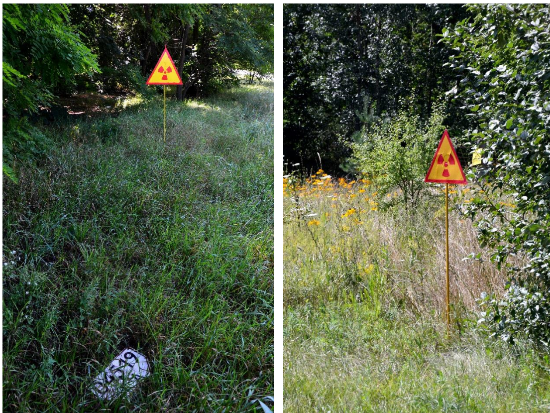
Obr. 2 a 3 – Značky s vysokou radiací v uzavřené 10 km zóně