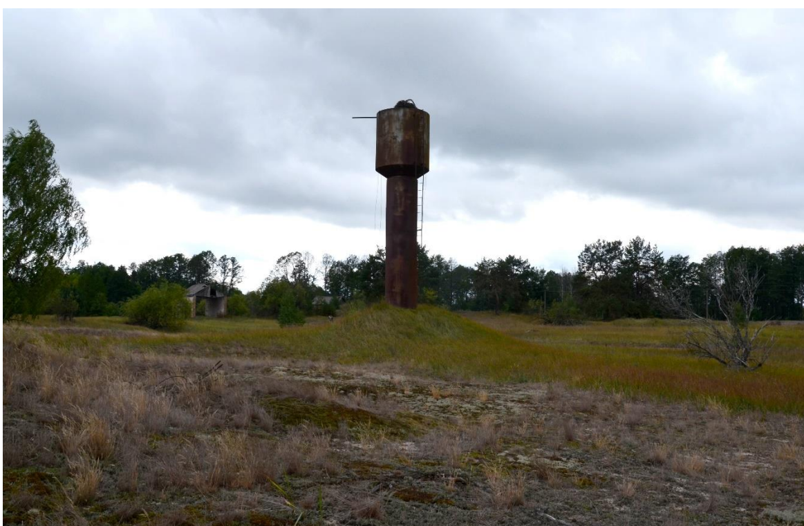
Obr. 16 – Vodojem vybudovaný pro potřeby kolchozu (segment č. 19)