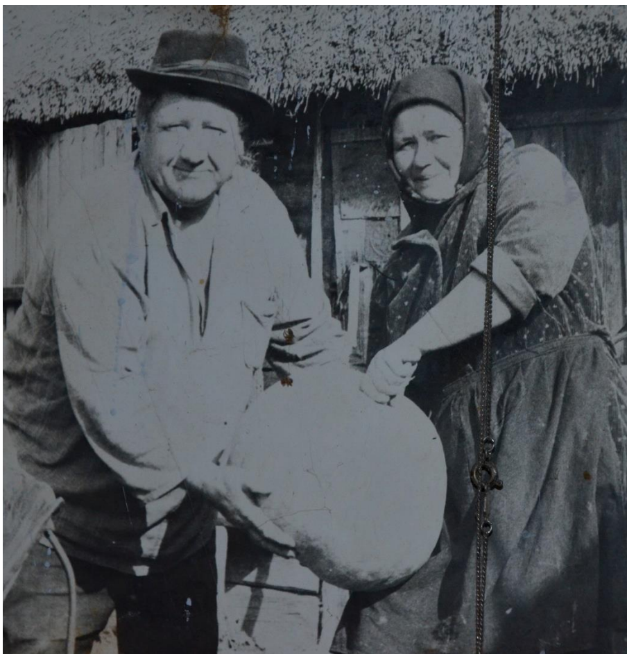
Obr. 33 – Manželský pár s dýní z obce Paryšiv (foto před nehodou JE Černobyl)