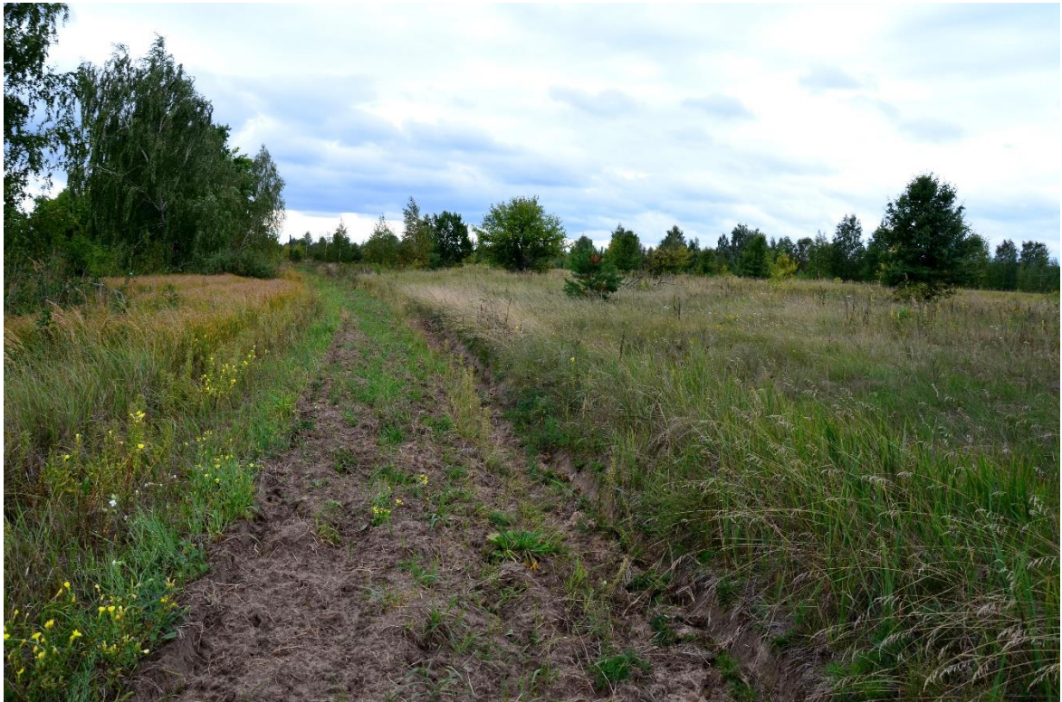
Obr. 23 – Protipožární pás mezi ladem a melioračním kanálem (segment č. 14)