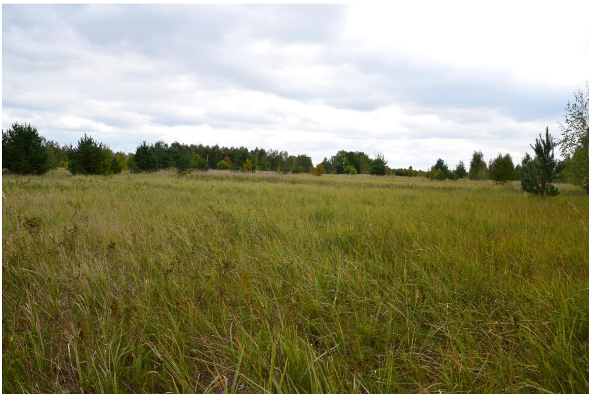
Obr. 17 – Lada (segment č. 1)