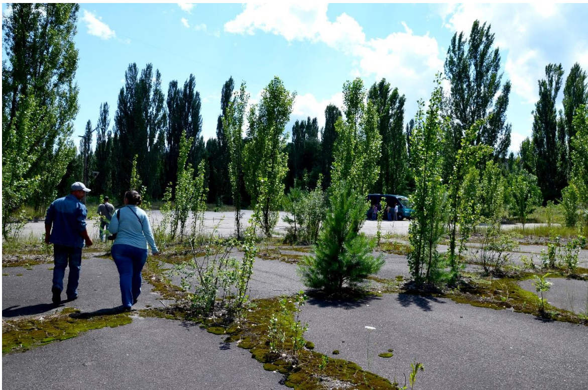
Obr. 8 – Vývoj sukcese