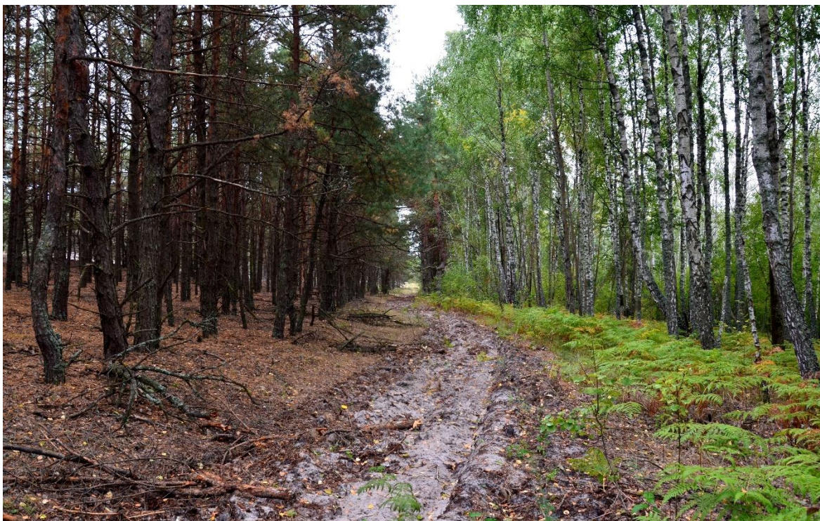
Obr. 13 – Protipožární pás mezi borovicovým porostem a březovým hájem (segment č. 14)