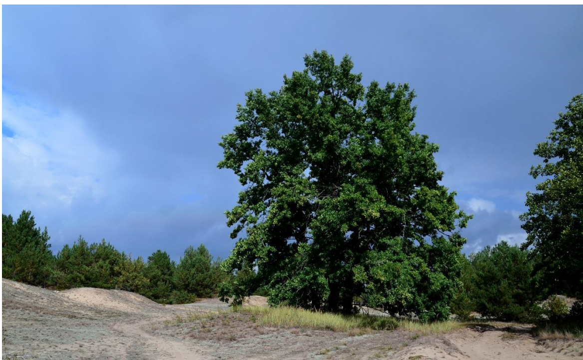
Obr. 14 – Písečná duna se vzrostlým dubem letním (segment č. 20)