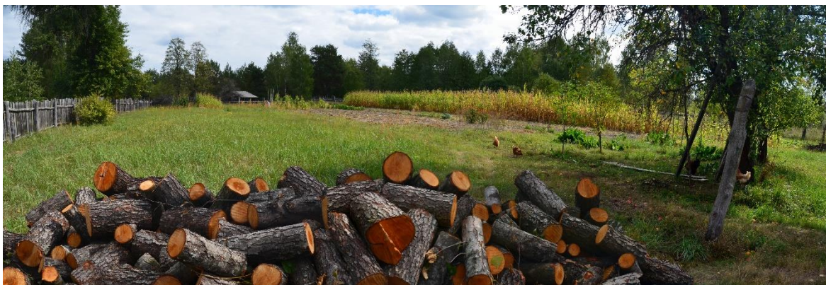
Obr. 27 – Zahrada a pole paní Semjonovny (segment č. 51)