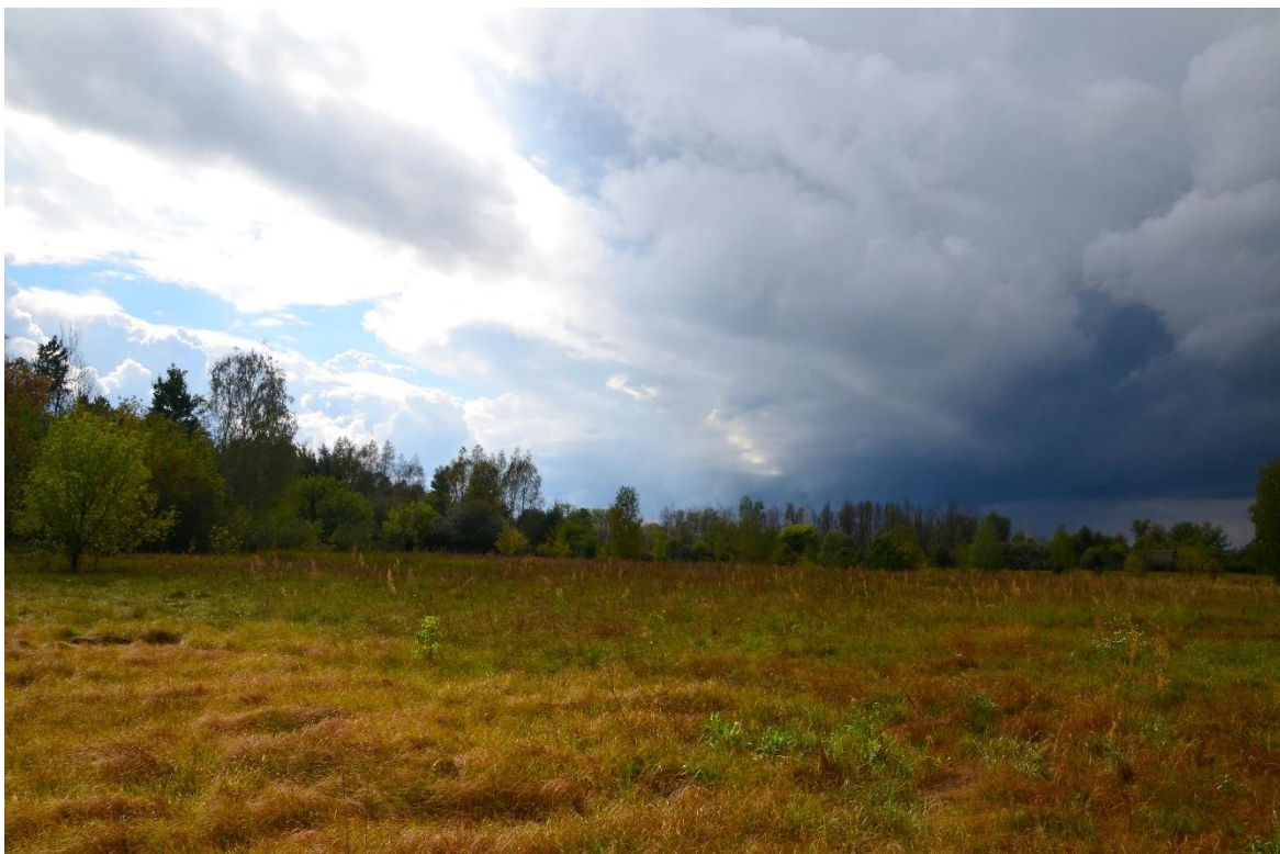
Obr. 19 – Lada (segment č. 27)