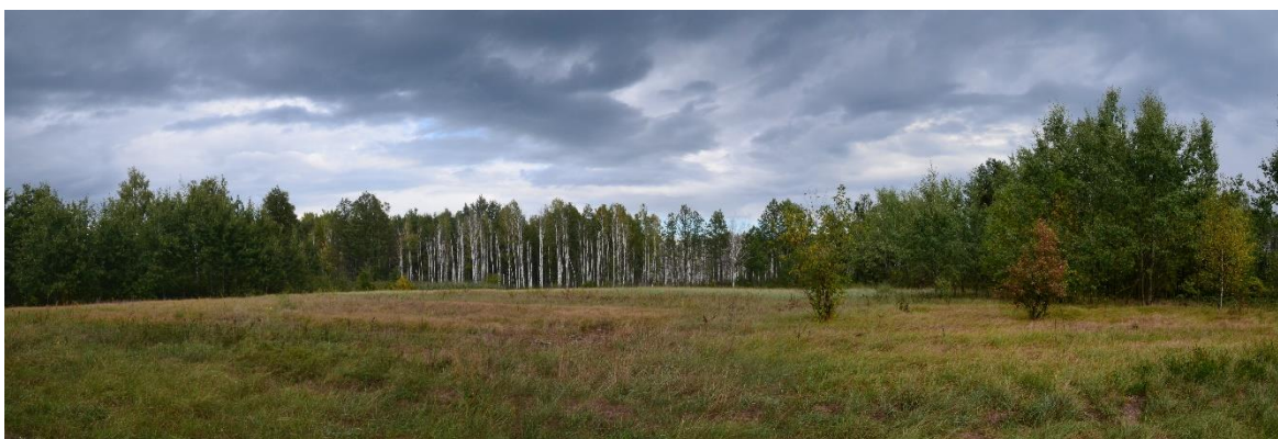
Obr. 18 – Lada s pohledem na doprovodný porost melioračního kanálu (segment č. 27)