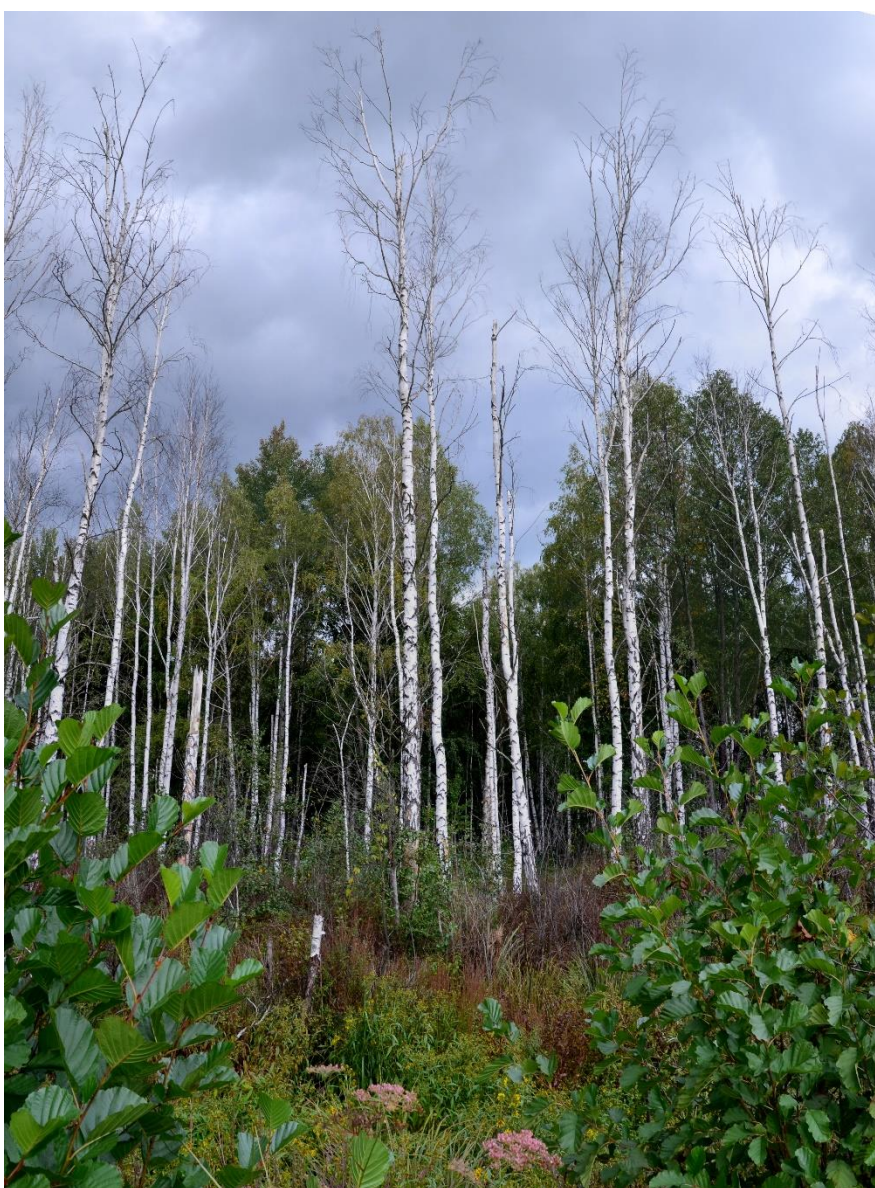
Obr. 28 – Doprovodný porost podél melioračního kanálu (segment č. 25)