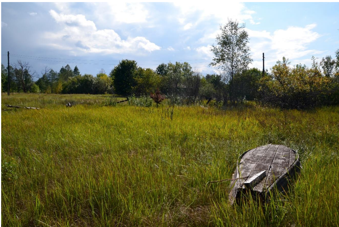
Obr. 21 – Lada (segment č. 59)