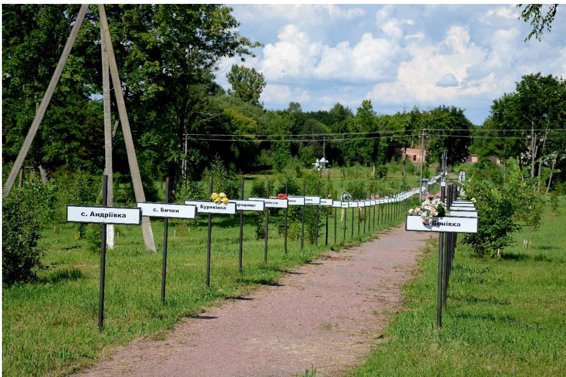
Obr. 10 – Památník zaniklých obcí vlivem havárie jaderné elektrárny Černobyl