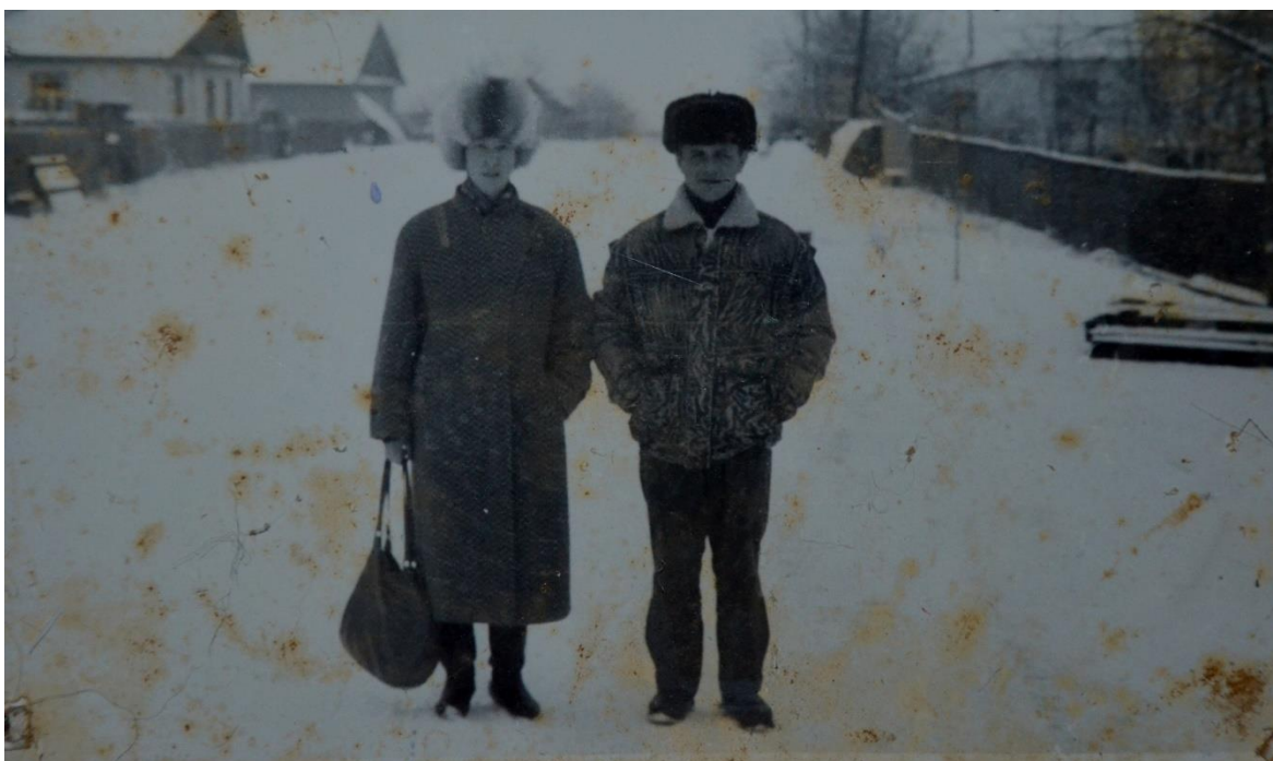
Obr. 34 – Pár na hlavní ulici v obci Paryšiv