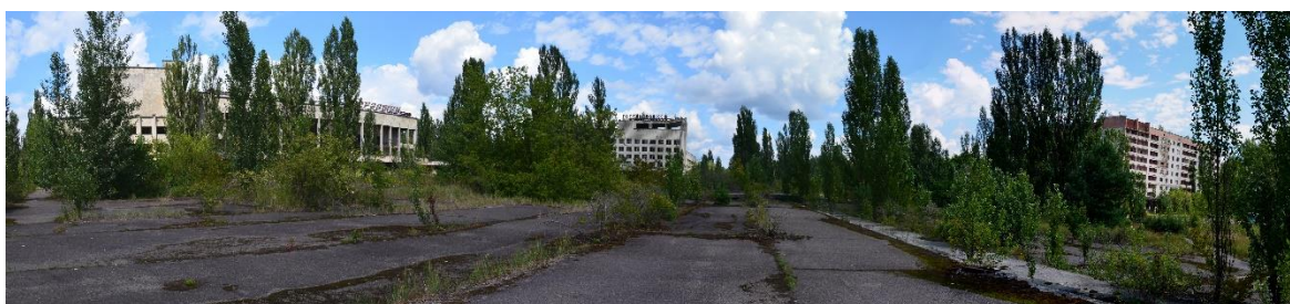
Obr. 5 – Město Pripyat