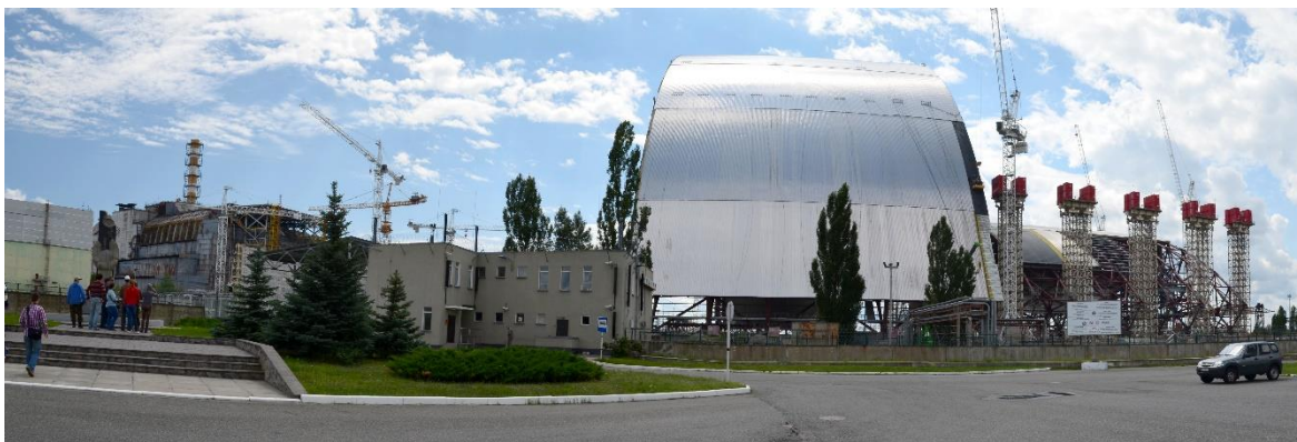
Obr. 9 – 4. blok jaderné elektrárny a připravovaný sarkofág