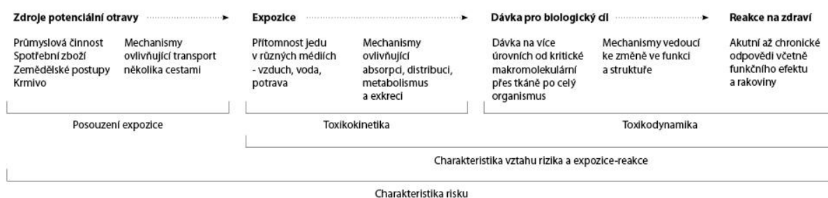
Obrázek 1: Tabulka znázorňující obecné principy průběhu intoxikace toxickou látkou (převzato a upraveno z Gupta 2007).

Reakce organismu na danou jedovatou látku nezáleží jen na samotné povaze látky, ale je ovlivněna i délkou expozice, intenzitou expozice, individualitou daného jedince, kde má významný vliv druh, pohlaví, věk, tělesné kondice, aktuálně probíhající onemocnění, komorbidity i předchozí vystavení dané toxické látce (Gupta 2007).