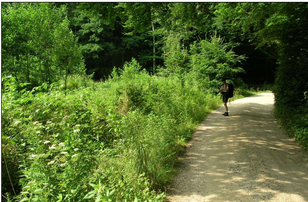
Příloha č. 12: Porosty zlatobýlu kanadského podél cesty v extravilánu Raspenavy (červenec 2014)