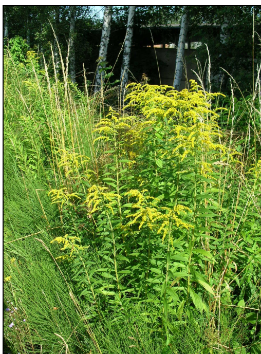
Příloha č. 9: Zlatobýl kanadský v okolí železnice v Raspenavě (červenec 2014)