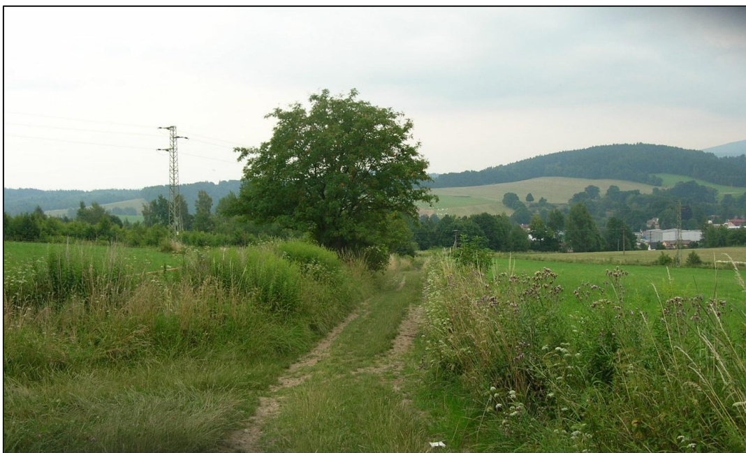
Příloha č. 14: Porosty zlatobýlu kanadského podél cesty na okraji obhospodařované louky v extravilánu Raspenavy (červenec 2014)