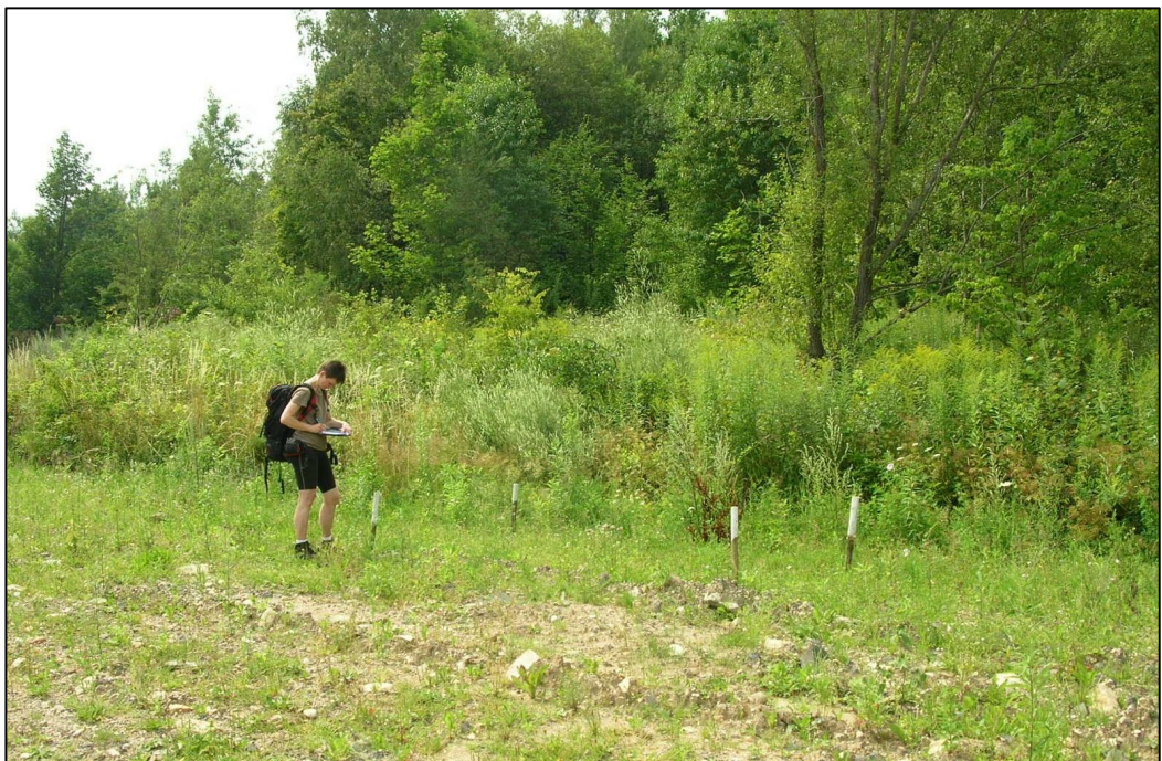
Příloha č. 6: Kontrolní plocha č.2 – na úpatí Vápenného vrchu-body ZP5-ZP8