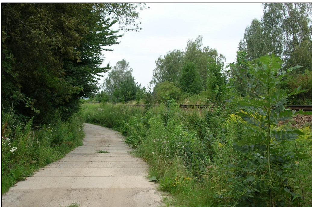
Příloha č. 16: Porosty zlatobýlu kanadského podél cesty, v blízkosti železnice v extravilánu Raspenavy (červenec 2014)