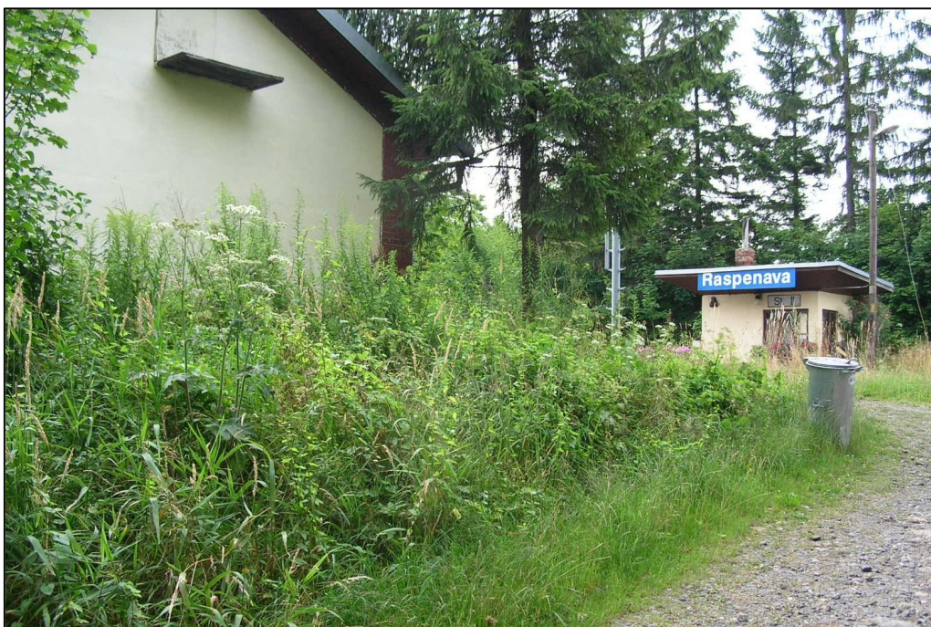
Příloha č.10: Porosty zlatobýlu kanadského v oblasti železniční stanice v Raspenavě (červenec 2014) (autor D. Dytrichová Dedeciusová)