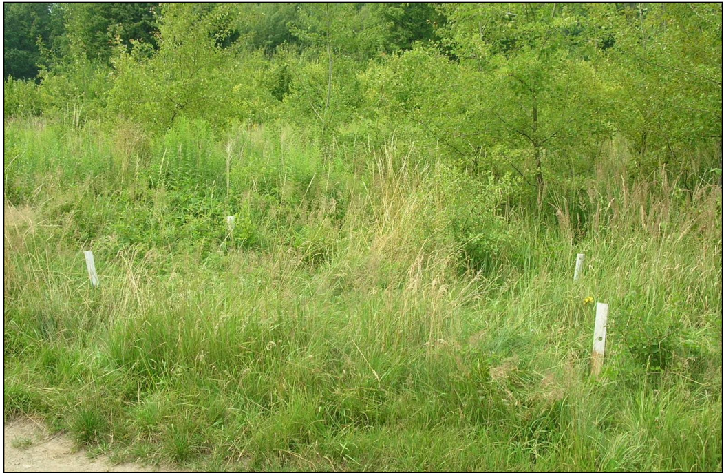
Příloha č. 5: Kontrolní plocha č. 1 – podél cesty u Vápenného vrchu - body ZP1-ZP4