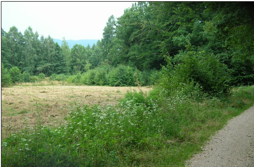
Příloha č. 13: Porosty zlatobýlu kanadského podél cesty na okraji obhospodařované louky v extravilánu Raspenavy (červenec 2014)