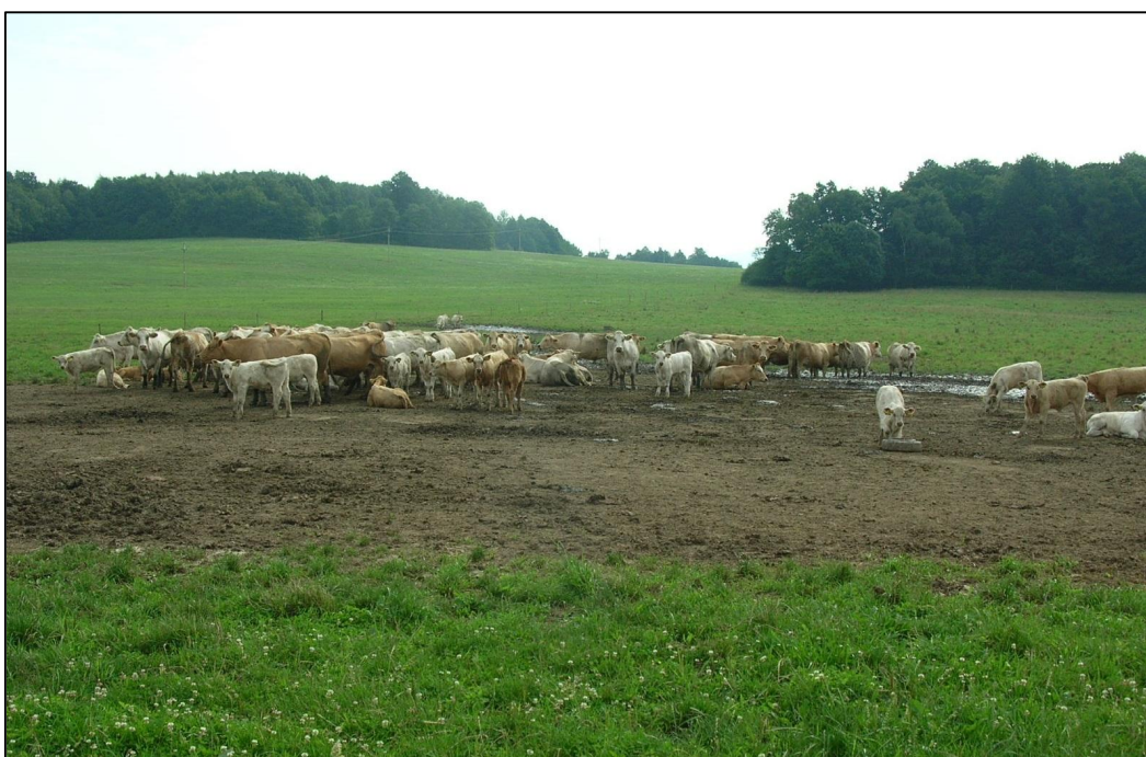
Příloha č.11: Obhospodařované louky v extravilánu Raspenavy v blízkosti Vápenného vrchu (červenec 2014)