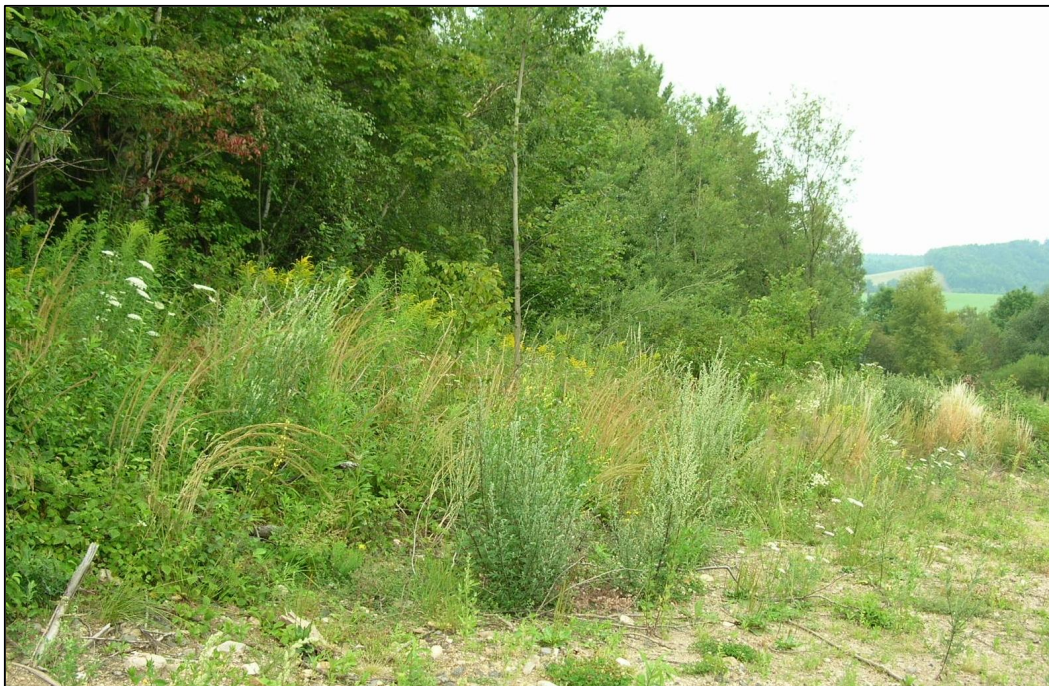
Příloha č. 15: Porosty zlatobýlu kanadského na úpatí Vápenného vrchu v extravilánu Raspenavy (červenec 2014)