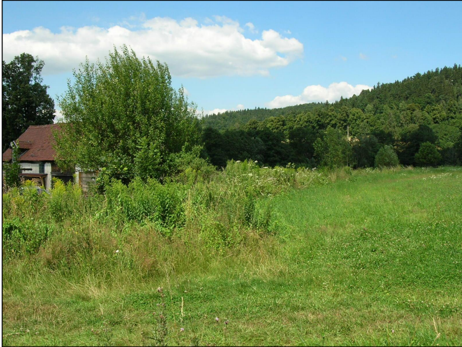
Příloha č. 7: Kontrolní plocha č. 3 – louka pod Lázeňským rybníkem - Hejnice-Lázně Libverda - body ZP9-ZP12