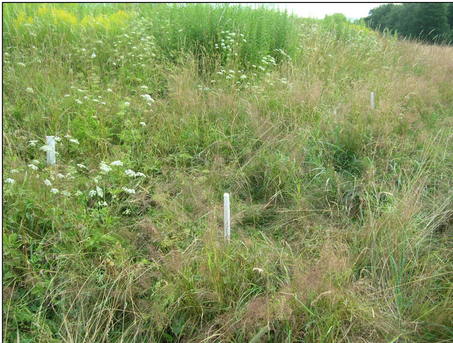
Příloha č. 8: Kontrolní plocha č. 3 – louka pod Lázeňským rybníkem - Hejnice-Lázně Libverda - body ZP9-ZP12