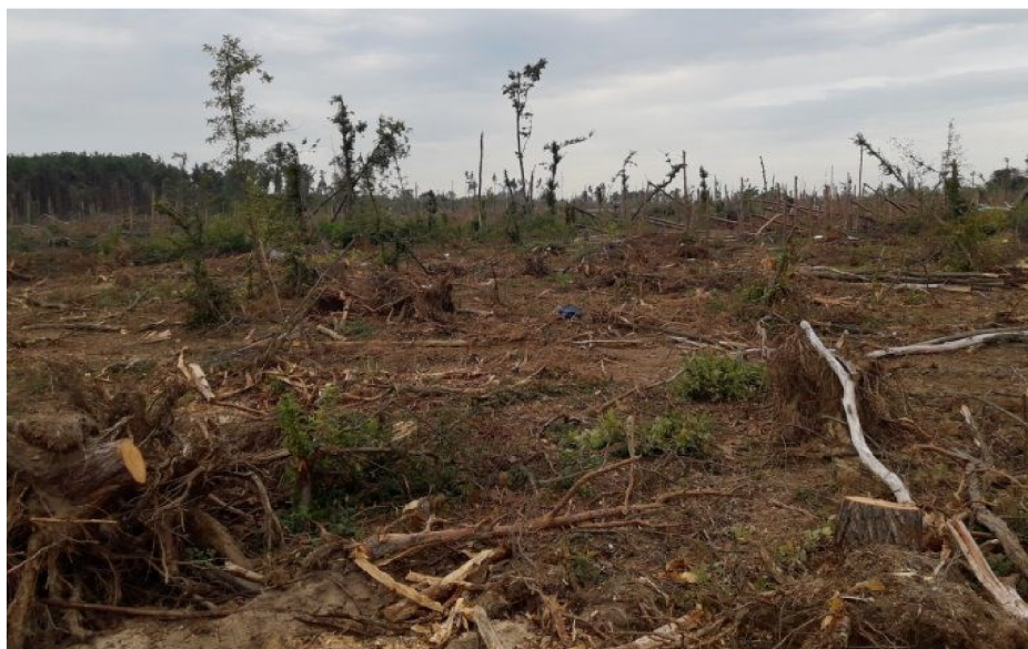
Obrázek 1 Abiotické poškození – vítr

kalamitní stavy, které jsou u menších rozsahů průměrně každých 4-5 let a kalamity velkých rozsahů asi každých 15-20 let.