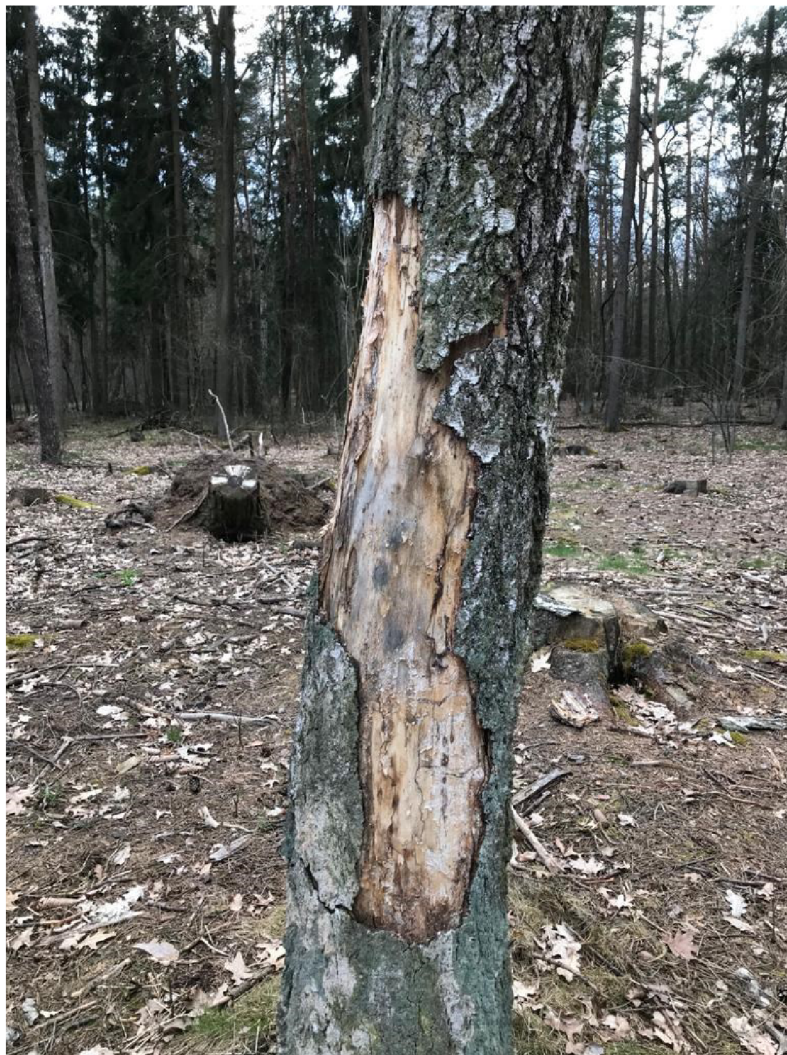
Obrázek 3 Škody loupáním