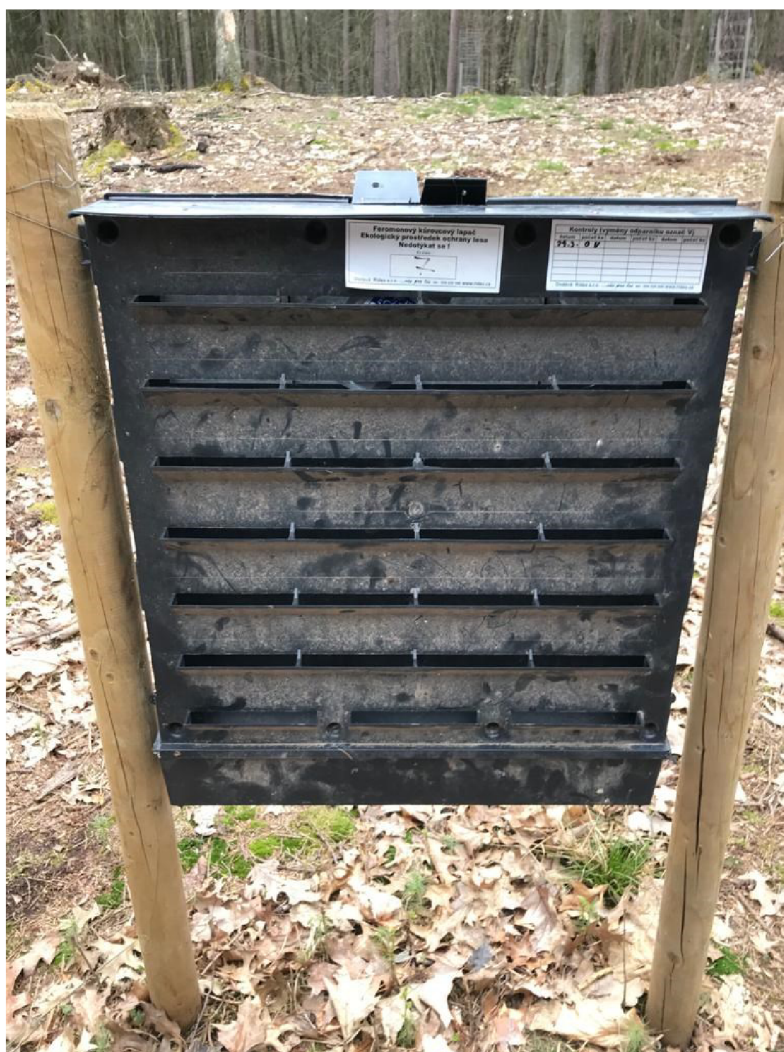
Obrázek 2 Feromonový kůrovcový lapač

Pro prevenci a omezení biotického poškození lesů se používají různé opatření, jako jsou například pravidelné kontroly lesa, aplikace chemických a biologických ochranných prostředků, omezení stresových podmínek pro stromy a podpora biodiverzity v lese. Tyto opatření mohou pomoci snížit dopad biotického poškození lesů a zachovat vysokou kvalitu lesního ekosystému.