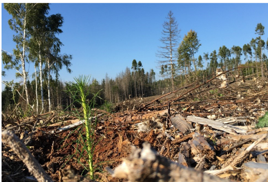
Obrázek 4 Následky klimatických změn

Dalším významným důsledkem klimatických změn na lesy jsou kůrovcové kalamity. V důsledku sucha jsou stromy oslabeny a stávají se náchylnější k napadení kůrovcem. V posledních letech byly zaznamenány obrovské kůrovcové kalamity v mnoha lesních oblastech světa, což má zásadní dopad na lesní ekosystémy a také na hospodářské využití lesů.