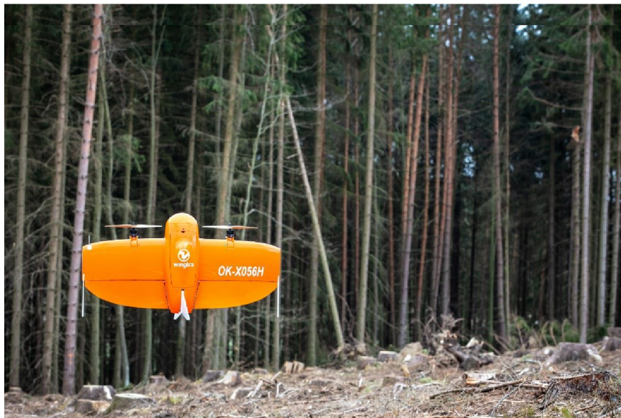
Obrázek 6 Dron SIT

Je důležité si uvědomit, že tyto technologie nejsou dokonalé a mohou být ovlivněny vlivy, jako jsou oblačnost a lesní kryt. Nicméně, využití informačních technologií umožňuje rychlé a efektivní získání informací o stavu lesa a jeho poškození.