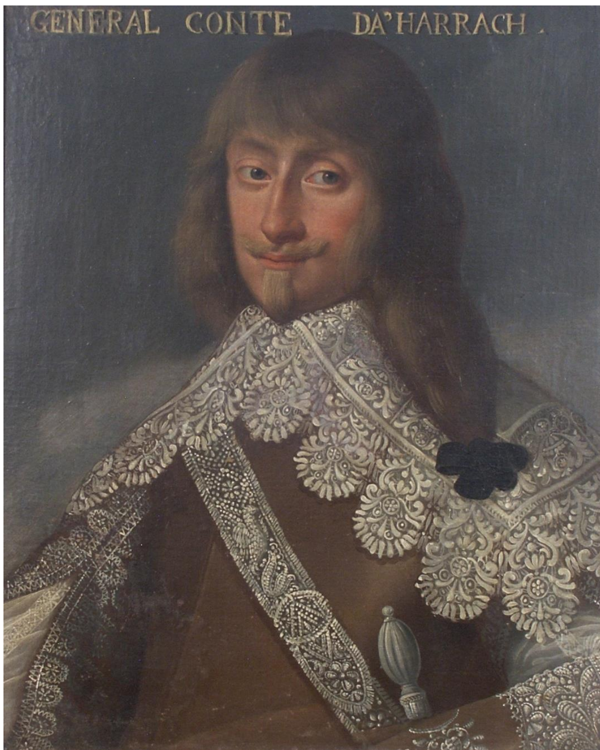
Obrázek 3 Otto Bedřich hrabě z Harrachu. Detail namalovaný dle většího portrétu. ÚPS v Praze, sbírky SK Konopiště, inv. č. K-14687a.