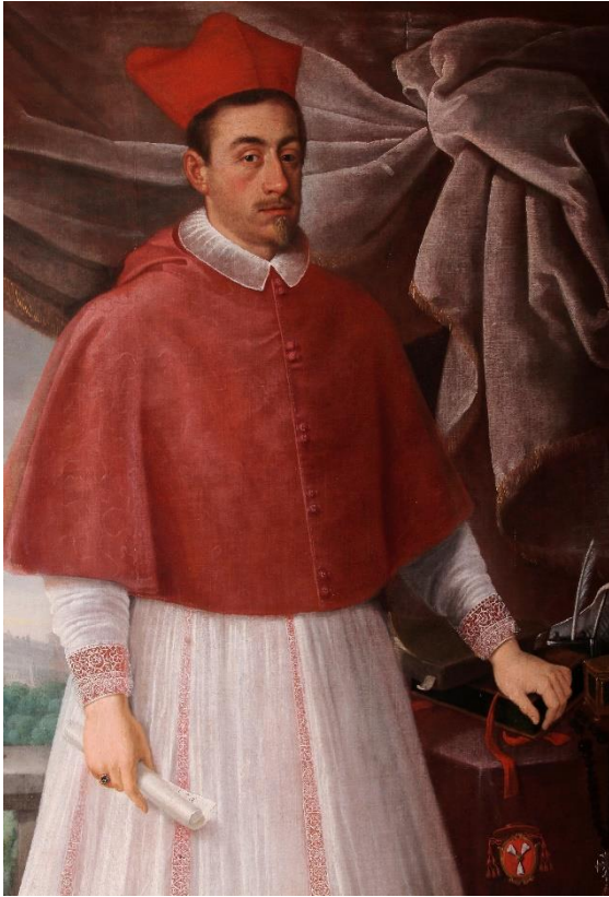
Obrázek 9: Arnošt Vojtěch kardinál z Harrachu. Detail. Fotosbírka NPÚ ÚOP v Josefově, sbírky SZ Hrádek u Nechanic, inv. č. HN01386/001.