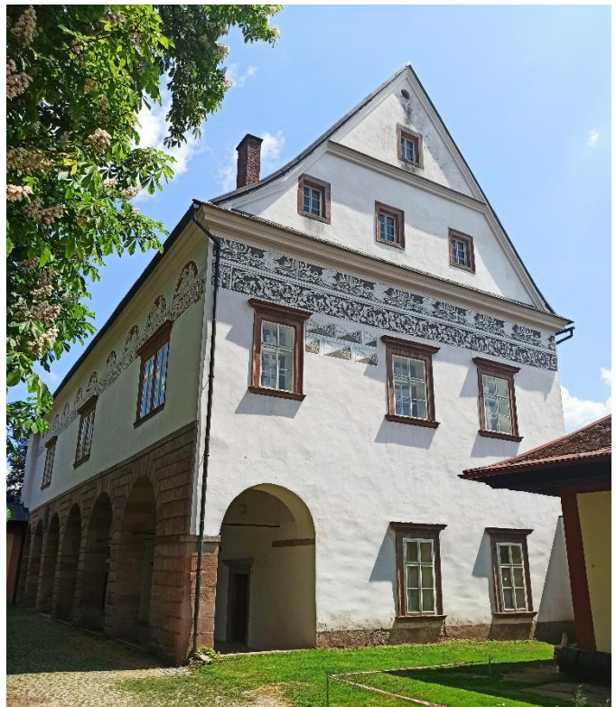
Obrázek 12: Zámek Horní Branná od západu.