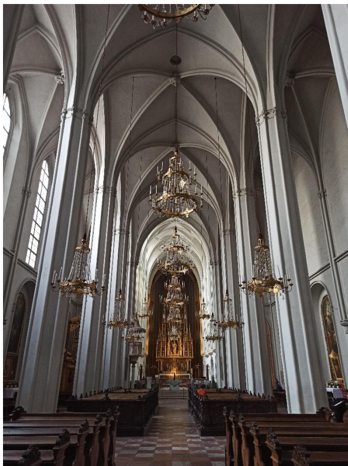
Obrázek 14: Interiér kostela sv. Augustina ve Vídni.