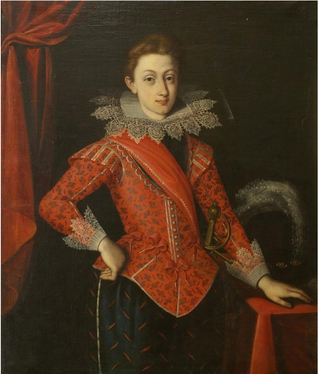
Obrázek 2: Otto Bedřich hrabě z Harrachu jako chlapec. 2. pol. 17. stol. Fotosbírka NPÚ ÚOP v Josefově, sbírky SZ Hrádek u Nechanic, inv. č. HN01645/001.