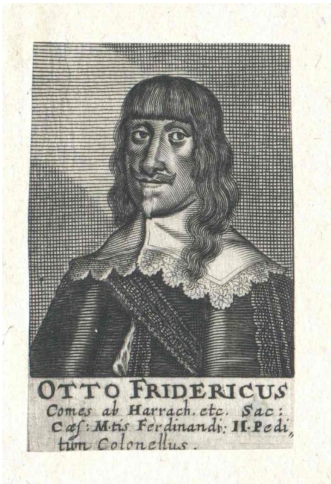
Obrázek 5 Otto Bedřich hrabě z Harrachu. Otištěno roku 1663. Österreichische Nationalbibliothek sign. PORT_00150895_01.