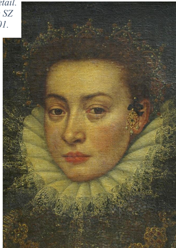
Obrázek 8: Marie Alžběta z Harrachu roz. ze Schrattenbachu. Detail. Fotosbírka NPÚ ÚOP v Josefově, sbírky SZ Hrádek u Nechanic, inv. č. HN03816/001.