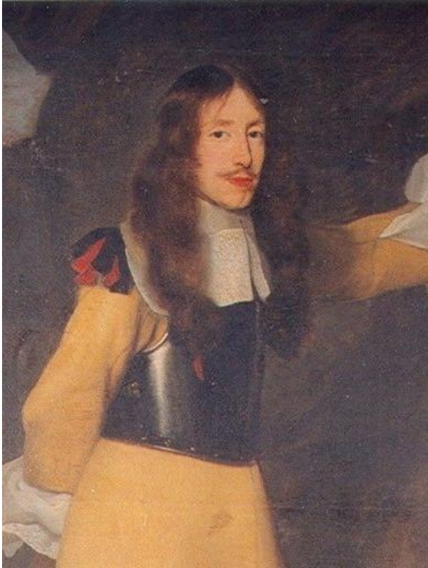
Obrázek 11: Ferdinand Bonaventura hrabě z Harrachu. Detail. inv. č. HN01277/001.