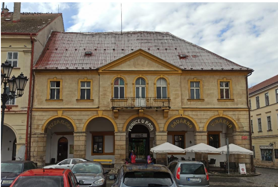
Obrázek 13: Zárubovský, později Harrachovský dům v Jičíně. Čp. 38.