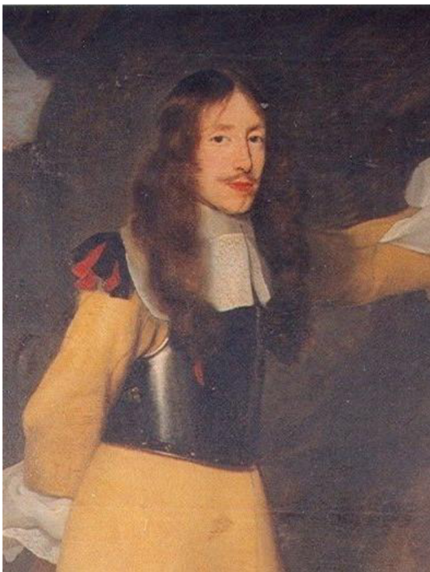
Obrázek 11: Ferdinand Bonaventura hrabě z Harrachu. Detail. Fotosbirka NPÚ ÚOP v Josefově, sbírky SZ Hrádek u Nechanic, inv. č. HN01277/001.