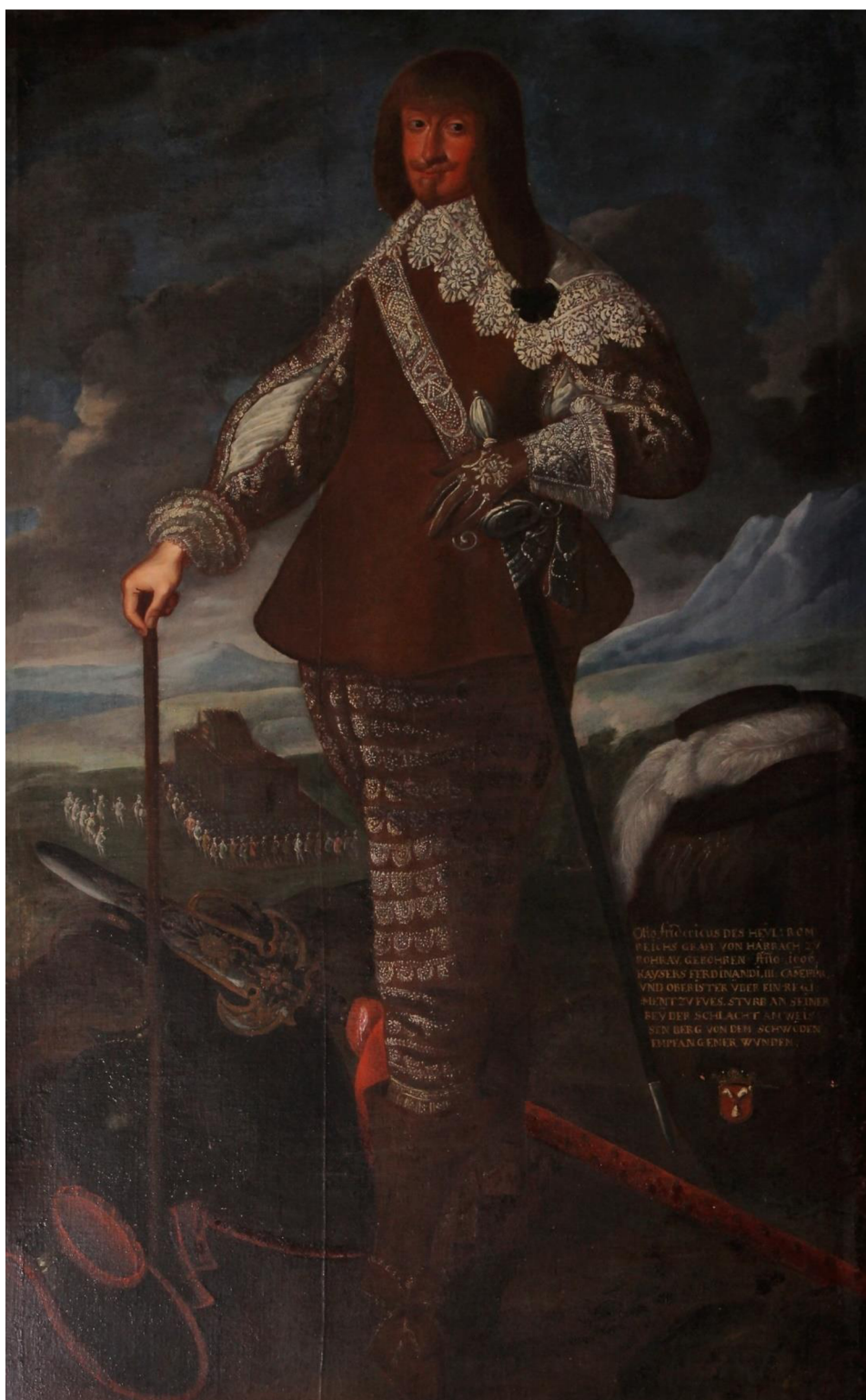
Obrázek 1: Hrabě Otto Bedřich z Harrachu. Okolo roku 1650. Fotosbirka NPÚ ÚOP v Josefově, sbírky SZ Hrádek u Nechanic, inv. č. HN01384/001.