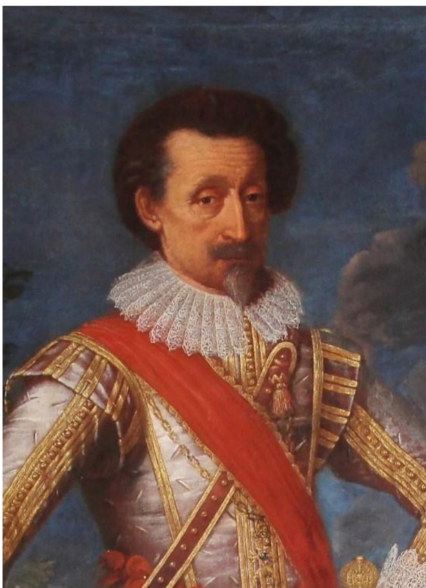
Obrázek 7: Karel I. hrabě z Harrachu. Detail. Fotosbirka NPÚ ÚOP v Josefově, sbírky SZ Hrádek u Nechanic, inv. č. HN01380/001.