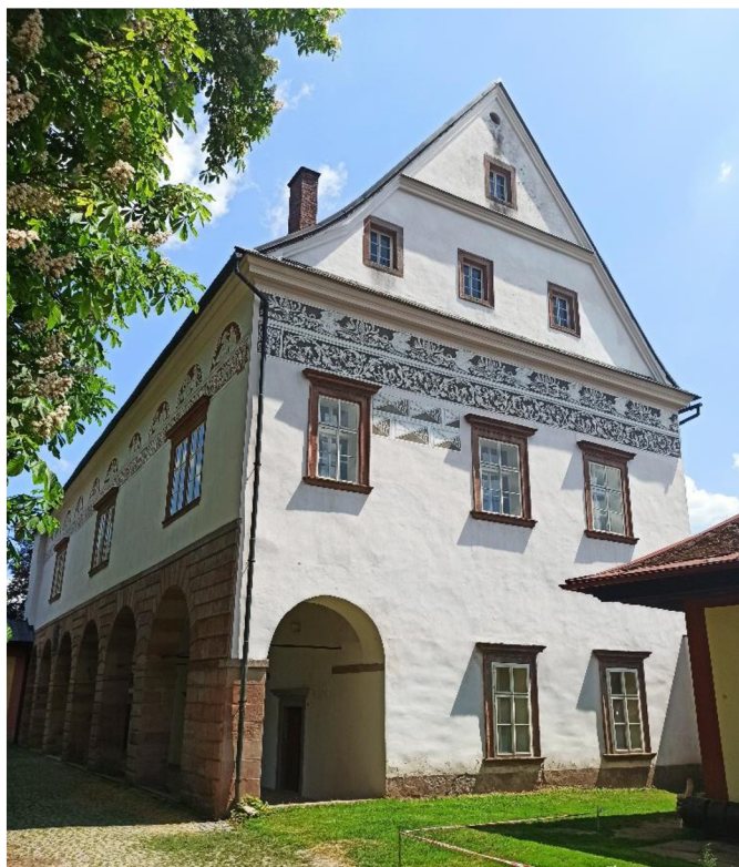
Obrázek 12: Zámek Horní Branná od západu.