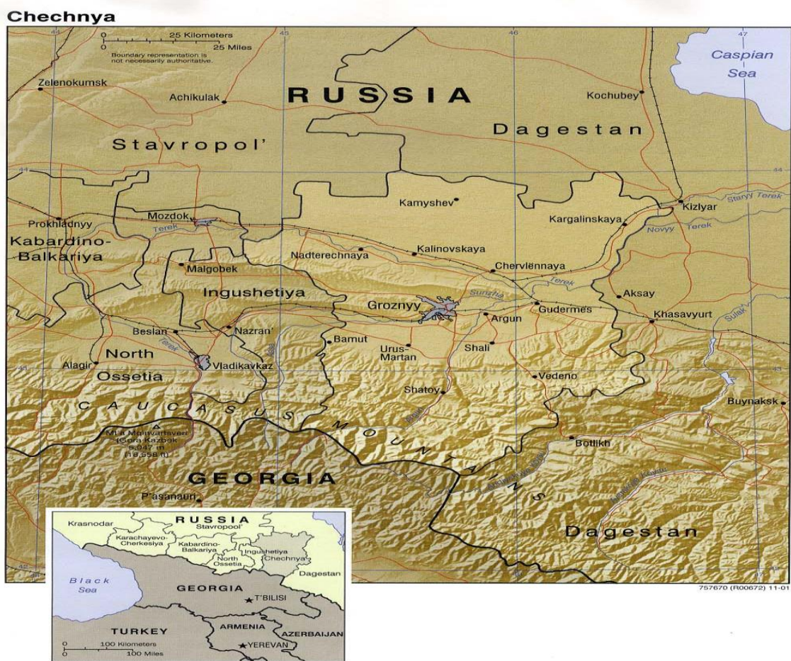
Obrázek 1: Čečensko