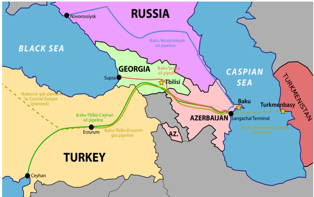
Obrázek 2: Ropovod Baku – Novorossiysk

transport ázerbajdžánské ropy úplně vyhnul čečenskému území. Cena vybudování a následné ochrany tohoto úseku potrubí by pak byla určitě výrazně nižší než materiální a lidské škody způsobené válkou. (Ashour, 2004) Na obrázku níže je modrou barvou zobrazena trasa ropovodu Baku – Novorossiysk, který je v současnosti právě z důvodu rusko-čečenských sporů veden mimo území této republiky. K rozhodnutí o vynechání čečenského úseku se však rozhodlo až po událostech v rámci konfliktu v roce 1997.