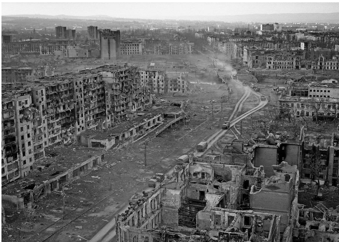
Obrázek 3: Poválečný Groznyj