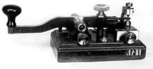
Obrázek 2 Morseův telegraf

Dalšího roku 1878 bylo zavedeno první dálkové spojení s hasiči a to pomocí morseových přístrojů, další signál byl pomocí zvonkových požárních hasičů.