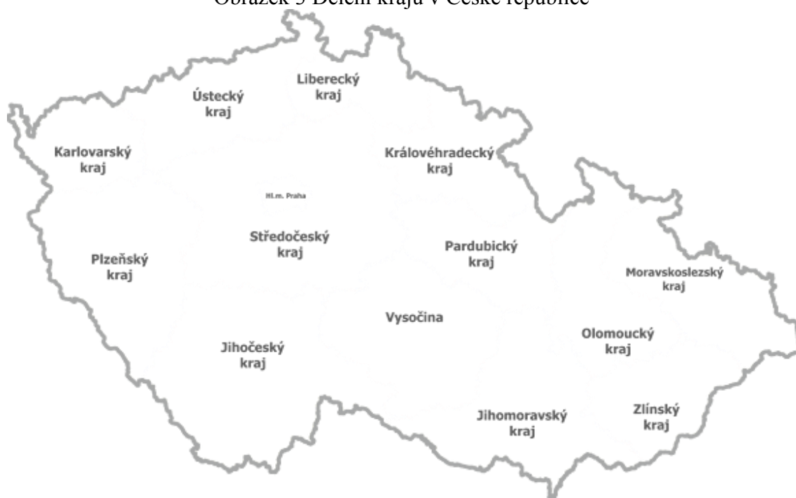
Obrázek 3 Dělení krajů v České republice