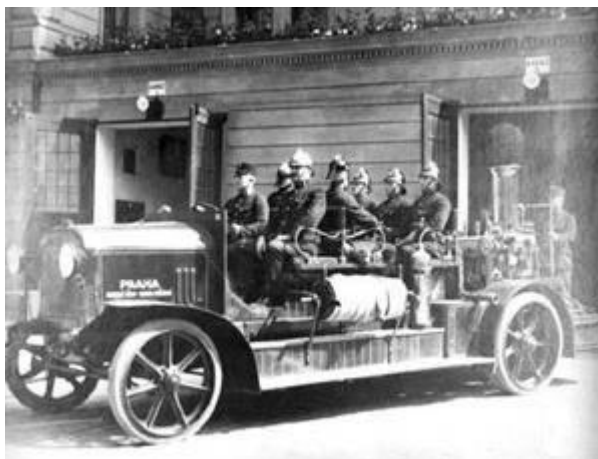
Obrázek 1 Výstroj a požární vozidlo