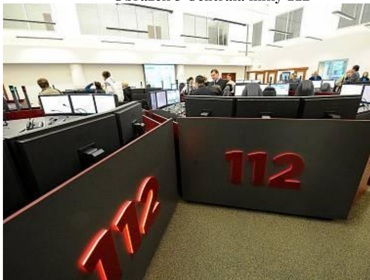
Obrázek 5 Centrála linky 112

Hlavní centrála linky 112 sídlí v Praze na ulici Sokolská.