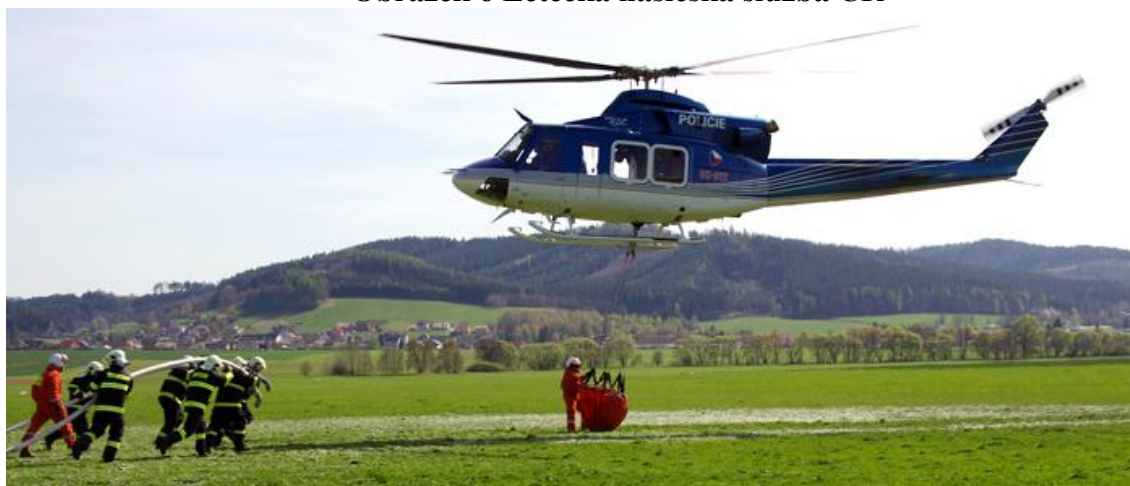
Obrázek 6 Letecká hasičská služba ČR

Ohledně příprav požární jednotky a spolupráce s leteckou technikou byl vydán konспект odborné přípravy požárních jednotek.