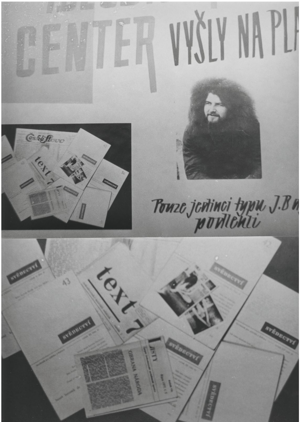
Příloha č. 10b.