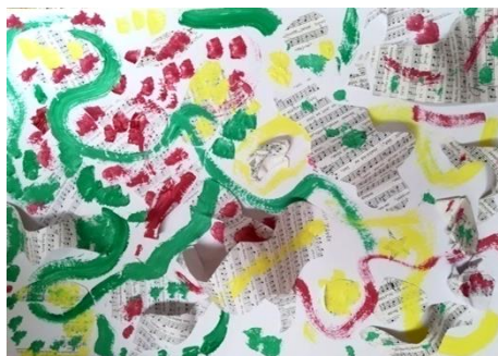
Obr.10: Muzikomalba - cesta hudby.