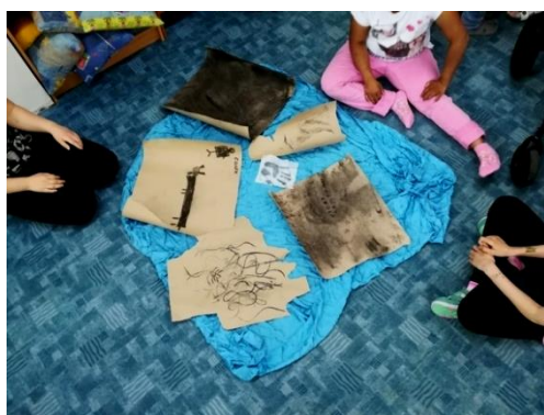
Obr. 4: Hotové výtvary na plášti.