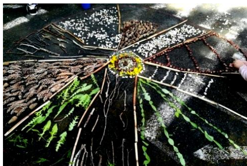
Obr. 7: Výsledek společné práce – mandala z přírodnin.

Téma hodiny: Mandala z přírodních materiálů