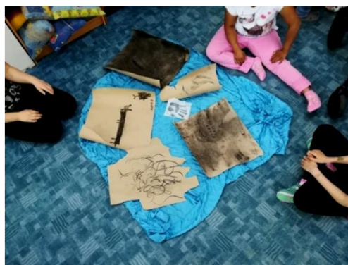
Obr. 4: Hotové výtvoru na plášti.