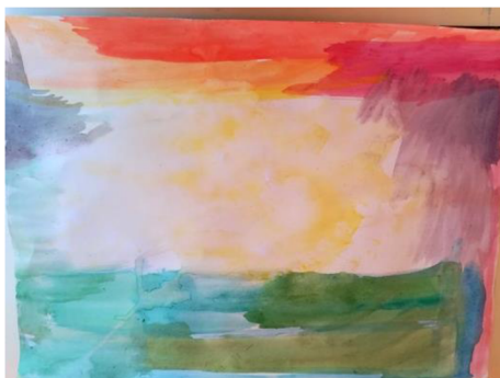
Obr. 1: Pohled, co žákyně viděla z letícího balonu.