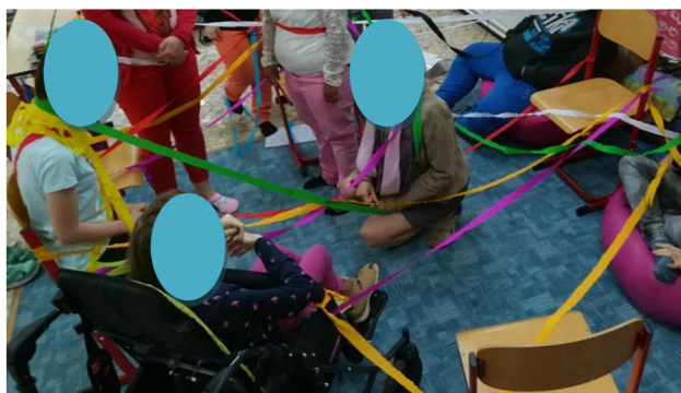
Obr. 12: Síť vztahů ve třídě.