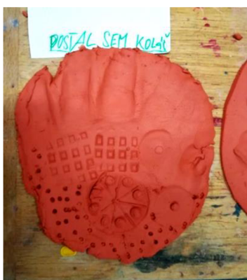
Obr. 8: Ruka, která dostala koláč.