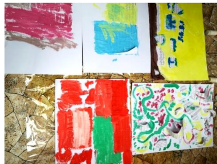
Obr. 11: Výtvary s inspirací hudby.