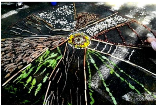
Obr. 7: Výsledek společné práce – mandala z přírodnin.

Téma hodiny: Mandala z přírodních materiálů