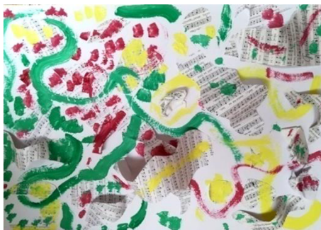
Obr.10: Muzikomalba - cesta hudby.