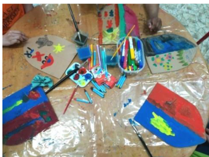
Obr. 5: Proces tvorby erbů.