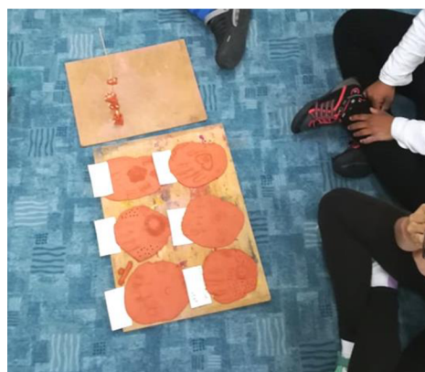
Obr. 9: Hotové výtvary rukou.