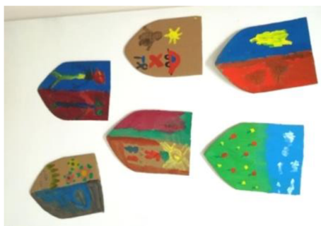
Obr. 6: Dokončené erby.