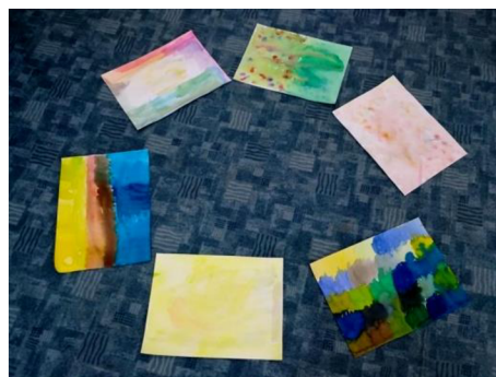
Obr. 2: Výtvary různých barev a představ.

Téma hodiny: Práce s barvami a imaginací