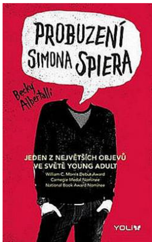
Obr. 1: Obálka románu Probuzení Simona Spiera ( https://www.databazeknih.cz/img/books/32_321804/bmid_probuzeni-simona-spiera-IWw-321804.jpg )

1) Podívej se na obal knihy. O čem si myslíš, že by mohl příběh být? Proč?