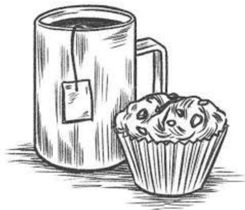
Muffin a čaj 1

Poděl se se spolužákem v lavici o to, jaký je tvůj oblíbený nápoj a zákusek. Zkuste se pobavit také o tom, s kým byste na tuto dobrotu nejraději zašli a proč 😊