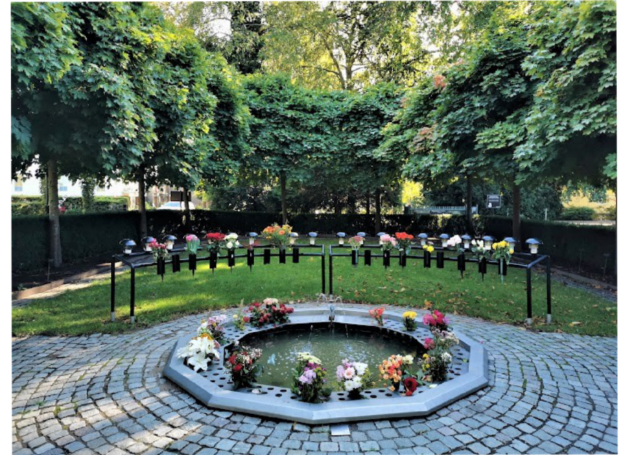
Označte jen jednu elipsu na každém řádku.