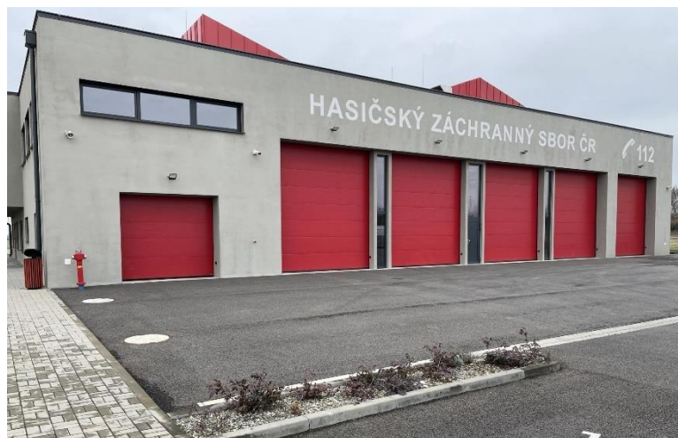
Obrázek 1: Stanice HZS Holešov (P2)

P4 – Stanice v obci/části obce nad 30 000 obyvatel, zajišťující výjezd dvou družstev. Aktuálně je 15 stanic typu P4 v ČR.