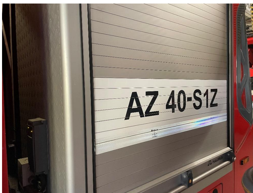
Obrázek 4: Příklad AZ40