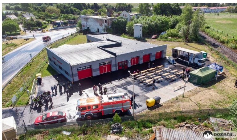
Obrázek 2: Zbrojnice JSDH Zákupy

Hasičské zbrojnice se nachází ve většině vesnicích a městech. Slouží k uskladnění hasičských automobilů a dalšího vybavení používaného dobrovolnými hasiči. Mnohdy se zbrojnice liší svými rozměry, kdy velkou roli hraje kategorie JPO a tím i vybavenost jednotky. Součástí každé zbrojnice jsou především prostory pro garážování hasičských aut a dalšího vybavení, ale ne každá zbrojnice disponuje šatnami, hygienickým zařízením, posilovnou a dalšími prostory. Hasičské zbrojnice jsou symboly hrdosti a komunity dobrovolných hasičů.