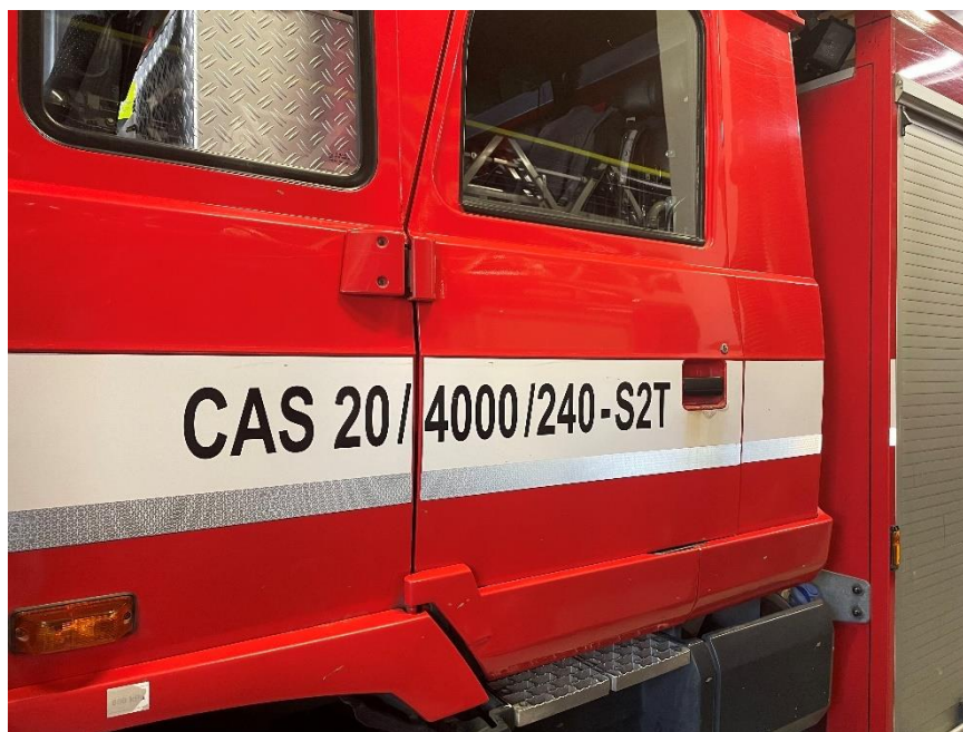
Obrázek 3: Příklad CAS20