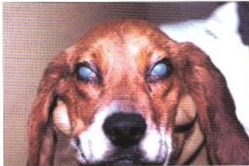
Obr. 10: Zákal rohovky, tzv. „modré oko“ ( Day et al., 2012)

[virus infekční laryngotracheitidy psů]. Pokud se dodrží vakcinační schéma – vakcinace s revakcinací v intervalech 3 – 4 týdnů atenuovanou vakcínou s CAV – 2, je zajištěna velice dobrá imunita nejen proti infekční hepatitidě, ale taky proti „psincovému kašli“ [infekční laryngotracheitidě]. S vakcinací se může začít v 9 – 12 týdnech [dle situace i dříve] s nejméně jednou revakcinací v intervalu 3 – 4 týdnů (Svoboda et al., 2001). Po vakcinaci proti CAV – 2 se dostavuje účinná ochrana po 5 – 7 dnech (Day et al., 2012). Pokud pes prodělá přirozenou infekci, má zajištěnou celoživotní imunitu (Svoboda et al., 2001).