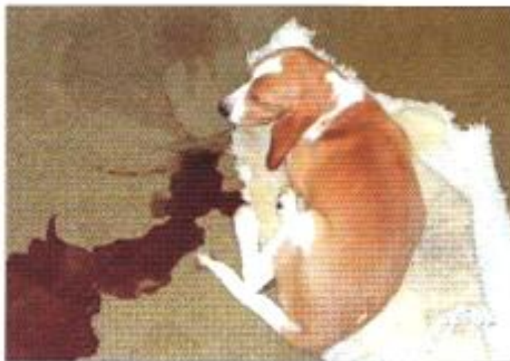
Obr. 5: Silný krvavý průjem psa infikovaného CPV - 2 (Day et al., 2012)

Léčba parvovirózy je hlavně symptomatická. Základem je rehydratace a podání účinných antibiotik. Je možné aplikovat imunoglobuliny, ale efekt lze očekávat jen na počátku onemocnění (Svoboda et al., 2001). V současné době i přes dostupnost vakcinace je parvoviróza jednou z nejvýznamnějších infekcí malých zvířat. Zásadní význam pro stanovení diagnózy má přímý průkaz viru – nejčastěji imunochromatografické testy (Křivda et al., 2012).