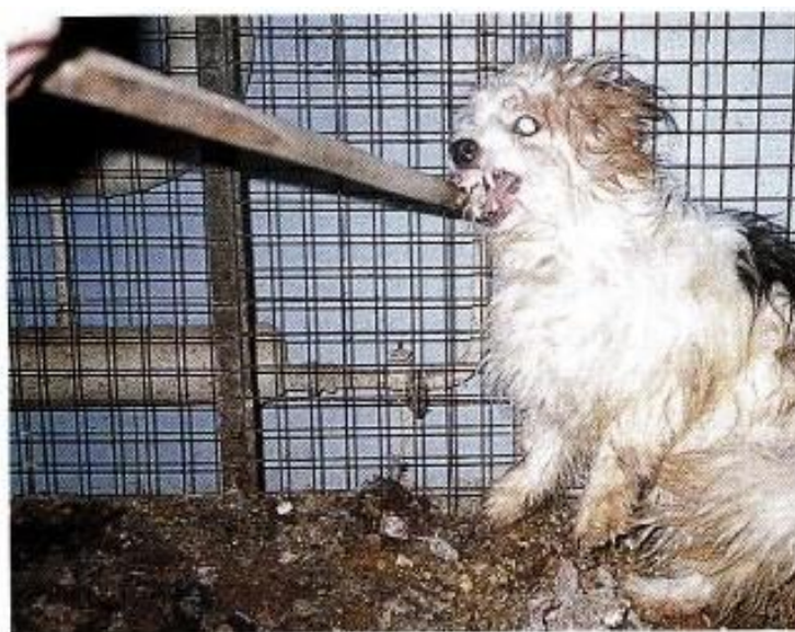
Obr. 3: Pes nakažený vzteklinou kouše do okolních předmětů (Svoboda et al., 2001)

Excitační stádium odpadá u tiché formy a prodromální příznaky přecházejí bez projevů zuřivosti přímo do stádia paralytického (Svoboda et al., 2001). Onemocnění vzteklinou potvrdí mikroskopické vyšetření mozku a infikování myší (Sova, 1987). Vzteklnina se řadí mezi zoonózy a terapie neexistuje (Svoboda et al., 2001).