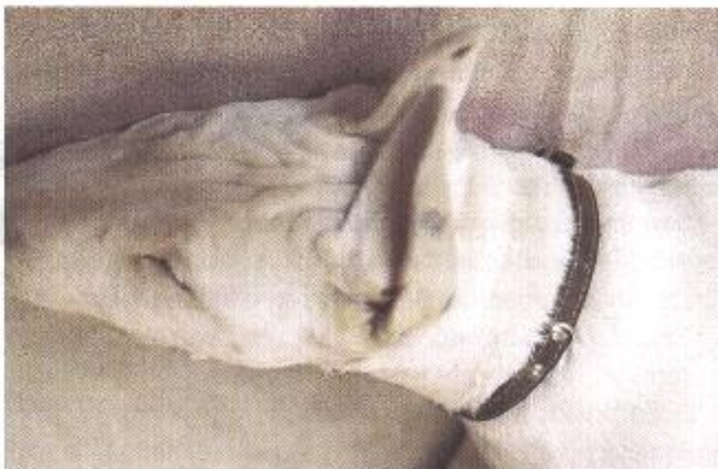
Obr. 6: Tetanus – nepřirozená pozice uší (Svoboda et al., 2001)

Tetanus lze úspěšně vyléčit za předpokladu intenzivní péče a vhodné léčby (Low et al., 2006), ale je to finančně i časově náročné [několikatýdenní hospitalizace] (Svoboda et al., 2001). Tetanus u psů je velmi vzácný. Hlavní prevencí je ošetření a dezinfekce poranění, popřípadě při velkém znečištění rány aplikace protitetanové injekce (Sova, 1987).