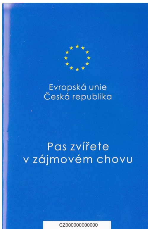
Obr. 8: Pas zvířete v zájmovém chovu (Michalíková Nikol, 2013)