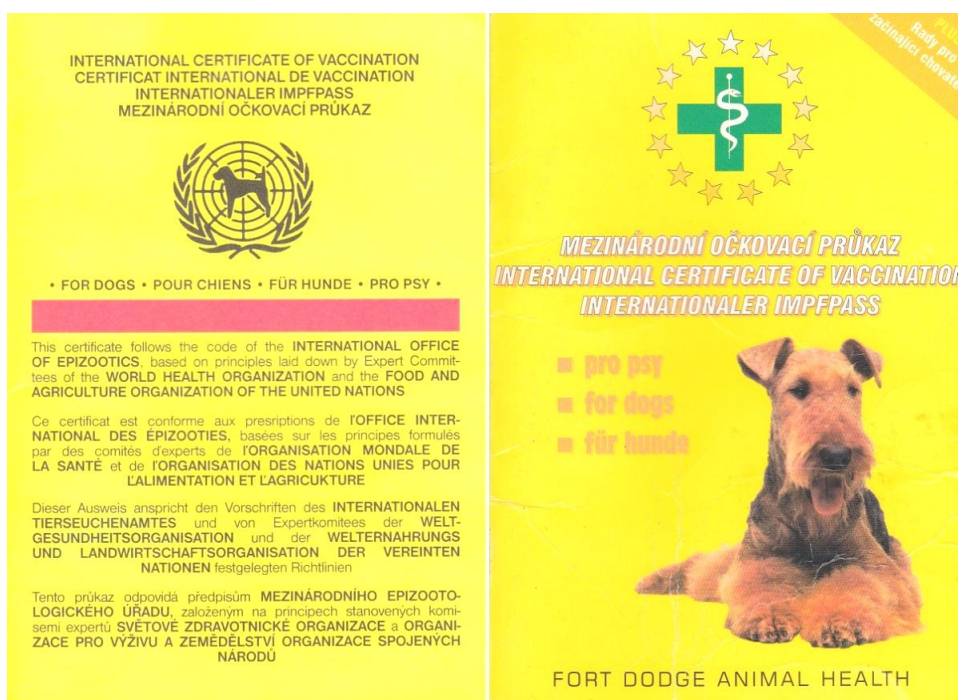
Obr. 7: Různé typy očkovacích průkazů (Michalíková Nikol, 2013)

nejefektivnější způsob prevence proti infekčním nemocem a její prospěch je daleko větší, než potenciální rizika postvakcinačních reakcí (Day, 2011).