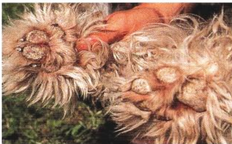
Obr. 4: Hyperkeratóza polštářků (Svoboda et al., 2001)

Léčba psinky je jen symptomatická, odvíjí se z klinického nálezu a objektivního posouzení celkového stavu. Pokud pes vykazuje nervové příznaky, šance na vyléčení je minimální (Svoboda et al., 2001).