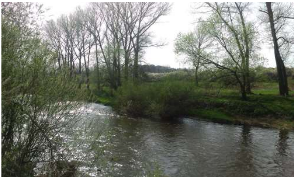
Obr. 15 – vzhled porostu v úseku č. 6 (Salix, Populus)