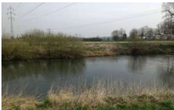
Obr. 16 – vzhled porostu v úseku č. 7 (3 roky po vykácení)