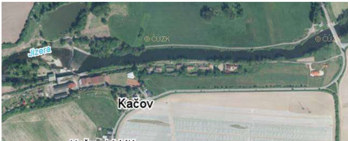
Obr. 3 – ortofotomapa úseku č. 1 ( http://www.cuzk.cz )