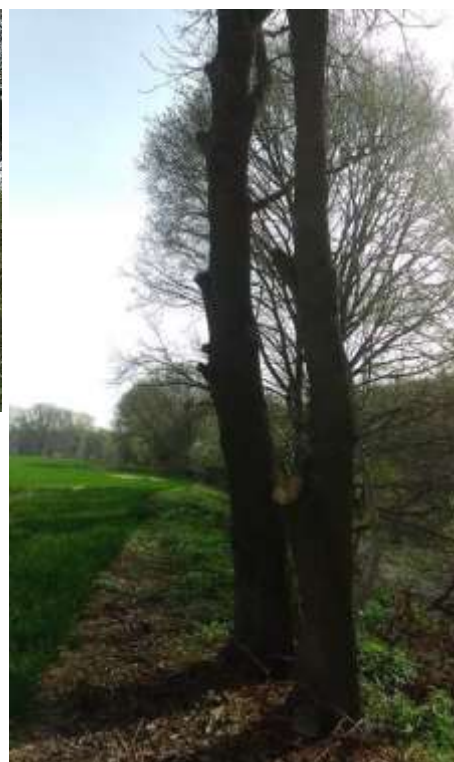
Obr. 14 – ořezané stromy, jejichž větve zasahovaly do pole