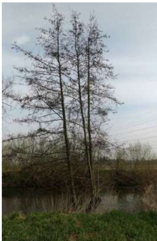
Obr. 18 – soliterně rostoucí Alnus glutinosa