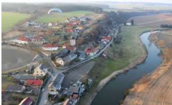
Obr. 17 – letecký snímek z roku 2012