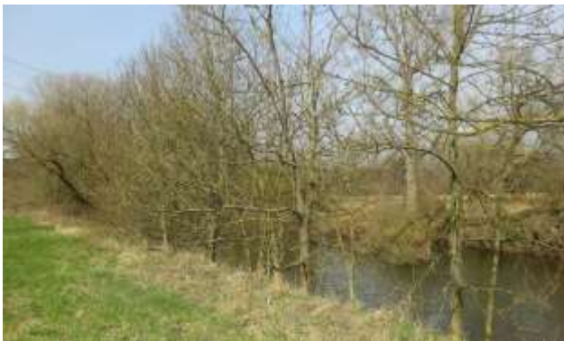
Obr. 8 – liniový porost Fraxinus excelsior