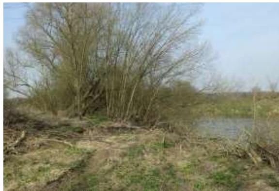
Obr. 7 – skupina dřevin na pravé straně, místo bez vegetace na levé straně