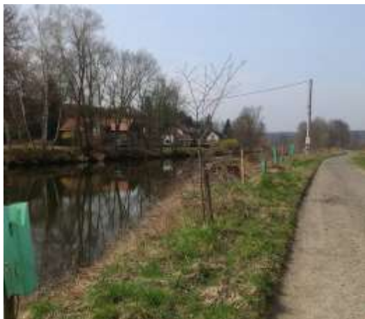
Obr. 1 – liniový porost Carpinus betulus , Quercus robur