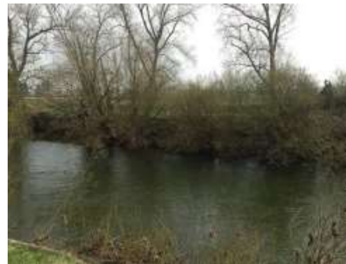
Obr. 9 – vrbový porost v jižní části úseku