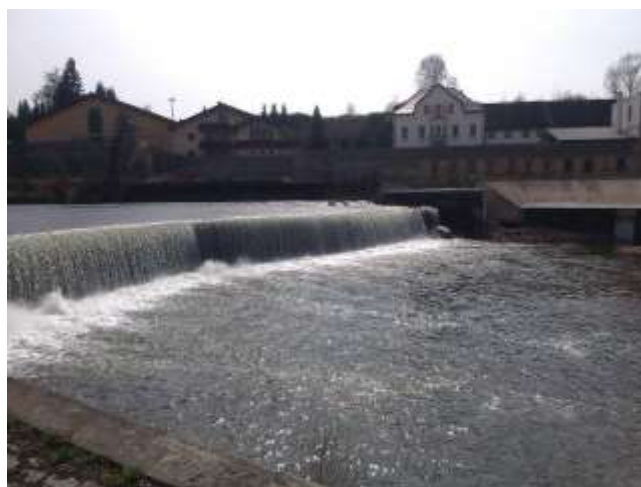
Obr. 4 – jez v obci Kačov (konec úseku č. 1)