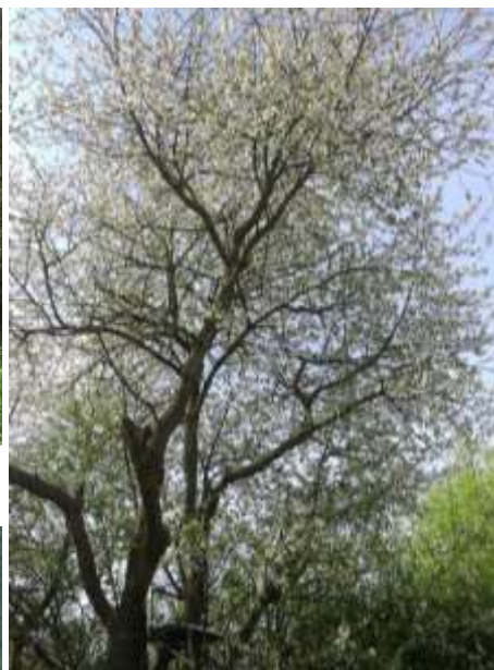
Obr. 12 – ořezané stromu Prunus avium , jejichž větve zasahovaly do pole