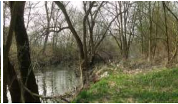
Obr. 6 – odpadky po povodních, stromy vrostlé do profilu koryta