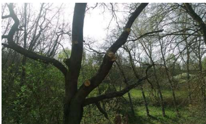
Obr. 13 – ořezané stromy, jejichž větve zasahovaly do pole