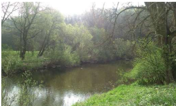
Obr. 10 – vegetační doprovod v jižní části úseku č. 4