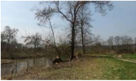
Obr. 5 – porost pod jezem (úsek č. 2)