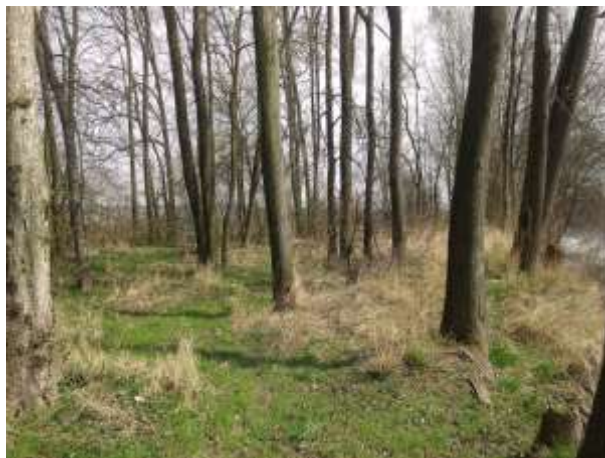
Obr. 2 – porost přecházející v lužní les