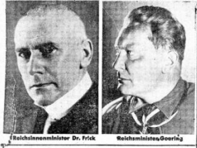
Reichsinnenminister Dr. Frick Reichsminister Goering