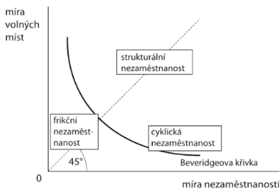
Graf č. 2 Druhy nezaměstnanosti a Beveridgeova křivka