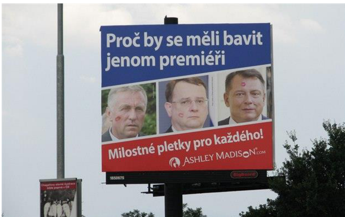
Obr. 8 Bývalí premiéři v kontroverzní reklamní kampani společnosti Ashley Madison

Jediným případem z roku 2014 je stížnost, jejíž řízení zahájila sama Rada pro reklamu. „V souladu s ustanovením článku 1, odst. 2 Jednacího řádu Rady pro reklamu (oprávnění ke stížnosti) zahájila Rada pro reklamu toto rozhodovací řízení z vlastního podnětu. Předmětná reklama společnosti Ashley Madison zobrazuje portréty tří bývalých premiérů (M. Topolánka, P. Nečase a J. Paroubka). Tyto portréty doprovázejí slogany: „Proč by se měli bavit jenom premiéři? Milostné pletky pro každého!“