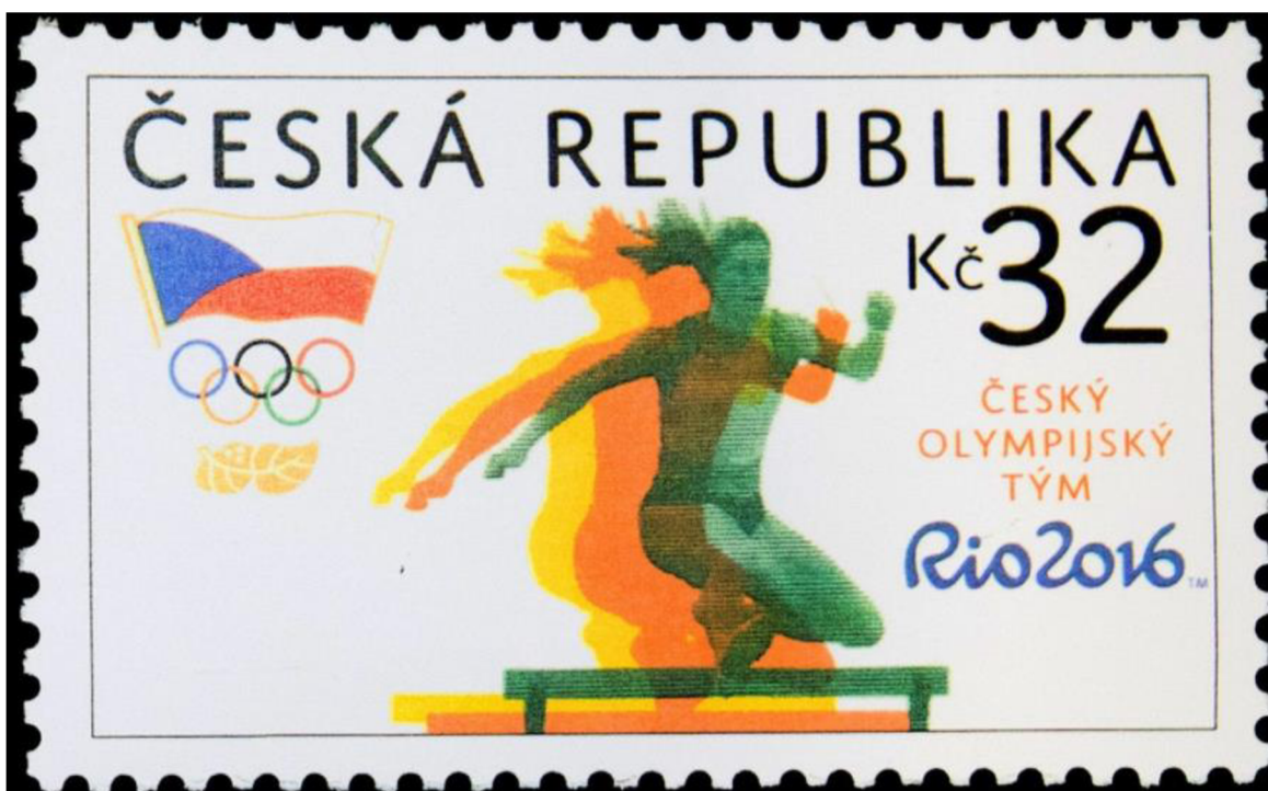
Obr. 12 Poštovní známka se Zuzanou Hejnovou

19, jelikož by se soudní spor mohl protahovat mnoho let. Důležité pro ni bylo, že pošta nakonec uznala svoji chybu (iRozhlas.cz, 2020).