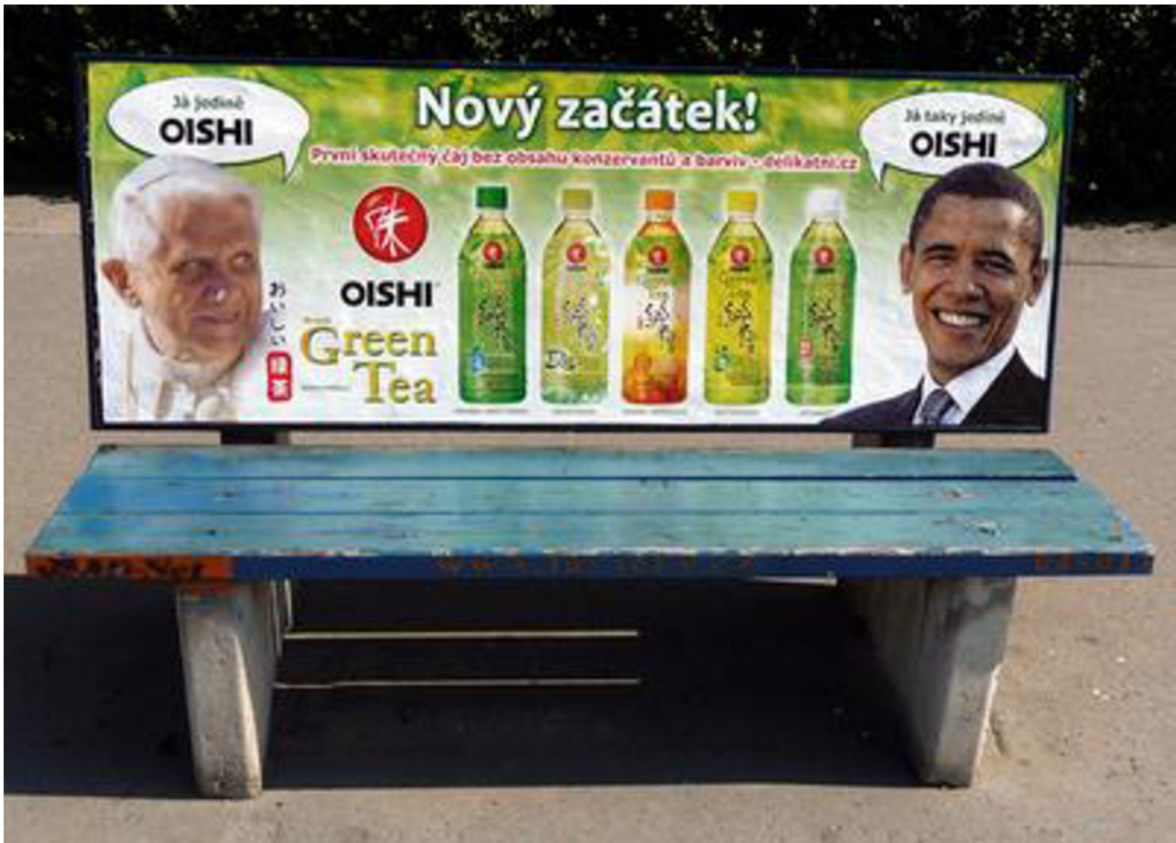
Obr. 4 Barack Obama a Benedikt XVI. v reklamě na nealkoholický nápoj