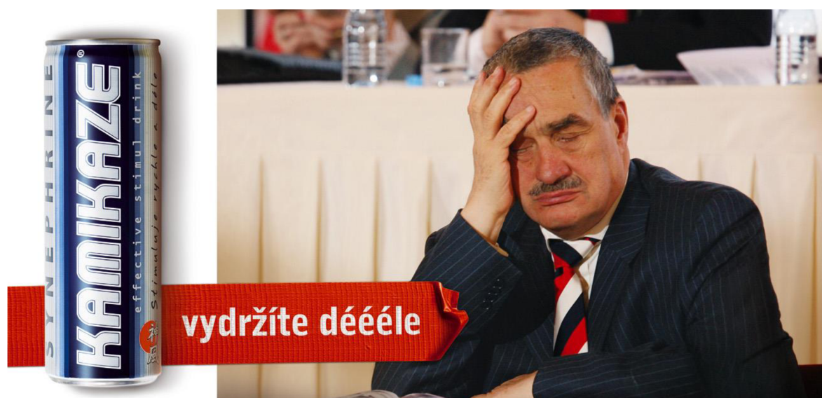
Obr. 3 Karel Schwarzenberg v reklamě na energetický nápoj

V roce 2008 Rada pro reklamu zahájila rozhodovací proces na základě vlastního monitoringu. Velkoplošná reklama propagující energetický nápoj Kamikaze zobrazovala tehdejšího ministra zahraničních věcí Karla Schwarzenbergera při schůzi parlamentu ve španělském sále Pražského hradu.