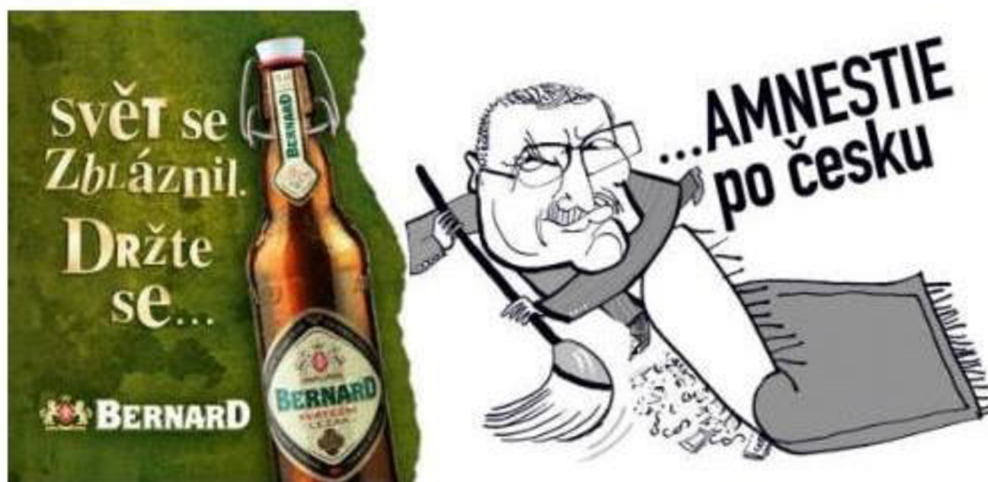
Obr. 6 Podobizna prezidenta Václava Klause v reklamní kampani na rodinný pivovar

komerční reklamu, dle názoru stěžovatele tam nemá být zobrazena podobizna prezidenta Klause, pokud se jedná o kampaň politickou, nemá tam být zobrazeno pivo Bernard.