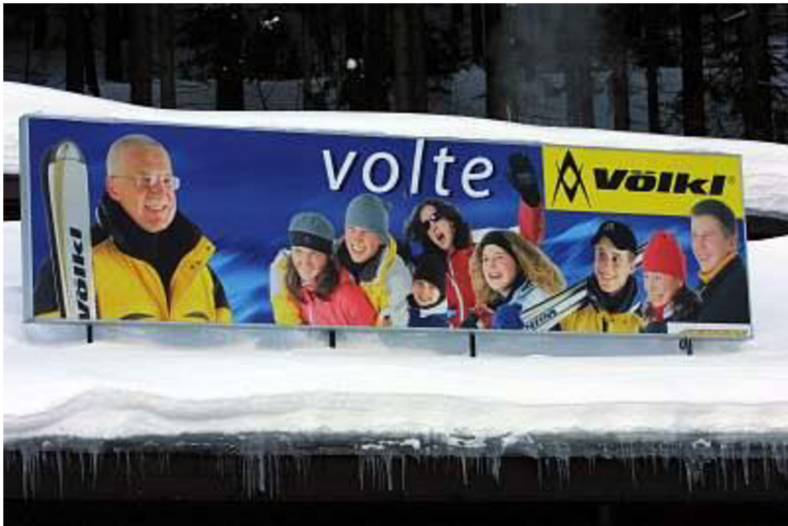
Obr. 2 Reklamní billboard s Václavem Klausem ve Špinlerově Mlýně