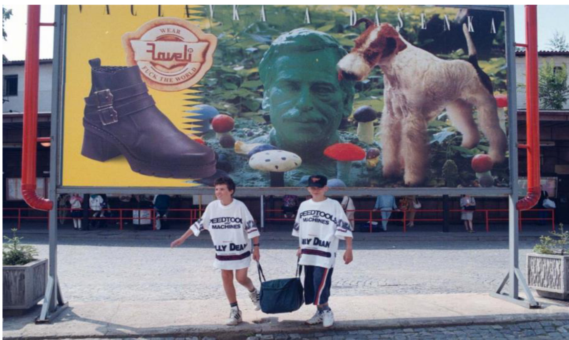
Obr. 9 Billboard s bustou Václava Havla a foxteriérem

V roce 1997 zveřejnila společnost M.A.R.S. s.r.o. ve spolupráci se společností Raveli a.s. reklamní billboardy, které měly sloužit k propagaci výrobků (bot) právě značky Raveli a.s. Na reklamním billboardu byl vyobrazen tehdejší prezident Václav Havel s foxteriérem, který byl podobný štěněti z knihy Karla Čapka. Billboard nesl text „Václavka a Dášenska“, což mohlo u veřejnosti evokovat prezidentský manželský pár. Autorem busty, sochařského portrétu, který byl pro billboard použit, je umělec a bývalý ředitel Národní galerie Milan Knížák.