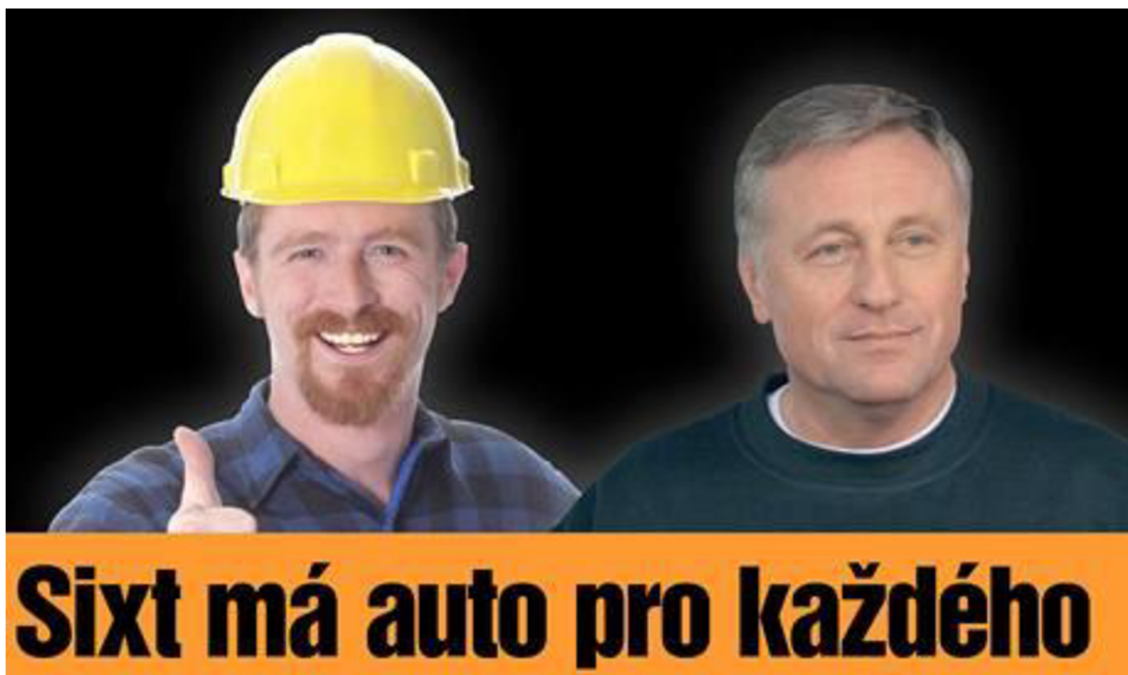
Obr. 5 Předseda ODS na reklamním billboardu autopůjčovny SIXT