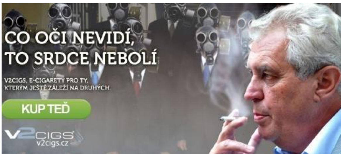
Obr. 7 Prezident Miloš Zeman v reklamě na elektronické cigarety