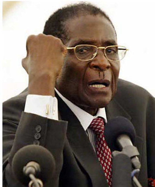
Obrázek č. 3: Robert Gabriel Mugabe (Mataberland Freedom Party, nedatováno)

Poté, co byl 4. března 1980, tedy šest týdnů před osamostatněním země, zvolen prvním ministerským předsedou Robert Mugabe, svět se začal obávat možného propuknutí násilí. V prvních letech po svém