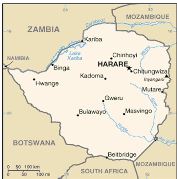
Obrázek č. 2: Zimbabwe (CIA, 2011)

Ruwa, jeho populace narůstá podle některých odhadů až ke 2,5 mil. obyvatel 50 . V celém Zimbabwe pak žije přibližně 12,1 mil. obyvatel (odhad 2011, 51 ), většina ve zhruba 100km pásu kolem hlavního města a na spojnici Harare s druhým největším městem – Bulawayem, případně na komunikacích z Harare do okolních zemí. Velké části země, zejména na severozápadu, jsou obydlené jen velice řídko. 52