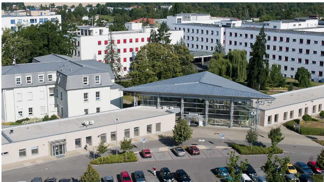
Obrázek č. 1 Nemocnice České Budějovice, a.s.