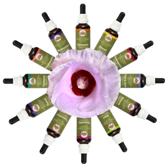
Obrázek 2 Kombinace květových esencí