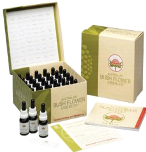
Obrázek 1 Sada koncentrátů esencí