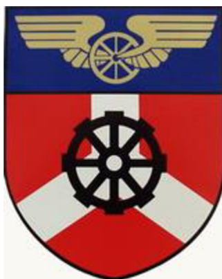
Obrázek 9 Znak Bohumína