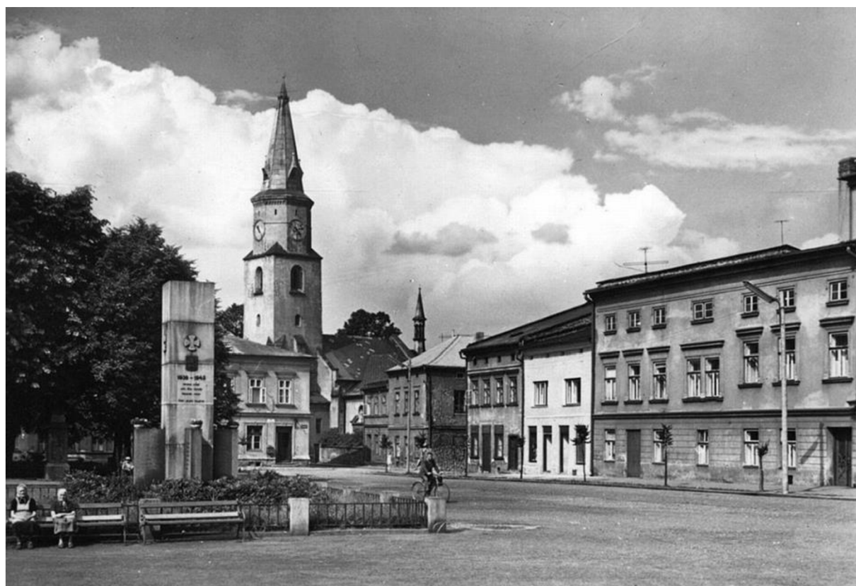
Obrázek 2 Kostel sv. Panny Marie