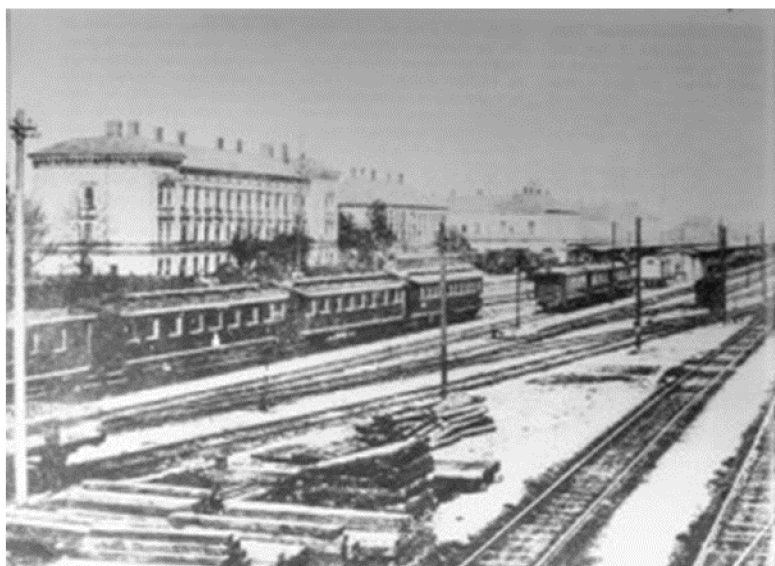
Obrázek 1 Vznik železnice