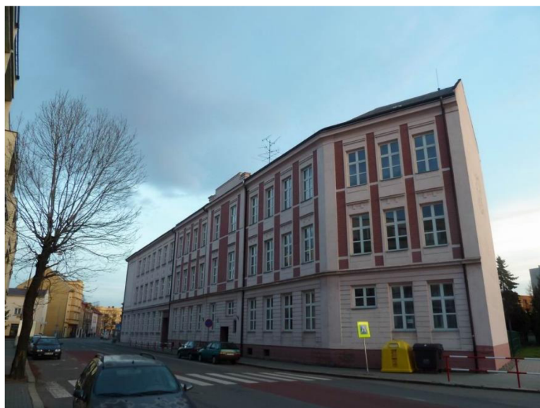
Obrázek 8 Základní škola a mateřská škola tř. Dr. E. Beneše