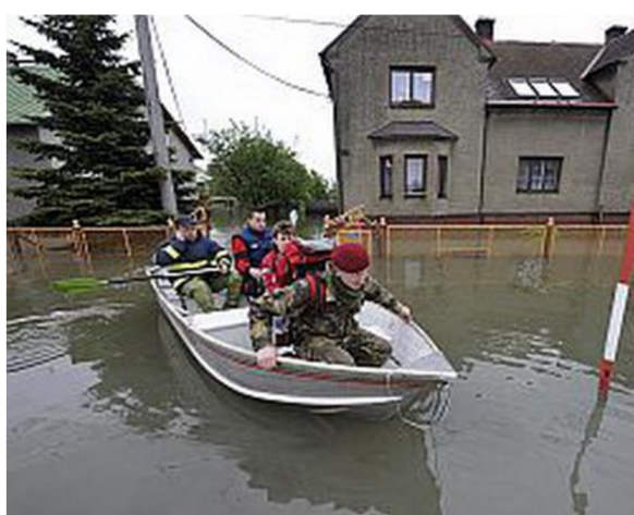
Obrázek 10 Pomocné síly při povodních na loďce