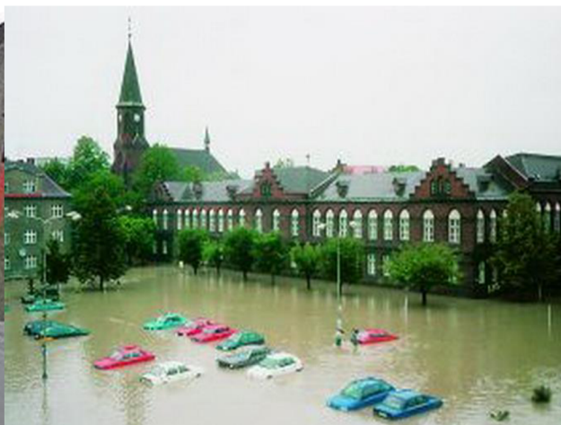
Obrázek 11 Zaplavené město Bohumín