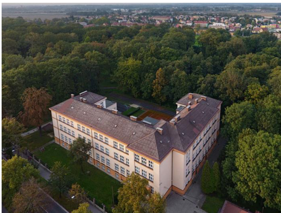
Obrázek 6 Foto z drona Gymnázium současnost