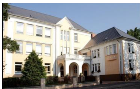
Obrázek 7 Masarykova základní škola a Mateřská škola Bohumín