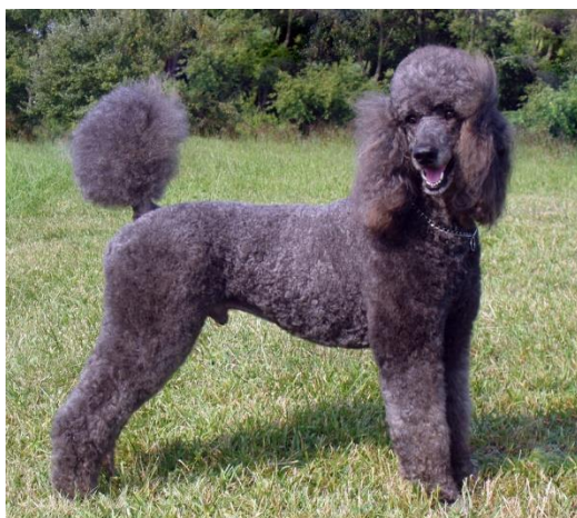
Obrázek 14 Pudl – kudrnatá srst

Tabulka 11 Genotypový a fenotypový projev lokusu K (kinky) (Keegan 2016)