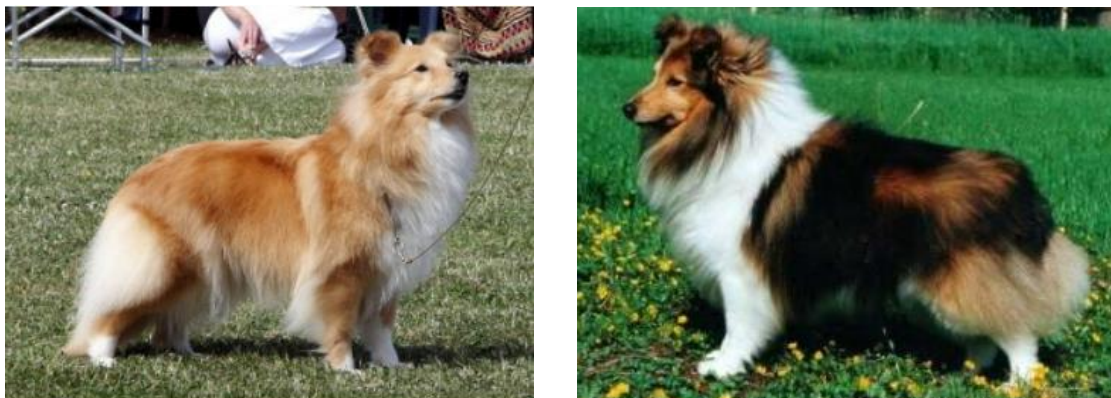
Obrázek 17 Sable zbarvení ( http://sheltie.4fan.cz/o-sheltiich/53-2/ )

přenašeči jiného zbarvení, ale vzhledově budou vypadat všechny sable stejně (Keegan 2016). Sabel zbarvení je dominantní nad trikolorou a bikolorou (Hollander 2018).