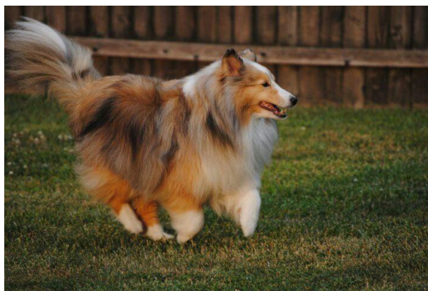
Obrázek 21 Zbarvení sable merle ( https://cz.pinterest.com/search/pins/?rs=ac&len=2&q=sable%20merle%20sheltie&eq=sable%20merle%20she&etslf=5053 )