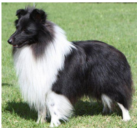
Obrázek 18 Bicolor zbarvení ( http://sheltie.4fan.cz/o-sheltiich/53-2/ )

Česky se toto zbarvení nazývá černobílé (Obrázek 18). Jedinec je černý, vždy bez pálení a objevuje se „irský vzor“ (Svobodová 2007).