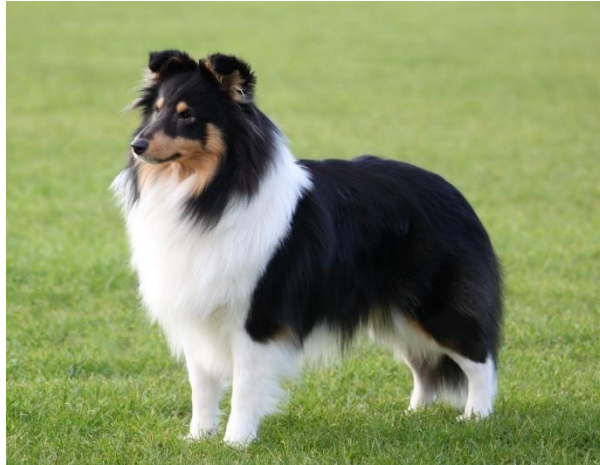
Obrázek 19 Zbarvení tricolor ( http://sheltie.4fan.cz/o-sheltiach/53-2/ )