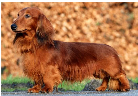
Obrázek 12 Jezevčík ( http://www.ckc.ca/Choosing-a-Dog/PuppyList/Breed.aspx?breedCode=DML )