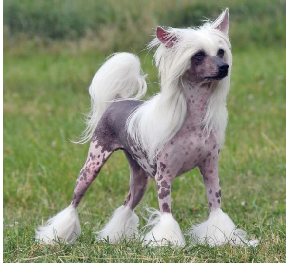
Obrázek 16 Čínský chocholatý pes – nahost ( https://www.ifauna.cz/psi/atlas/cinsky-chocholaty-pes )