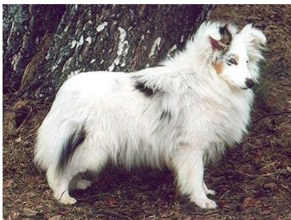
Obrázek 22 Zbarvení double merle

Double merle pes (Obrázek 22) se objevuje při spojení dvou merle jedinců a to s pravděpodobností 25 %. Double merle pes má převážně bílou barvu s náznaky merlování a často modré oči. Zbarvení s sebou nese častá zdravotní rizika (Trhlíková 2015).