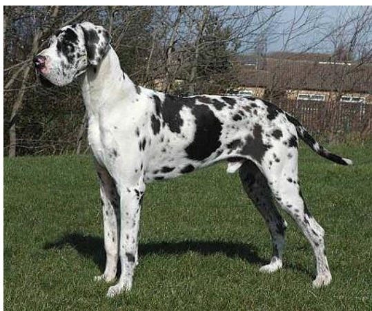
Obrázek 10 Německá doga ( https://animal-groups-roleplay.fandom.com/wiki/Animal_Groups_Roleplay_Wiki?file=Tyde.jpg )

Studované dogy měli alespoň jednu kopii merle mutace, což potvrdili Clark et al. (2006) v jejich studii.