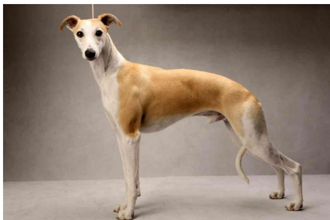
Obrázek 5 Zbarvení bez masky