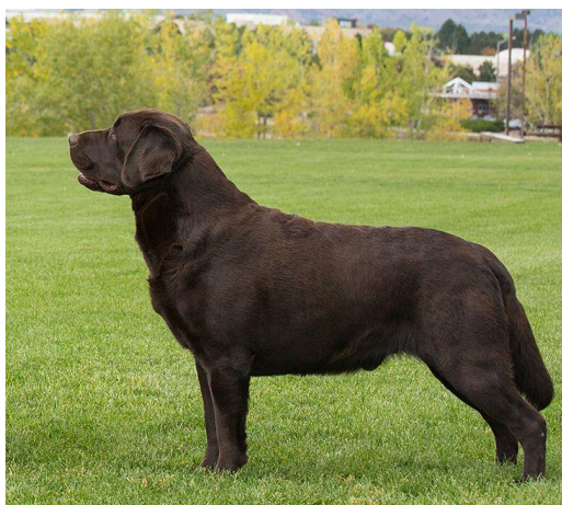
Obrázek 6 Zbarvení způsobené TYRP 1 (hnědé)