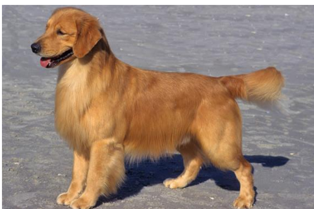
Obrázek 3 Zbarvení srsti zlatá ( https://www.101dogbreeds.com/golden-retriever.asp )