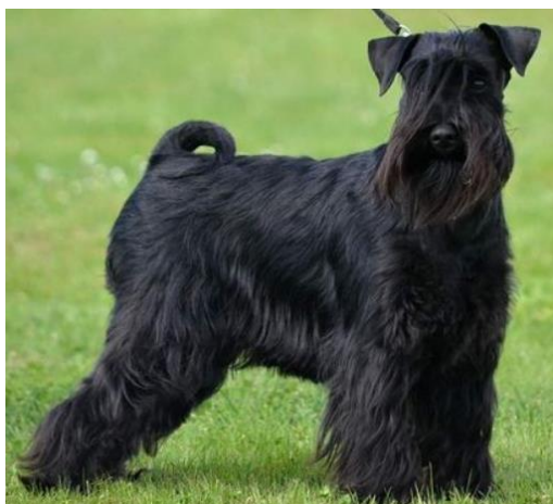
Obrázek 13 Knírač – vlněná srst

KRT71 je mapován do oblasti CFA27 (27. chromozom canis familiaris – psa domácího). Je spojen s kudrnatou srstí, ale tato varianta genu se nevyskytuje u všech kudrnatých psů jako je například curly coated retrívr (Parker et al. 2010). U psů se vyskytují dvě varianty, které jsou spojovány s kudrnatou a vlnitou srstí (Bauer et al. 2019). Pro vlnitou srst (Obrázek 13) lokus Wa (wavy) a pro kudrnatou srst (Obrázek 14) je to lokus K (kinky) a (viz Tabulka 11, 12).