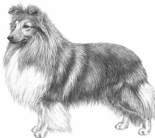
Obrázek 1: Představitel plemene šeltie ( http://www.fci.be/Nomenclature/Illustrations/088g01.jpg )

Šeltie se ve standardu uznává ve zbarveních sable, trikolor, blue-merle, černo-bílá a černo-tříšlová. Vlčí a šedé zbarvení je nežádoucí. Mezi vylučující vady patří agresivita a přehnaná plachost. Jakákoliv odchylka od předepsaného standardu je považována za vadu, která se posuzuje v přímém poměru k jejímu stupni a účinku na zdraví a prospěch psa (ČMKU 2013).