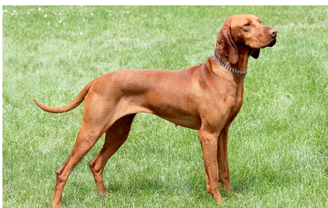
Obrázek 4 Zbarvení srsti červené ( https://psiusmev.cz/plemena/madarsky-ohar-vizsla )