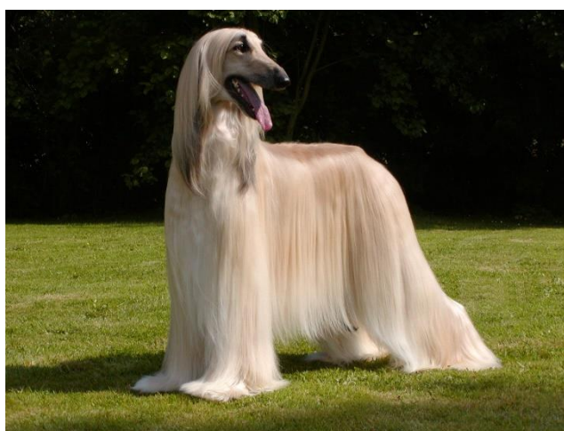
Obrázek 15 Afgánský chrt – dlouhá srst

Geny SGK3 a FOX13 jsou spojeny s plemeny s nedostatkem srsti nebo úplně bez srsti. Bezsrstost řídí lokus Hr (hairless) (viz Tabulka 14). FOX13 je mapován do oblasti CFA17 (17. chromozom canis familiaris – psa domácího) a je studován ve spojení s čínským chocholatým psem (Obrázek 16), peruánským psem a mexickým psem (Drögemüller et al. 2008). SGK3 je studován ve spojení s americkým bezsrstým teriérem a skotským deerhoundem (Parker et al. 2017). Mutace těchto genů může vést k abnormálnímu zubnímu vzorci a chybějícím zubům nebo jsou jejich působením drápy křehčí. Bezsrstost se dědí jako autozomálně dominantní rys a tento fenotyp se u psů objeví pouze tehdy, když nesou pouze jednu mutantní alelu (Hr). Psi nesoucí dvě mutantní alely (HrHr), tj. od obou rodičů, umírají v prenatálním stádiu (Drögemüller et al. 2008).