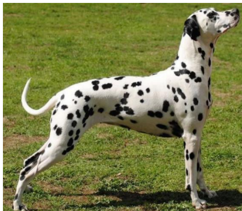
Obrázek 11 Dalmatin