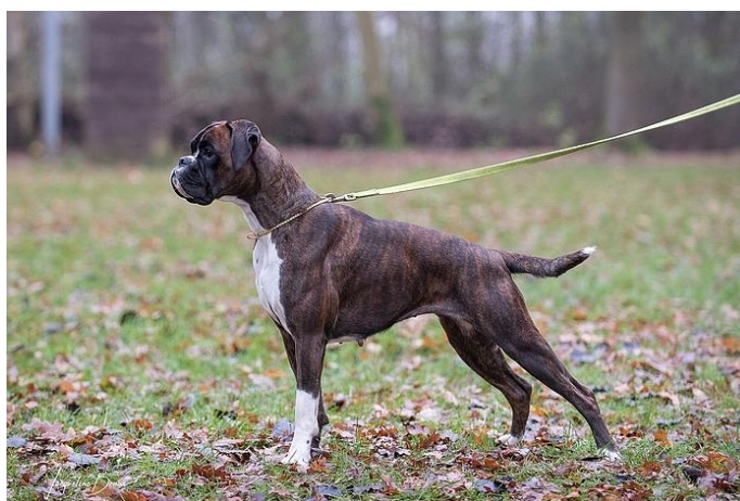
Obrázek 7 Žíhané zbarvení ( https://www.suderein-boxers.nl/ )