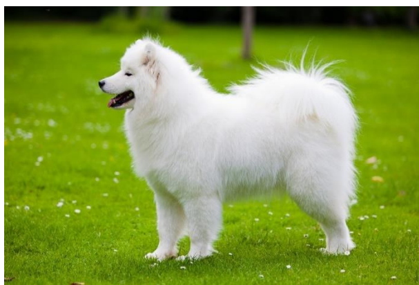
Obrázek 9 Samojed ( https://www.dogfocus.co.uk/breed-notes/pastoral-group/samoyed/ )

Pigmentace labradorského a zlatého retrívra je způsobena pheomelaninem a jejich genotyp je ee na MC1R. Mají barvu v odstínu od zlatožluté po krémovou, ale nejsou bílí (Schmutz & Berryere 2007). První gen, o kterém se uvádí, že ředí pouze pheomelanin, je SLC7A11 (solute carrier family 7 member 11) (Chintala et al. 2005). Některá plemena, jako jsou afghánští chrti a pudlové, mají zástupce s alelou E nebo E M na MC1R (Schmutz & Berryere 2007).