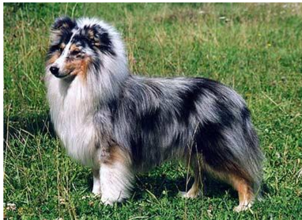
Obrázek 20 Zbarvení blue merle ( http://sheltie.4fan.cz/o-sheltiach/53-2/ )

Blue merle zbarvení je také označováno jako grošované zbarvení, popřípadě modré (Obrázek 20). Do tricolorního zbarvení se přidá M alela a vzniká blue merle. Vzniká naředěním černého základu. Vyznačuje se různě velkými černými plochami na šedém podkladu, bílými znaky a pálením. Blue merle jedinci mohou mít jedno nebo obě oči modré (Trhlíková 2015).