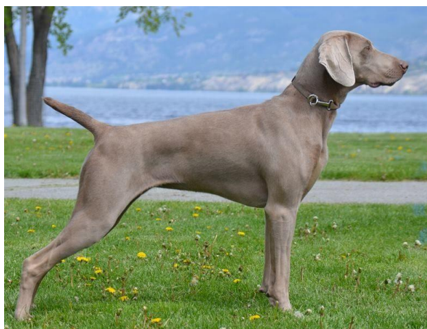
Obrázek 8 Výmaršský ohař