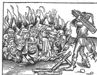
Upalování Židů, dřevoryt se Schedelovy Kroniky světa (Norimberk, 1493)