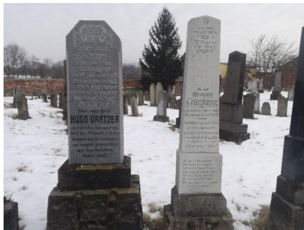
Obr. 4: Náhrobky na židovském hřbitově v Holešově