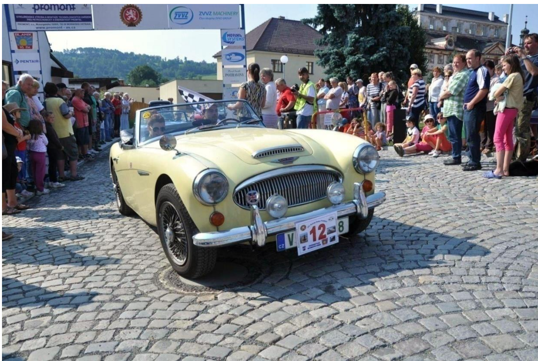
Obrázek 11 - Automobilová veterán rallye