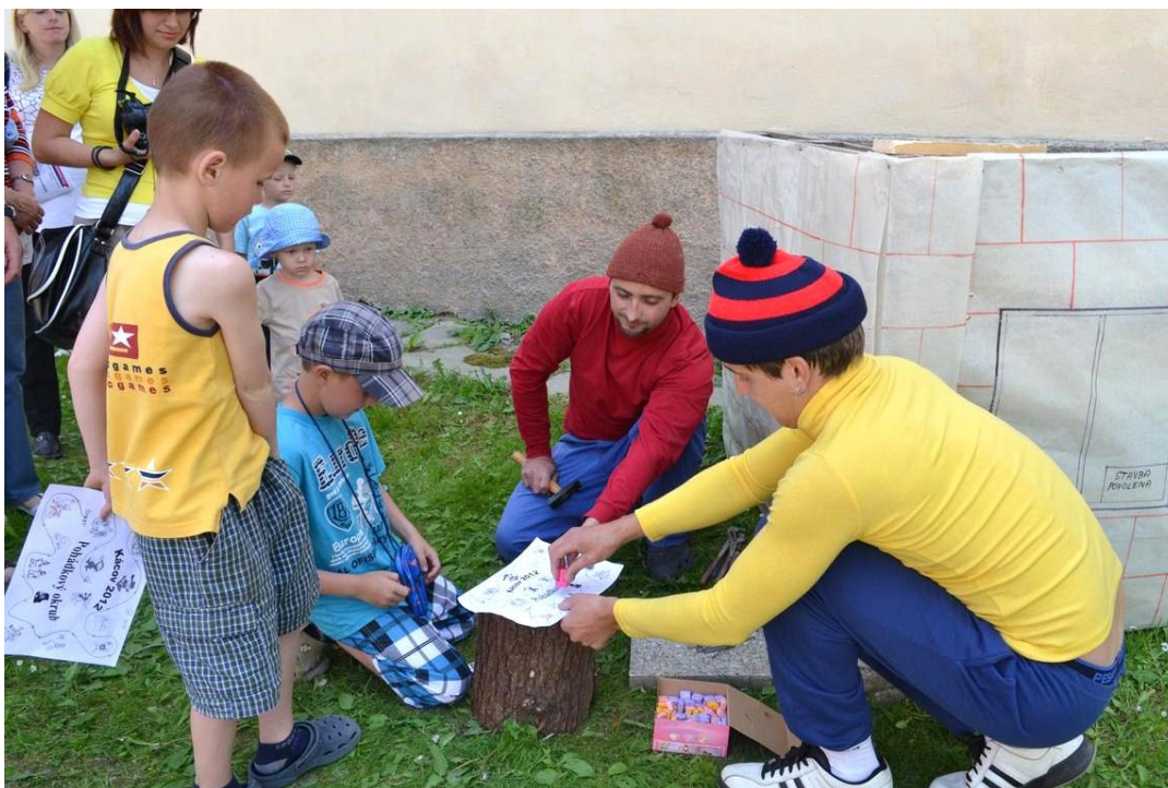
Obrázek 7 - Pohádkový okruh okolo Kácova