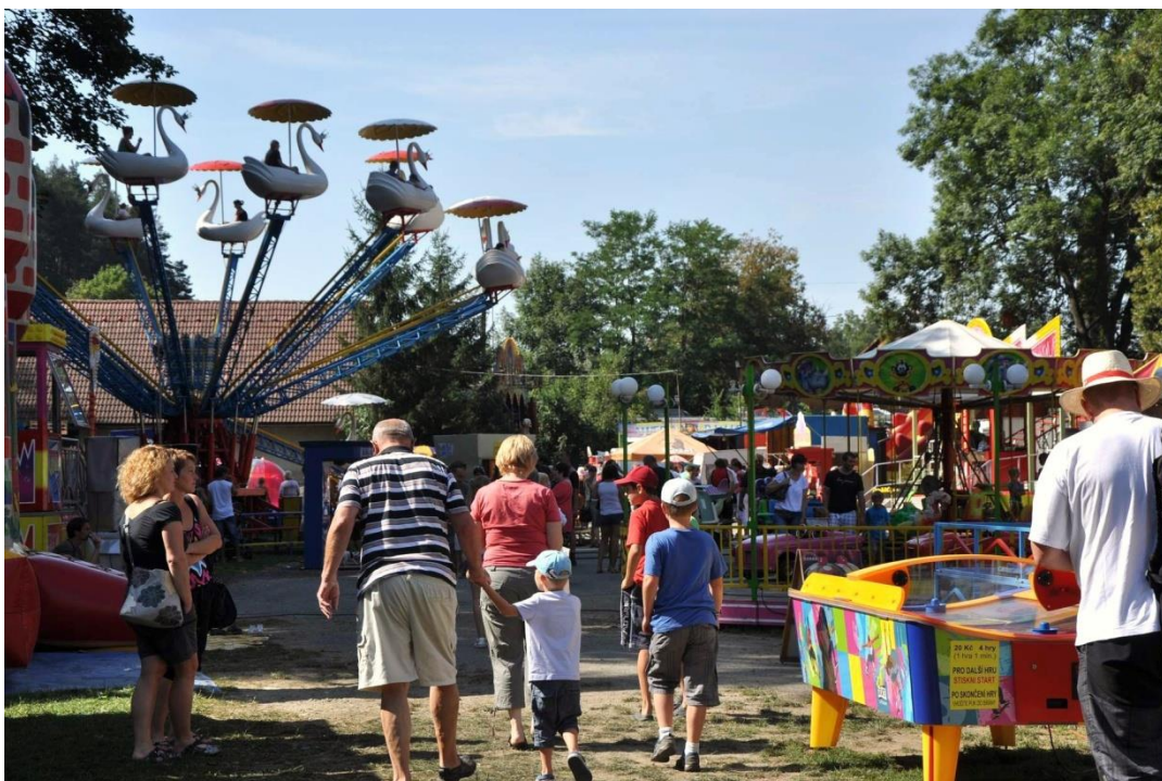
Obrázek 9 - Kácovská pout' 2013