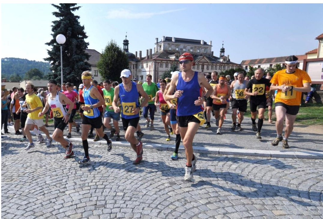
Obrázek 10 - Kácovský běh – hlavní závod