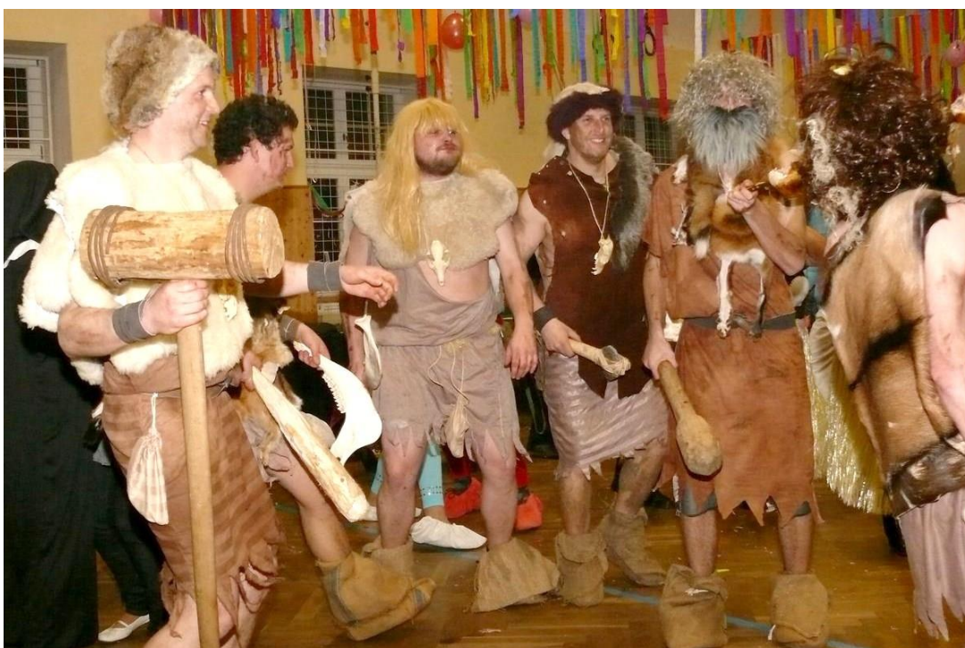
Obrázek 4 - Sokolské šibřinky