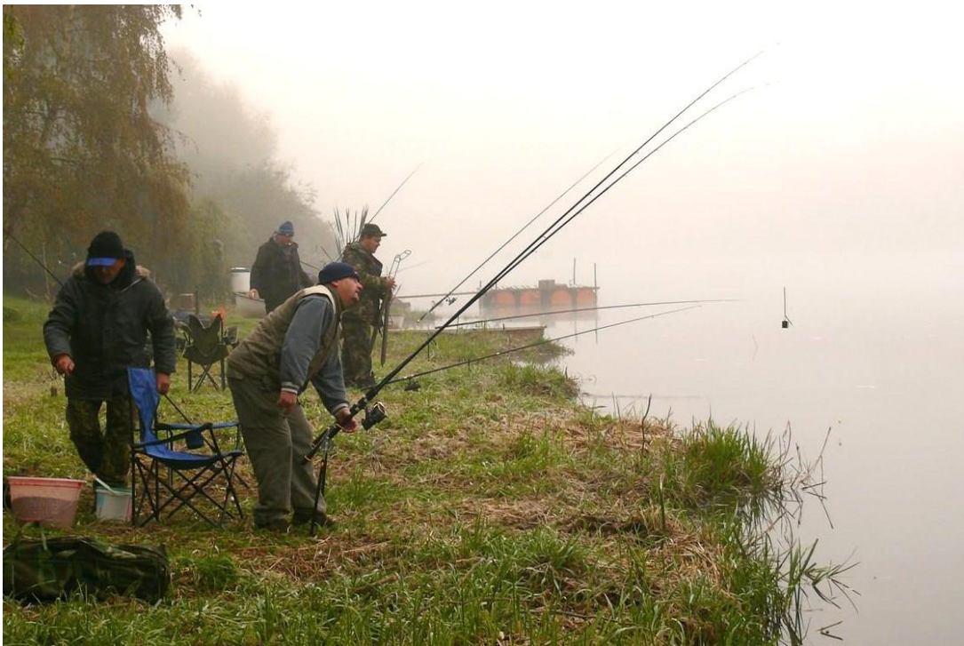
Obrázek 6 - Noční rybářské závody