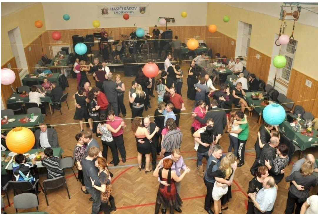
Obrázek 3 - Hasičský ples