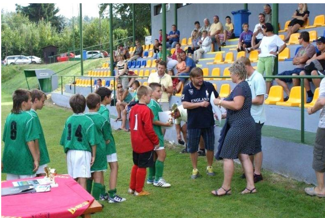
Obrázek 12 - Turnaj minižáků o Posázavský pohár