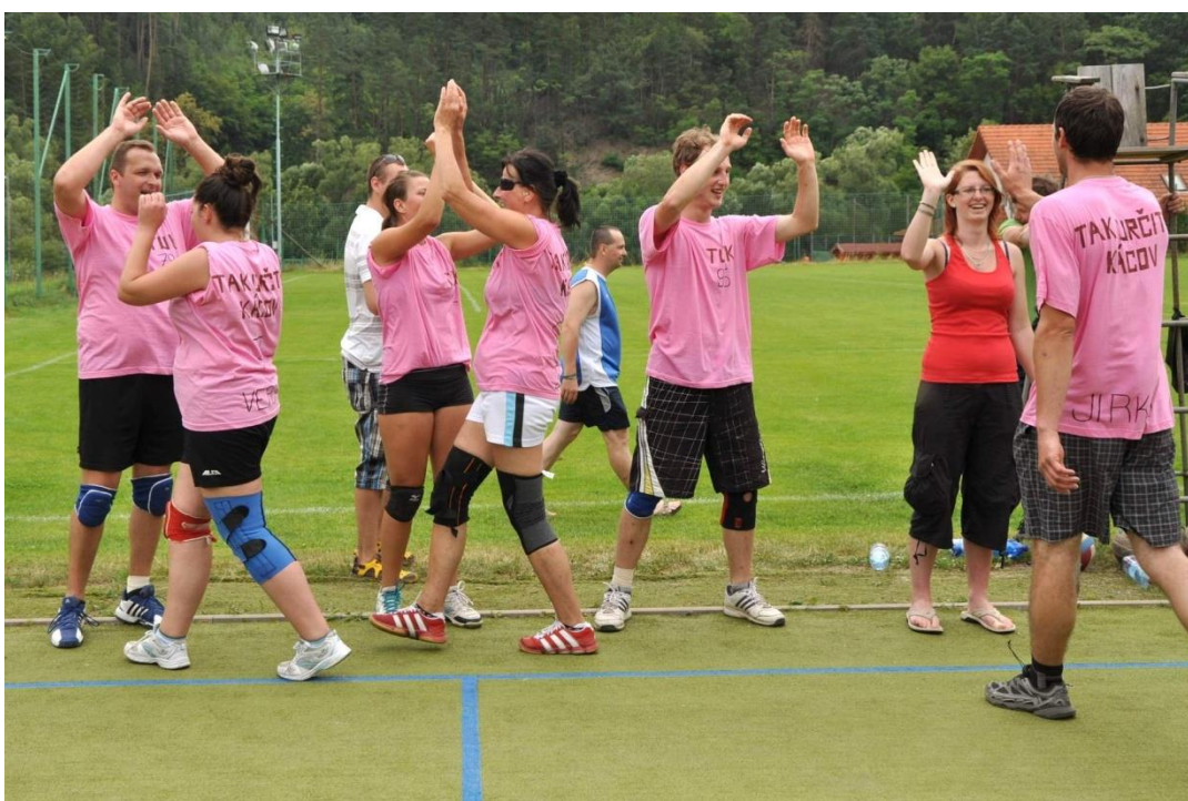
Obrázek 8 - Volejbalový turnaj Splašený Kácov 2013