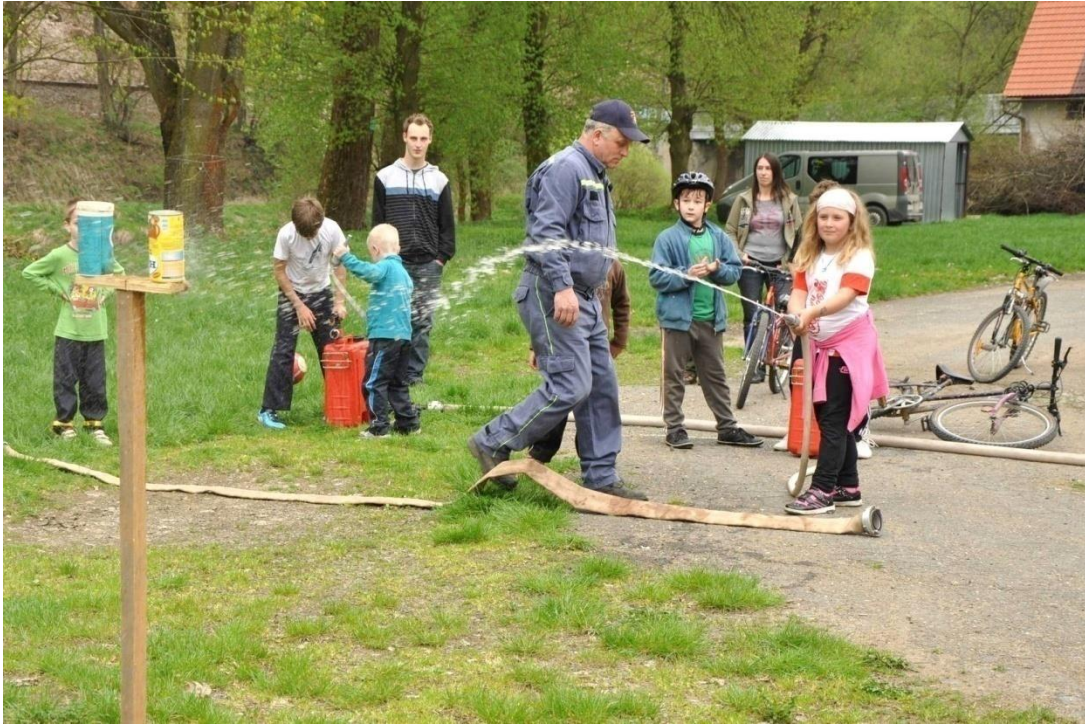
Obrázek 5 - Pálení čarodějnic v kempu a zábavné odpoledne pro děti