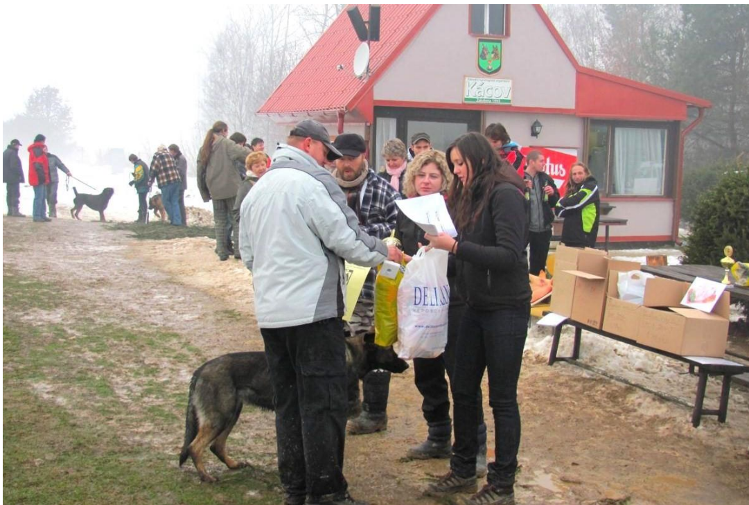
Obrázek 1 - Zimní závod