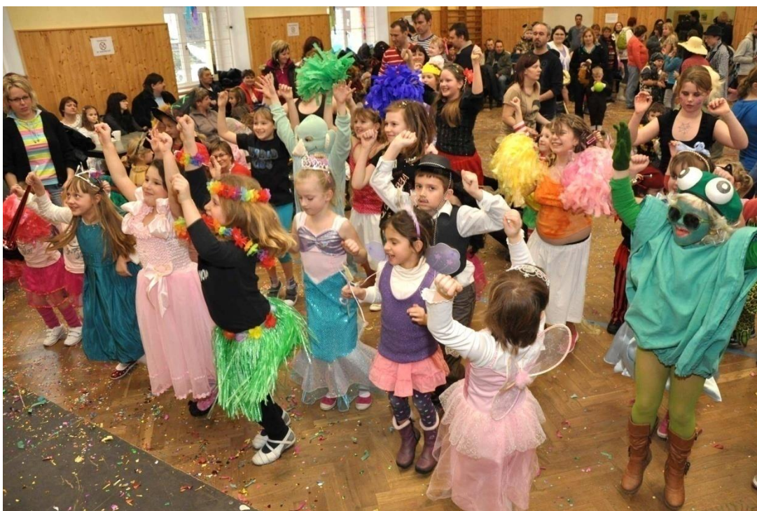
Obrázek 2 - Dětský maškarní karneval