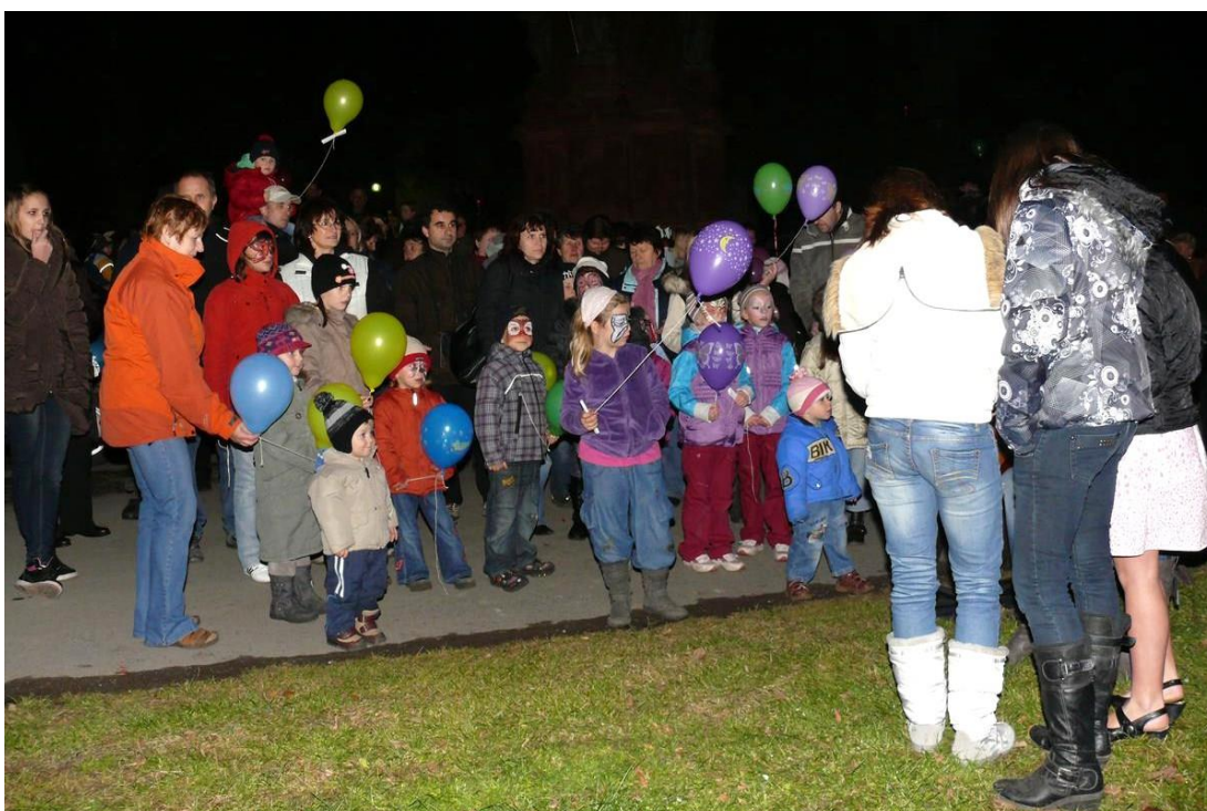
Obrázek 16 - Mikulášská nadílka a rozsvícení vánočního stromu na náměstí