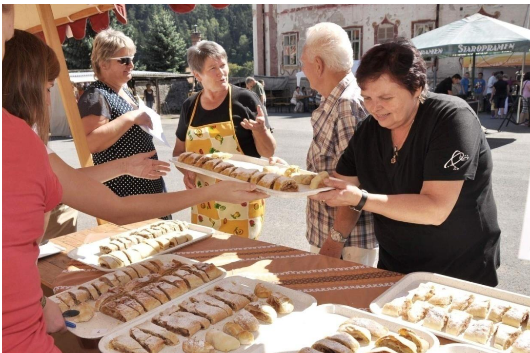
Obrázek 13 - Kácovský posvícenský jarmark - soutěž o nejlepší štrúdl