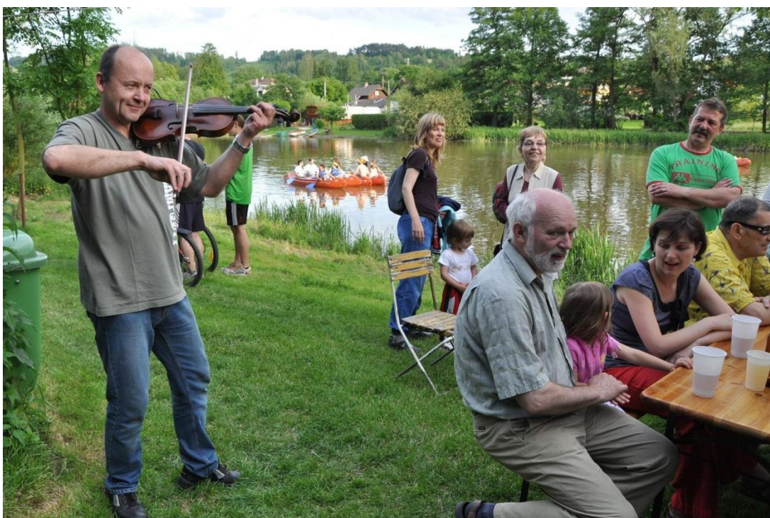
Obrázek 14 - Tančírna u řeky