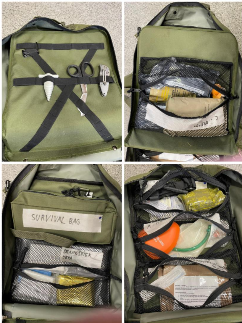
Obrázek 1 – batoh využívaný vojenskými mediky