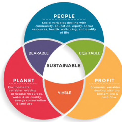
Obrázek 3: Vztah 3P a trvalé udržitelnosti