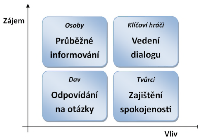
Obrázek 2: Matice stakeholderů