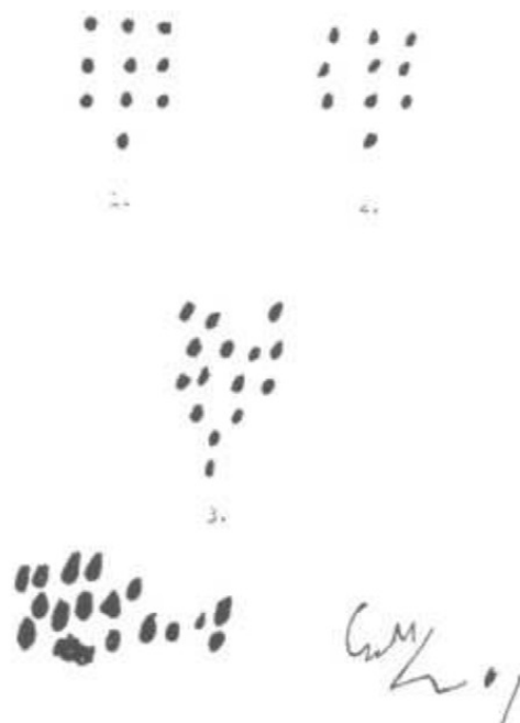
Obrázek 3 Obkreslení skupiny teček (Orientační grafický test školní připravenosti, on-line)

K vyhodnocení Jiráskova testu školní připravenosti slouží pětibodová škála, kdy za nejlepší výkon získá testované dítě 1 bod, za nejhorší výkon pak 5 bodů. Za kompletní test, který se skládá z výše uvedených subtestů, může dítě získat 3 až 15 bodů. Podle dosaženého skóru je zjištěna úroveň školní zralosti dítěte. Tato úroveň se dle skóru pohybuje v rozmezí uvedeném v následující tabulce.