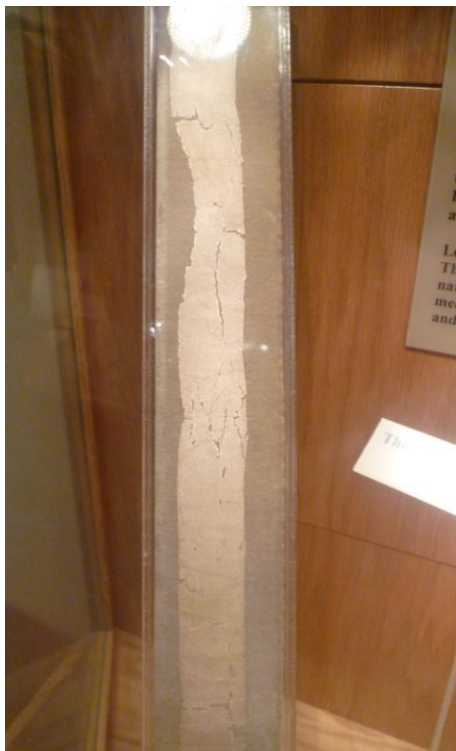
Obr. 2 Stuha z roku 1805 od Lewise a Clarka