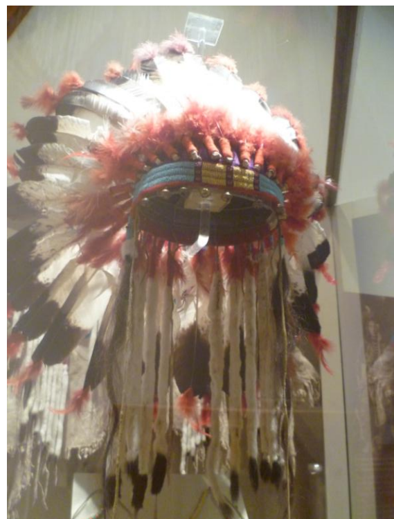
Obr. 3 Čelenka Nez Perce