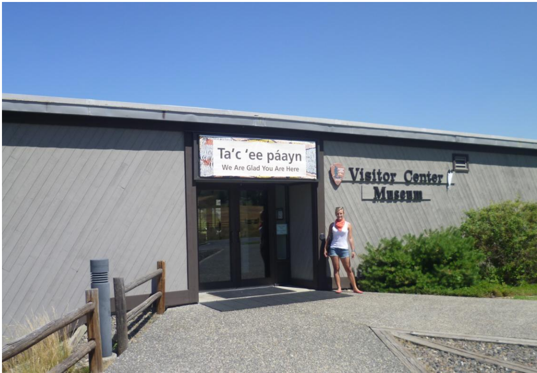
Obr. 1 Muzeum Nez Perce