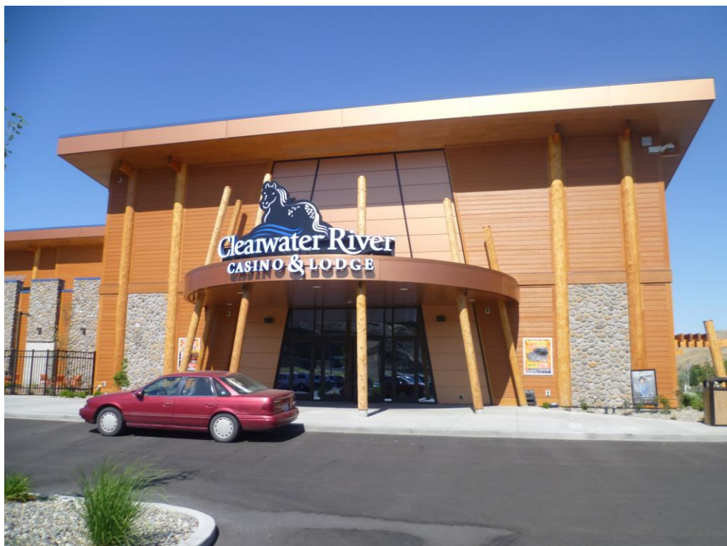
Obr. 5 Casino Clearwater provozované Nez Perce