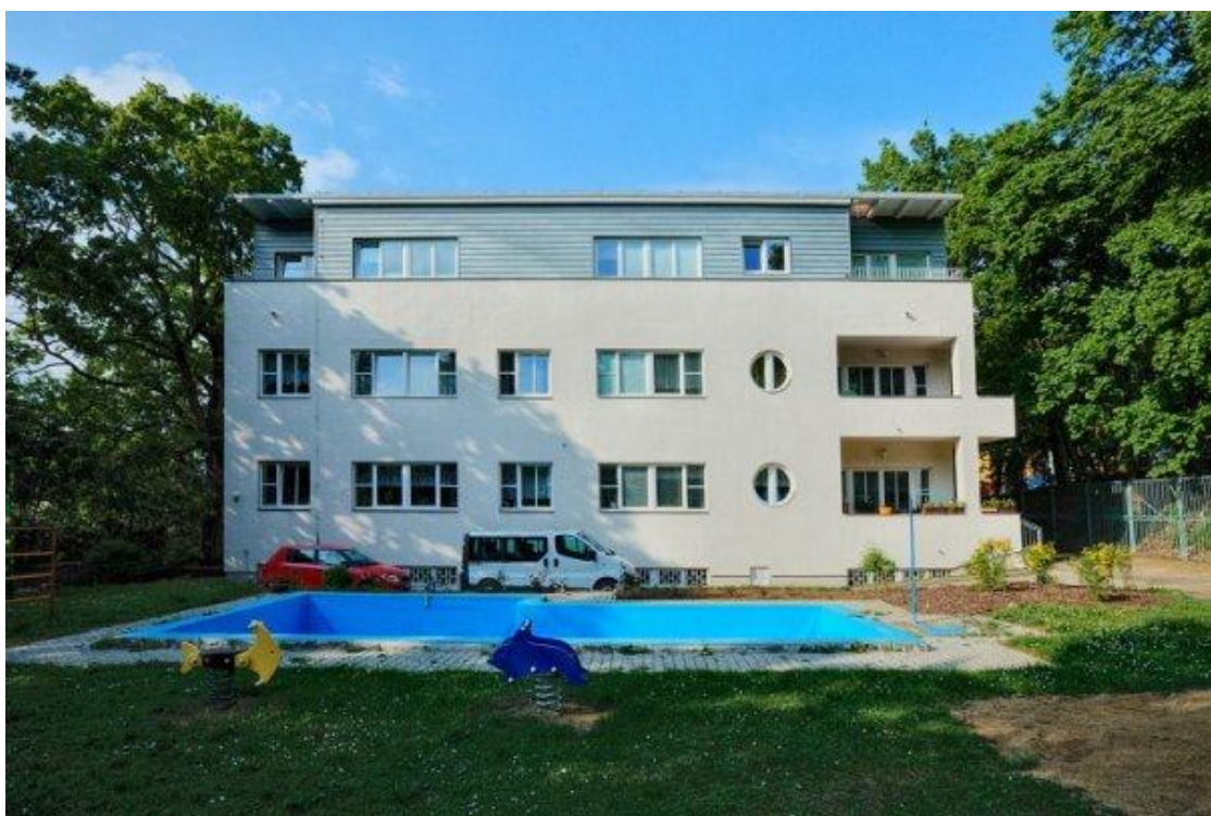
Obrázek č.2

Příspěvková organizace Dětský domov Dagmar zajišťuje nezletilým osobám ve věku od 3 do 18 let, případně zletilé osobě do 19 let, na základě rozhodnutí soudu o ústavní výchově nebo ochranné výchově nebo o předběžném opatření náhradní výchovnou péči. V zájmu jeho zdravého vývoje, řádné výchovy a vzdělávání, předchází dětský domov vzniku a rozvoji negativních projevů chování dítěte nebo narušení jeho zdravého vývoje, zmírňuje nebo odstraňuje příčiny nebo důsledky již vzniklých poruch chování a přispívá ke zdravému osobnostnímu vývoji dítěte. 8