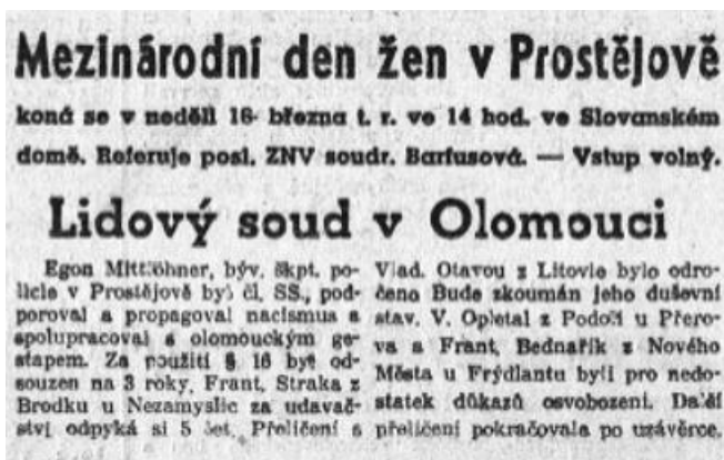
Příloha č. 4: Kolonka Stráže lidu informující o Mittlöhnerově odsouzení.