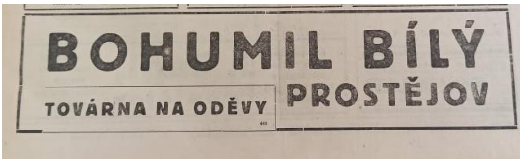
Příloha č. 2: Reklama na továrnu Bílý z Hlasů z Hané z 1. ledna 1944.