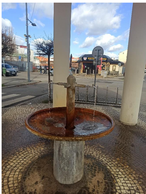
Obr. 11. Pítko na Riegerově náměstí stejnojmenného pramene.