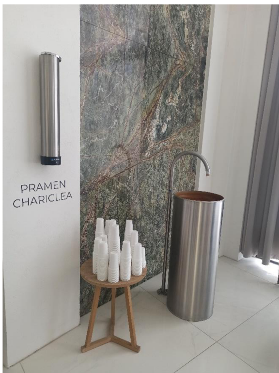
Obr. 7. Pítko pramene Chariclea v letních lázních.