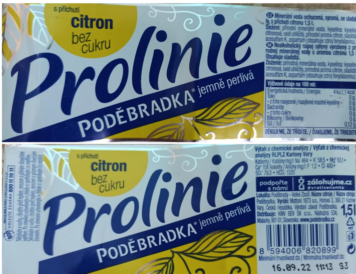
Obr. 24 a 25. Obě strany etikety u Prolinie Poděbradky s příchutí citronu (Autor Kateřina Suchardová).

Poděbradku si lze nakoupit v mnoha různých příchutích. Základní rozdělení těchto příchutí je Poděbradka přírodní, ochucená jemně perlivá, Prolinie jemně perlivá a poctivé limonády. Poděbradka přírodní se jinak dále nedochucuje a nalezneme jí ve formě jemně perlivé. Jemně perlivou vodu můžeme v obchodech koupit kromě citronové a pomerančové příchuti také s oblíbenou příchutí citrus mix a příchutí malina. Lze se také setkat s příchutí jablečný mošt, zahradní mix a s příchutí lesních plodů. Prolinii jemně perlivou si lidé kupují převážně pro složení bez cukru. Mezi typické příchutě Prolinie je řazena příchutí citron, pomeranč, limetka a malina. Dalšími dochucovadly Prolinie jsou lesní plody, brusinky a bezinky. Poctivá limonáda od společnosti Poděbradka se prodává v obchodech v provedení dvoulitrových lahví, či čepovaná varianta ze sudů v různých pohostinstvích. V obchodech lze zakoupit malinovku či vínovou poctivou limonádu. S čepovanou verzí se můžeme setkat nejen u předchozích dvou variant, ale také u chmelové, citronové, bezinkové či kolové příchutě limonád (Poděbradka.cz).