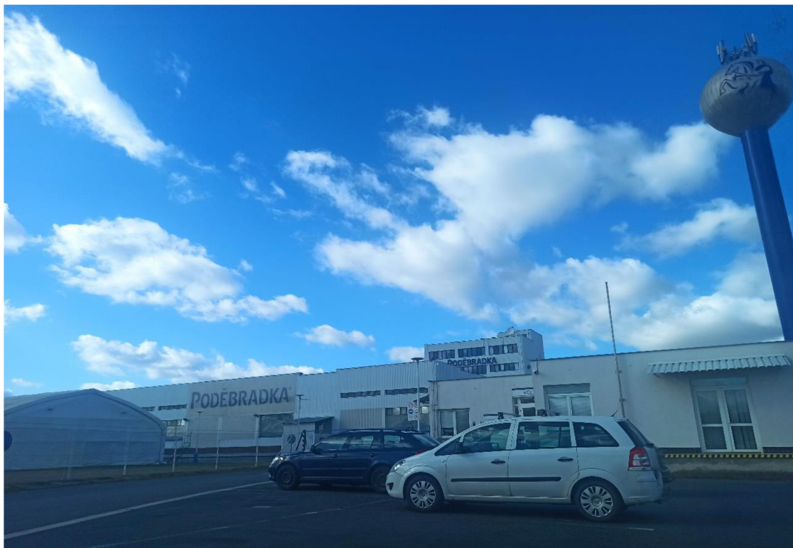
Obr. 22. Podnik ve Velkém Zboží na stáčení Poděbradky.

Prvním krokem je vyfouknutí plastového výlisku při dostatečné teplotě do požadovaného tvaru lahve. Následně se PET lahev naplní a automaticky zavře víčkem. Na láhev je následně přilepena etiketa a po lince směřuje dál k zabalení do obalu po šesti. Minerální voda se musí pravidelně zkoumat, zda odpovídá daným standardům. V plnárně se neplní Poděbradka pouze do PET lahví, ale také například do sudů pro distribuci do stravovacích zařízení (Automatizace v potravinářství.cz 2019).