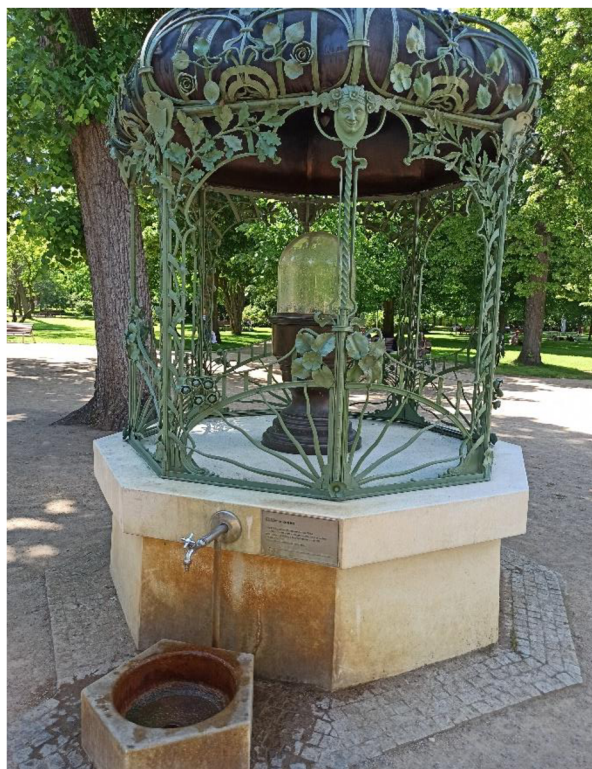
Obr. 17. a 18. Nejnovější pítko, které nese název Eliščin pramen.