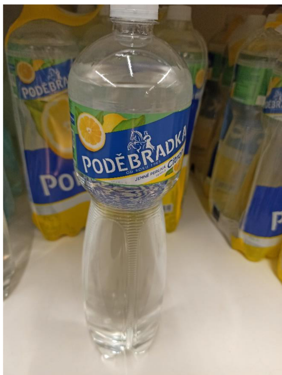
Obr. 23. Čirá lahev Poděbradky s příchutí citronu v obchodě.

Jedna z hlavních složek na etiketě je rozhodně složení, které se u jednotlivých lahví odvíjí od toho, zda je daná voda ochucená, či zda se jedná o Prolinii. Dále je na etiketě uvedena tabulka s výživovými údaji a výrobce. Na etiketě si lze přečíst, jak s lahví zacházet a jak jí skladovat. Další důležitou složkou etikety je výtah z chemického složení, kde je uveden obsah důležitých kationtů a aniontů. Na etiketě jsou samozřejmě i běžné informace jako je obsah lahve, čárový kód, informace k třídění, název a příchut' vody v dané lahvi.