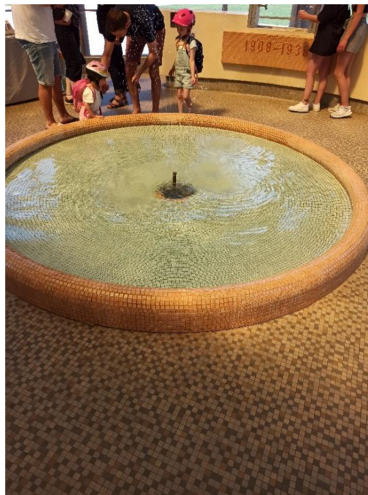
Obr. 5. a 6. Část lázeňského parkus kolonádou prof. Libenského a uvnitř pramen Boček a kašna (Autor Kateřina Suchardová).