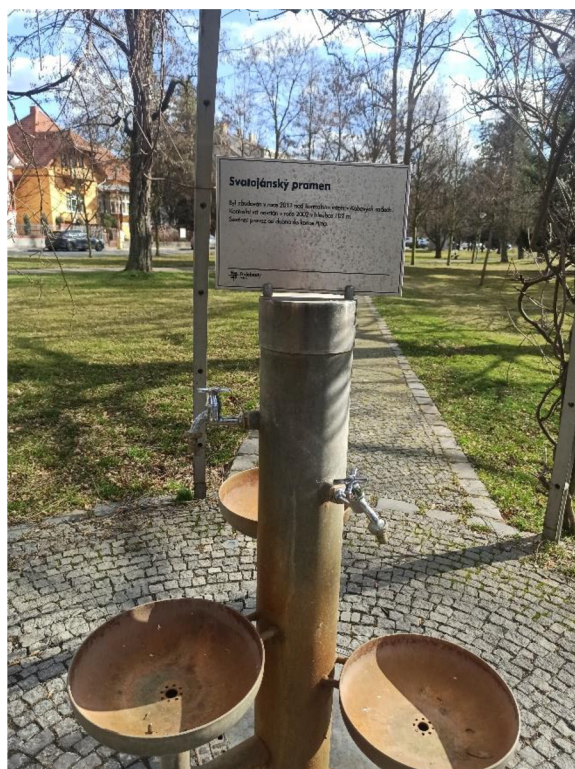
Obr. 15. a 16. Pítko Svatojánského pramene.