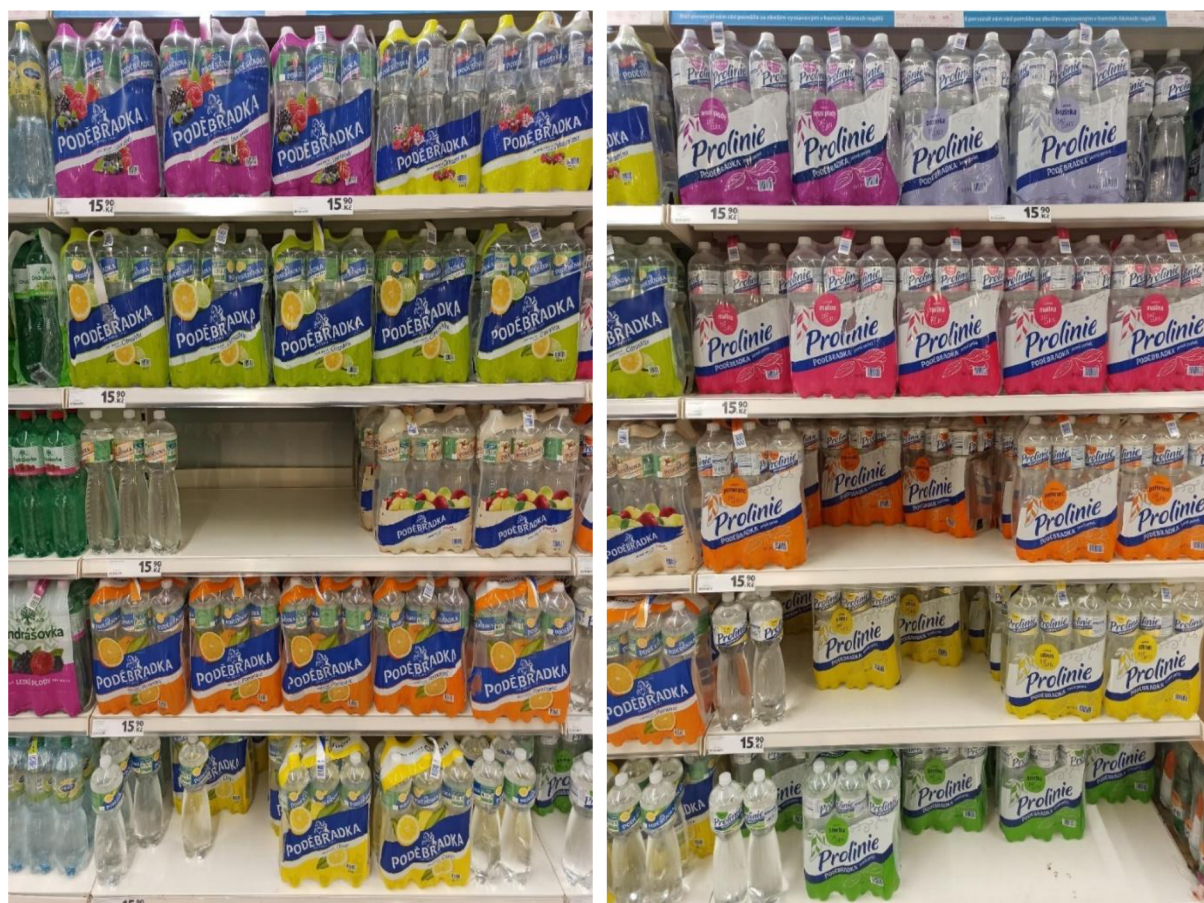
Obr. 26. a 27. Příklady druhů ochucených Poděbradek a Poděbradek Prolinií prodávané v obchodě Tesco Trutnov (Autor Kateřina Suchardová).