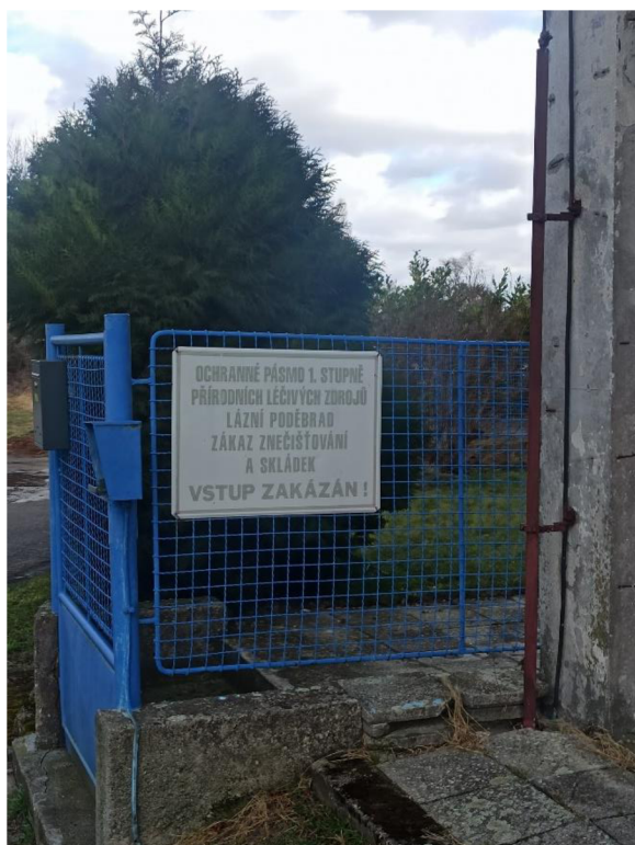
Obr. 1. Ochranné pásmo I. stupně v ulici Moučná (Autor Kateřina Suchardová).

Ochranná pásma Poděbradky byla vyhlášena již v roce 1976. Prameny Poděbradky jsou chráněna I. i II. stupněm ochranných pásem. Ochranné pásmo I. stupně nalezneme u každého vrtu v Poděbradech a v okolí. Ochranné pásmo II. stupně nalezneme především u vrtů v severozápadní a západní části Poděbrad a dále tímto směrem u vrtů v okolí Poděbrad. Ochrana závisí na příslušnosti minerálních vod k akumulaci uhličitých vod v cenomanu křídové pánve, a přitom je důležité ponechat neměnný hydraulický tlak (Hrabětová et al. 1998).