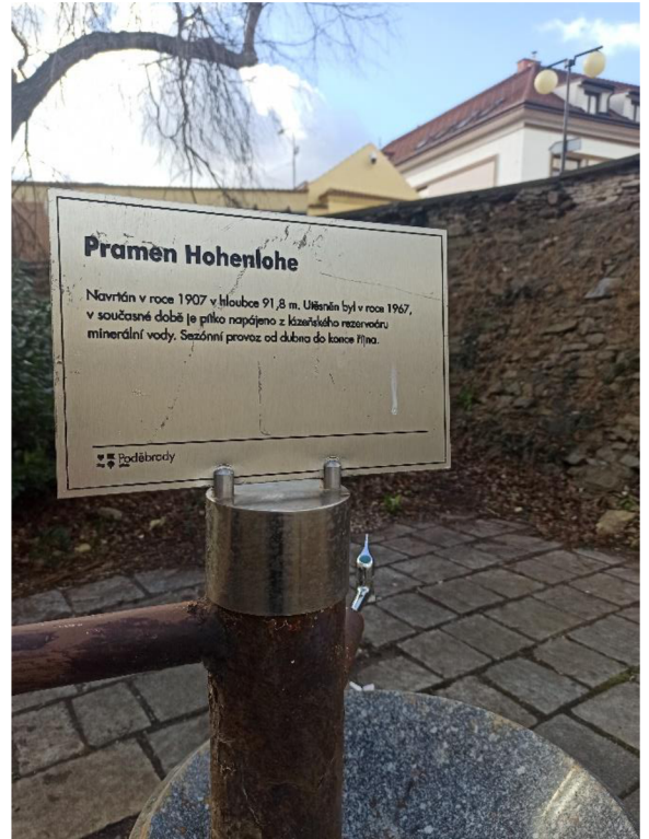
Obr. 12. a 13. Pítka pramene Hohenlohe v zámeckém příkopu. Při fotografování právě probíhala údržba pitka, a to v podobě odželezňování (Autor Kateřina Suchardová).