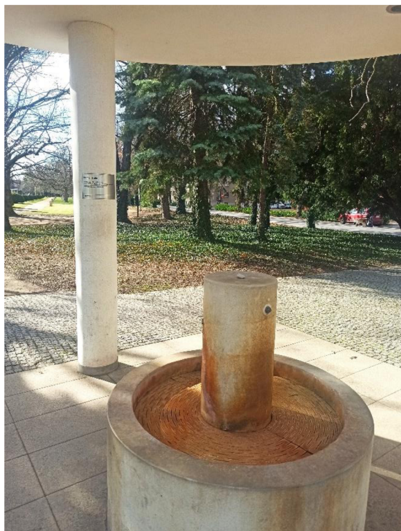
Obr. 10. Pítko pramene Trnka u vlakového nádraží.