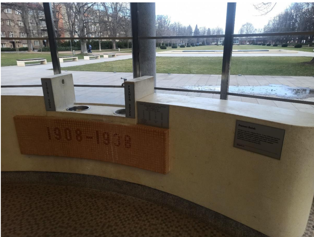
Obr. 14. Pítka pramene Boček v Libenské kolonádě (Autor Kateřina Suchardová).