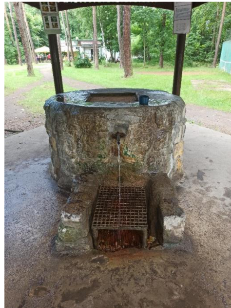
Obr. 19 a 20. Svatojosefský pramen v Kersku se svým pítkem.