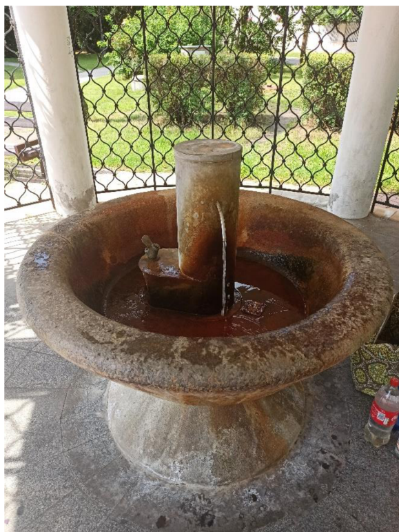
Obr. 21. Obecní pramen ve Velkém Oseku na Husově náměstí.

U této uhličitě, silně mineralizované a studené vody dosahuje mineralizace až 4900 mg/l a obsahu CO 2 2300 mg/l. První vrt z roku 1935 nebyl vyhovující, a tak roku 1994 byl navrtán vrt NZ1, který napájí pramen na Husově náměstí do současnosti. Voda je z hloubky až 59 m a je téměř totožná s vodou vyvěrající v Poděbradech. Po natočení kyselky do lahve ucítíme silný sirovočíkový zápach, který do týdne odezní. U pramene je známo, že se zápach i mineralizace výrazně mění v průběhu roku. Teplota vody tohoto pramene dosahuje hodnot od 12 do 15 °C (Minerálky.wz.cz 2014).