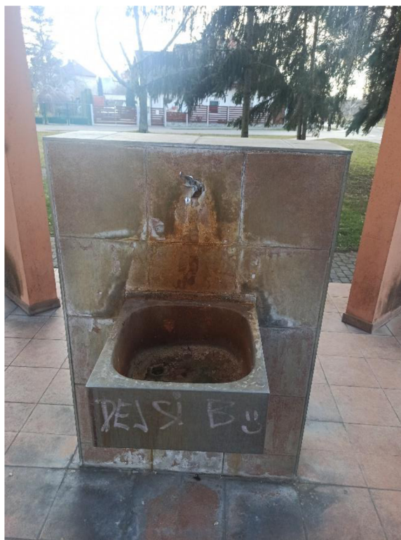
Obr. 8. a 9. Pítko v ulici Moučná neboli Žižkův pramen.