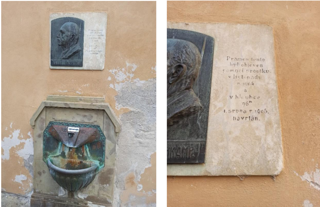
Obr. 3 a 4. Pramen Bülow s plakétou barona Bülowa.

Nad pítkem pramene Bülow se nachází kamenná památná deska, na které je napsáno „Pramen tento byl objeven pomocí proutku v listopadu r. 1904 a v hloubce 96 m 1. srpna r. 1905 navrtán.“