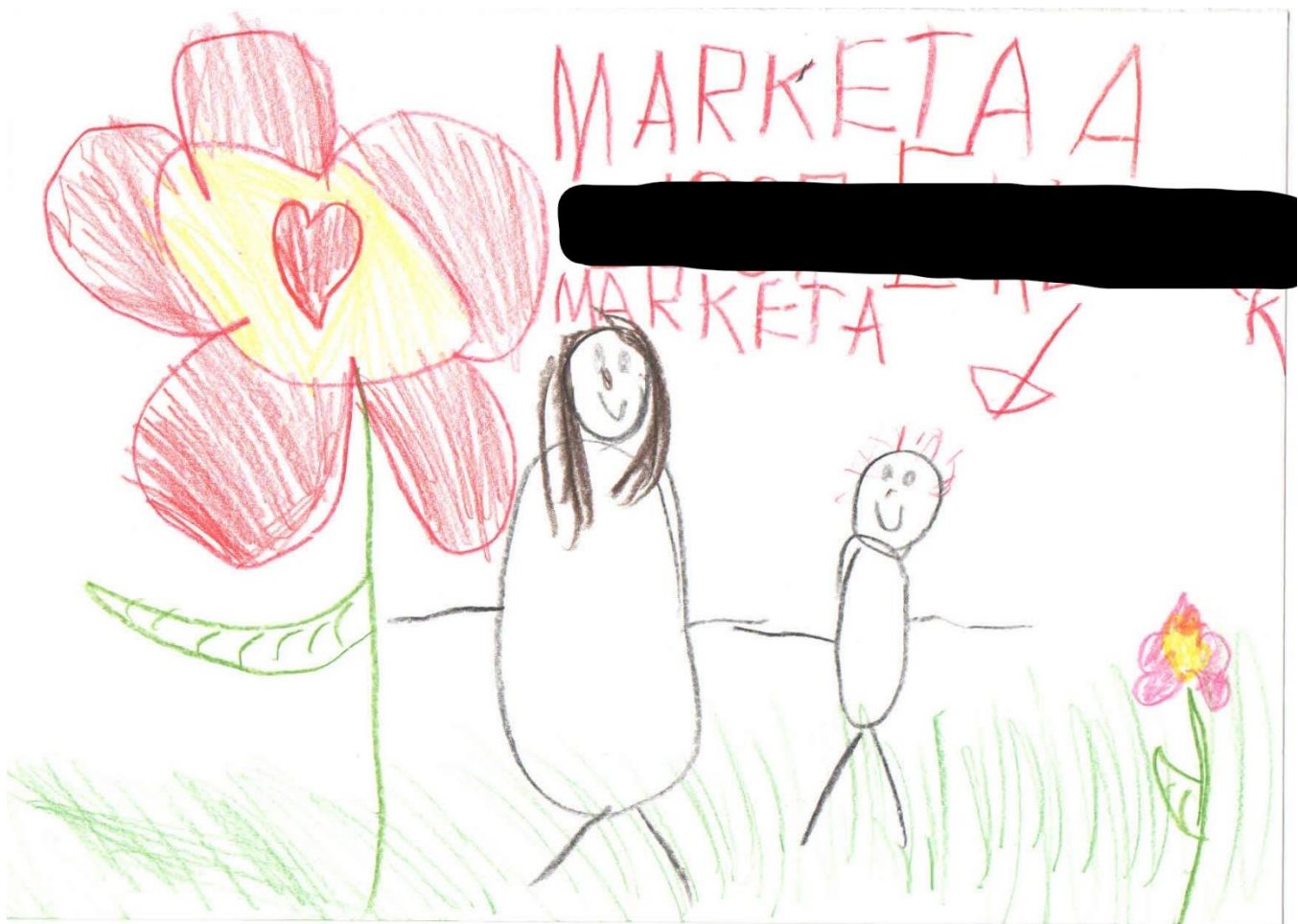
Obrázek č. 1, spontánní kresba lidské postavy