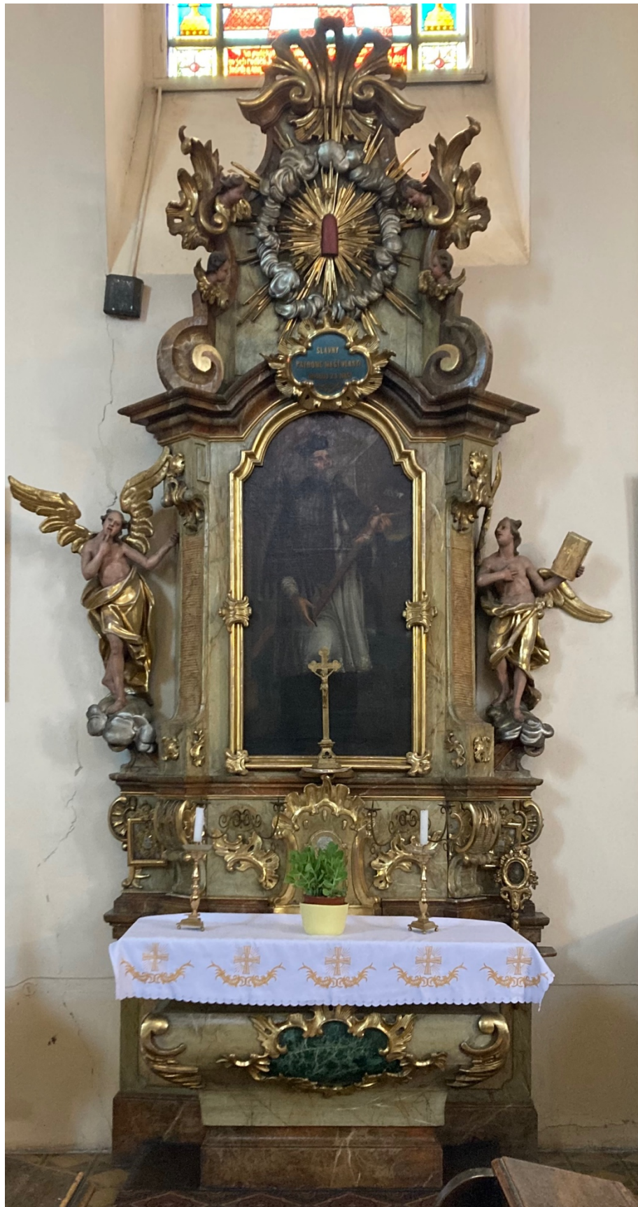
Obr. 24: Oltář sv. Jana Nepomuckého, po 1765, dřevo, zlacení, polychromie, mramorování, Žebrák, kostel sv. Vavřince, jižní stěna hlavní lodi