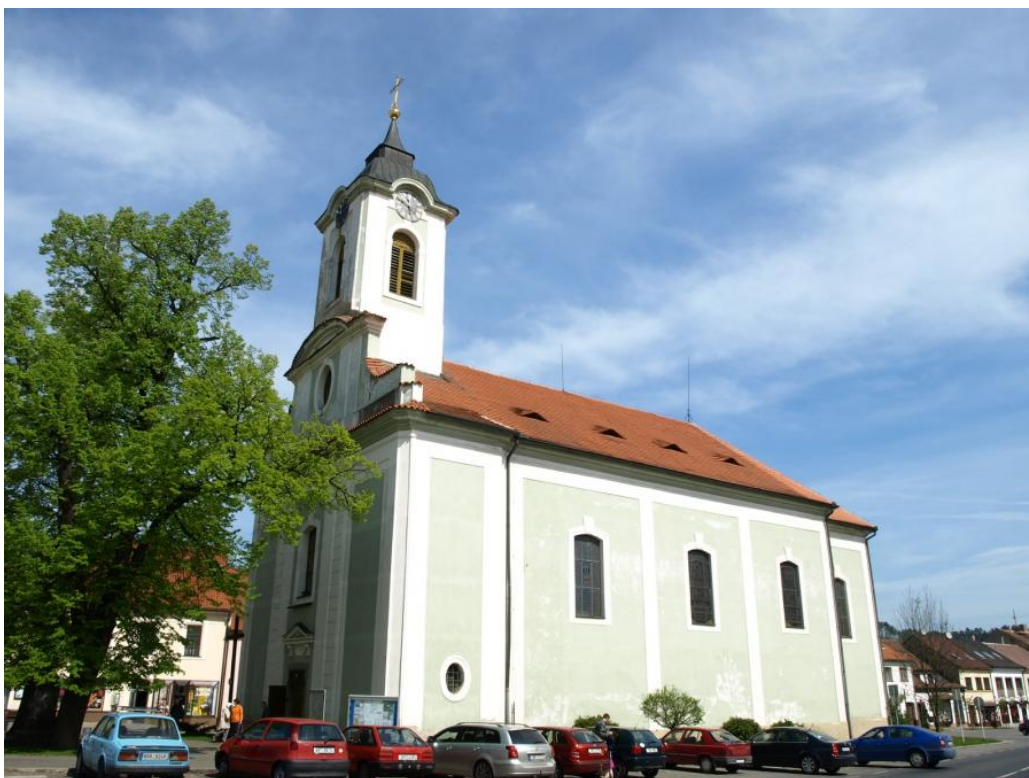
Obr. 8: Žebrák, kostel sv. Vavřince, pohled od jihozápadu