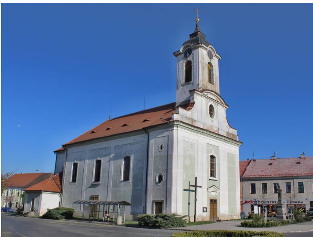
Obr. 7: Žebrák, kostel sv. Vavřince, pohled od severozápadu