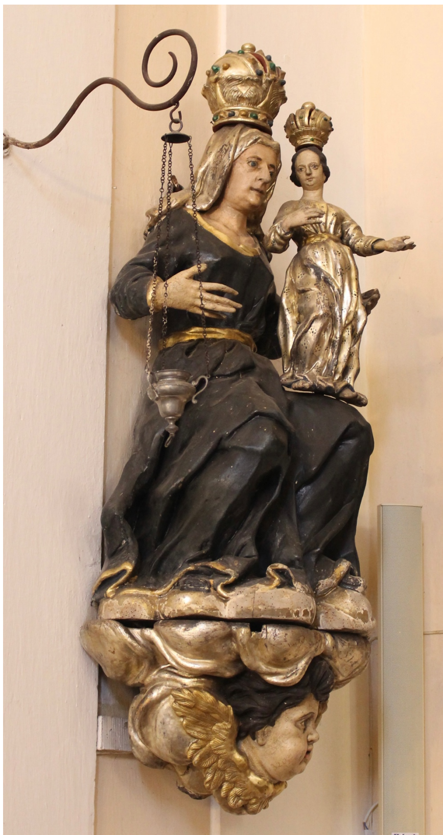
Obr. 33: Sv. Anna Samotřetí, okolo 1700, dřevo, polychromie, Žebrák, kostel sv. Vavřince, pilastr při jižní stěně hlavní lodi