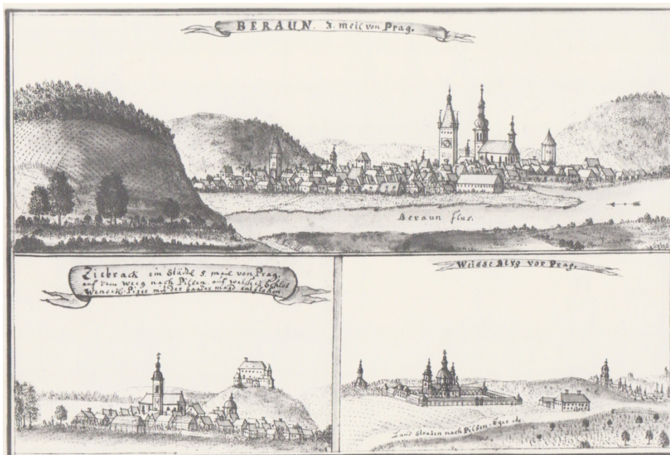
Obr. 1: Friedrich Bernhard Werner, Hrad a město Žebrák, 1715.