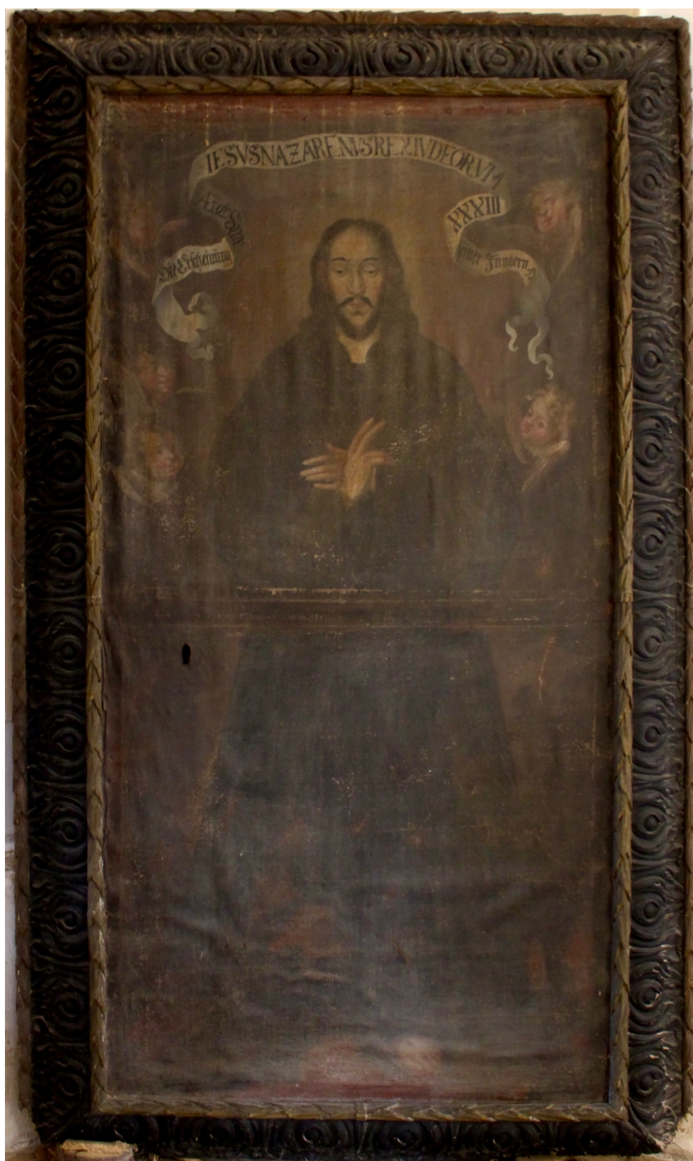
Obr. 38: Žehnající Kristus, okolo 1700 (?), olej, plátno, Žebrák, kostel sv. Vavřince, severní stěna podkruchtí