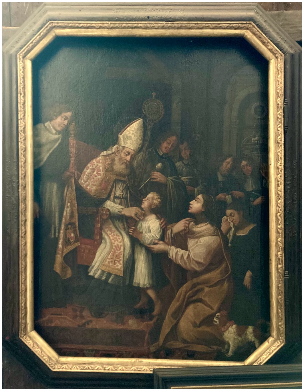
Obr. 40: Sv. Blažej, před 1700 (?), olej, plátno, Žebrák, kostel sv. Vavřince, chór