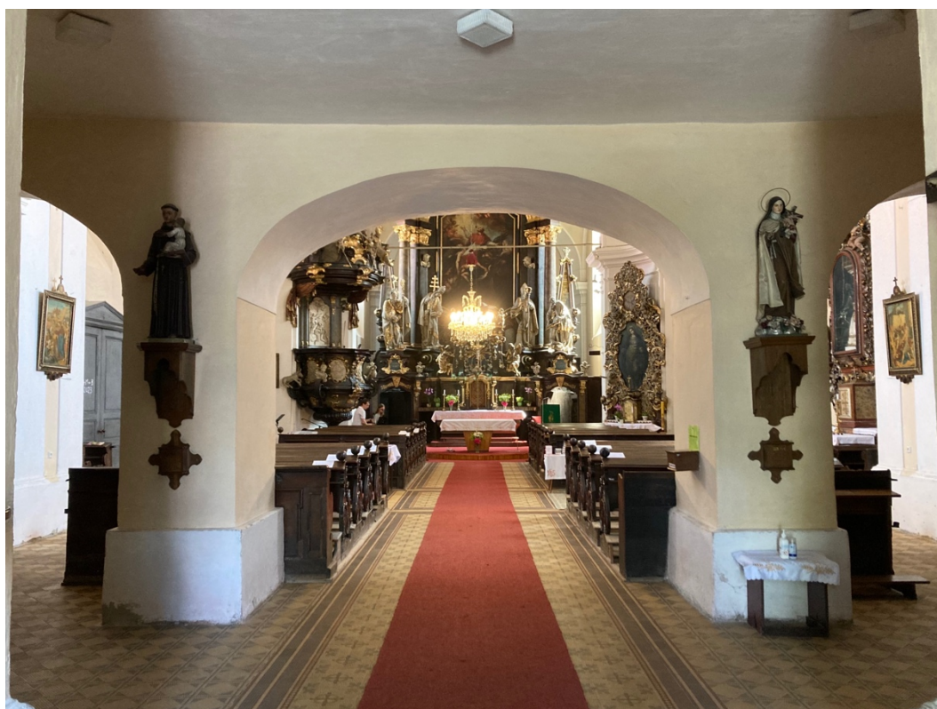
Obr. 10: Žebrák, kostel sv. Vavřince, interiér, pohled z podkruchtí k hlavnímu oltáři