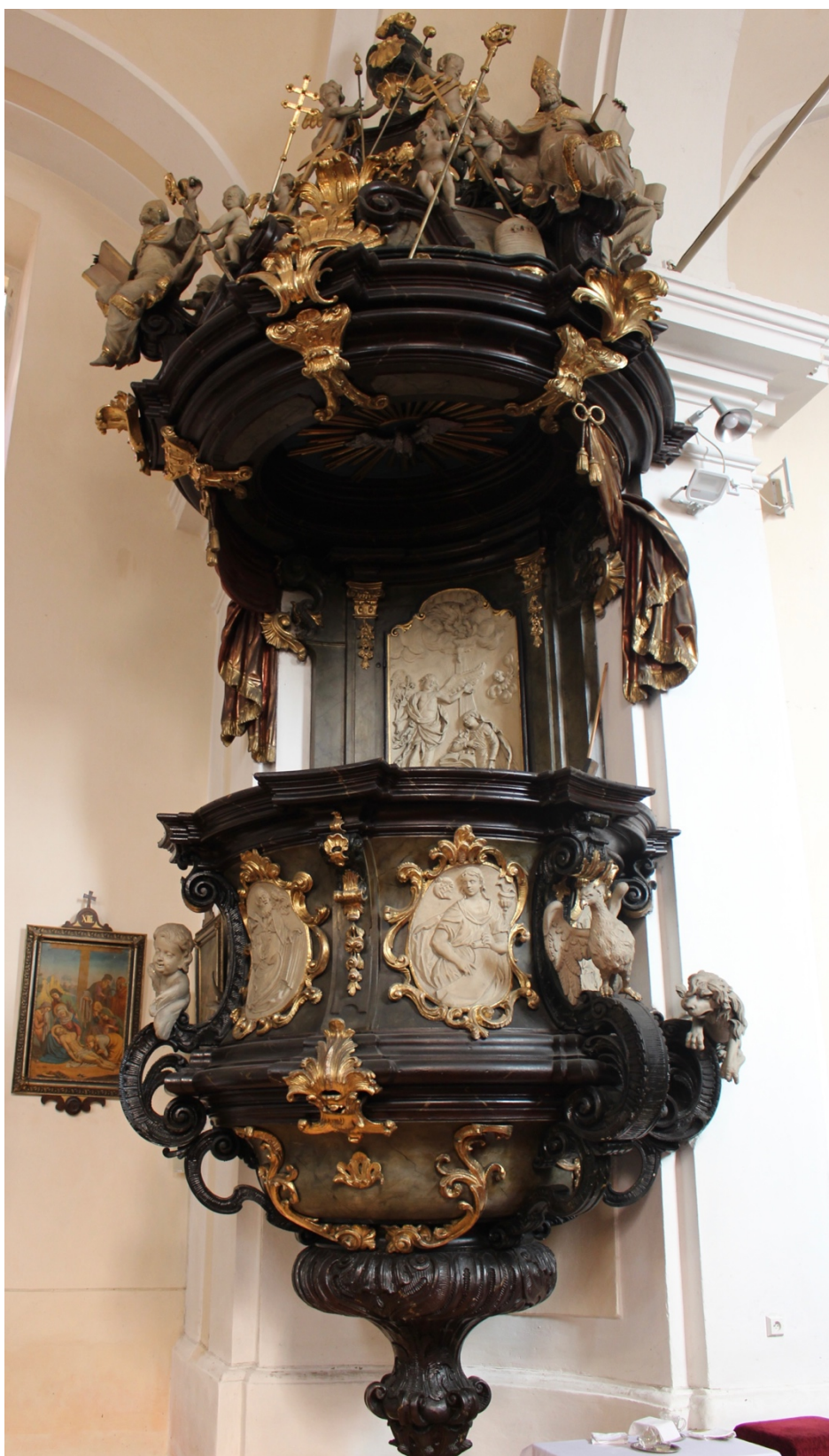
Obr. 41: Ignác Platzer (dílna) (?), sochařská výzdoba kazatelny, šedesátá léta 18. století (?), dřevo, štafírování, zlacení, Žebrák, kostel sv. Vavřince, severní strana vítězného oblouku