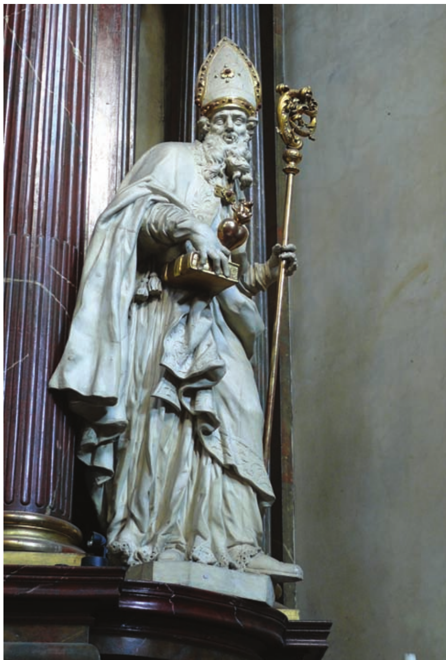
Obr. 20: Matěj Václav Jäckel, Sv. Augustin, 1700–1701, bíle lakované dřevo, Praha, kostel sv. Františka Serafinského, hlavní oltář