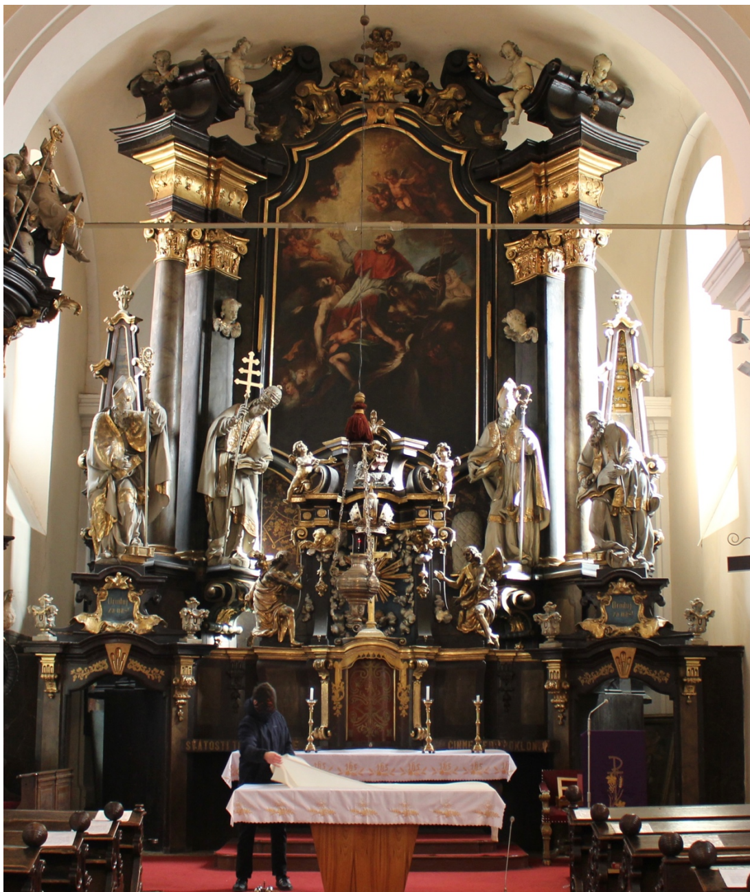
Obr. 13: Žebrák, kostel sv. Vavřince, západní chór, hlavní oltář sv. Karla Boromejského