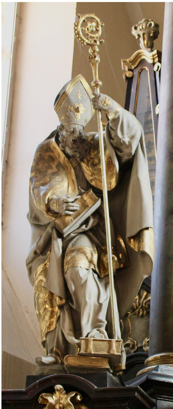
Obr. 16: Matěj Václav Jäckel (dílna) (?), Sv. Augustin, 1736 (?), štafirované a zlacené dřevo, Žebrák, kostel sv. Vavřince, hlavní oltář