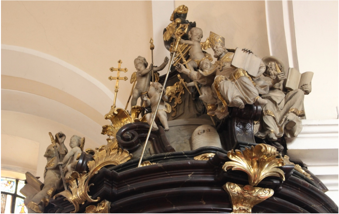
Obr. 41: Ignác Platzer (dílna) (?), církevní otcové na stříšce kazatelny, šedesátá léta 18. století (?), dřevo, štafirování, zlacení, Žebrák, kostel sv. Vavřince, severní strana vítězného oblouku