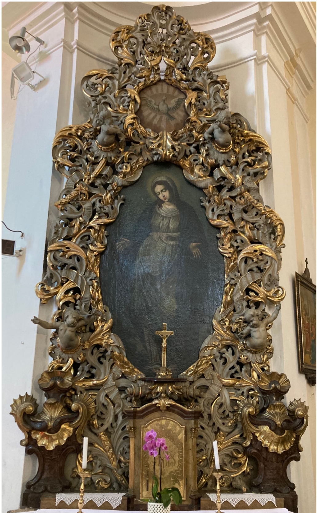
Obr. 27: Oltář Panny Marie Karlovské, přelom 17. a 18. století (?), dřevo, štafírování, zlacení, Žebrák, kostel sv. Vavřince, jižní strana vítězného oblouku