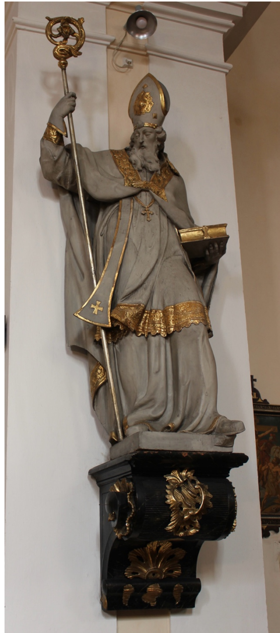
Obr. 32: Ignác František Platzer (dílna) (?), Sv. Augustin (?), šedesátá léta 18. století (?), dřevo, štafírování, zlacení, Žebrák, kostel sv. Vavřince, pilastr při severní stěně hlavní lodi