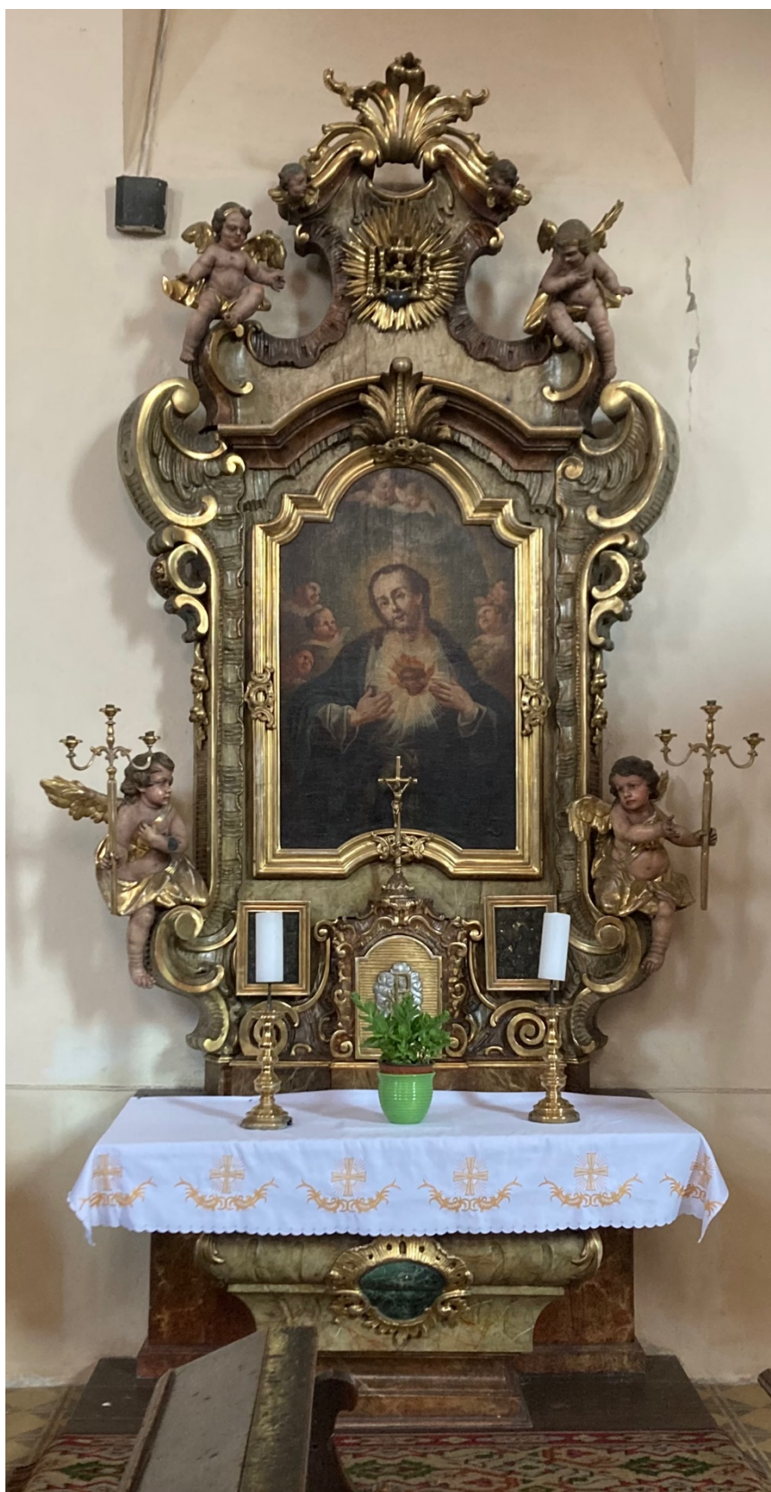
Obr. 29: Oltář Nejsvětějšího Srdce Páně, 1779, dřevo, zlacení, polychromie, mramorování, Žebrák, kostel sv. Vavřince, severní stěna hlavní lodi