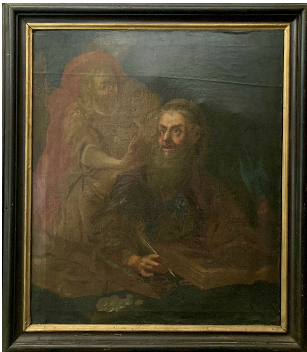
Obr. 34: Sv. Matouš, okolo 1750 (?), olej, plátno, Žebrák, kostel sv. Vavřince, chór