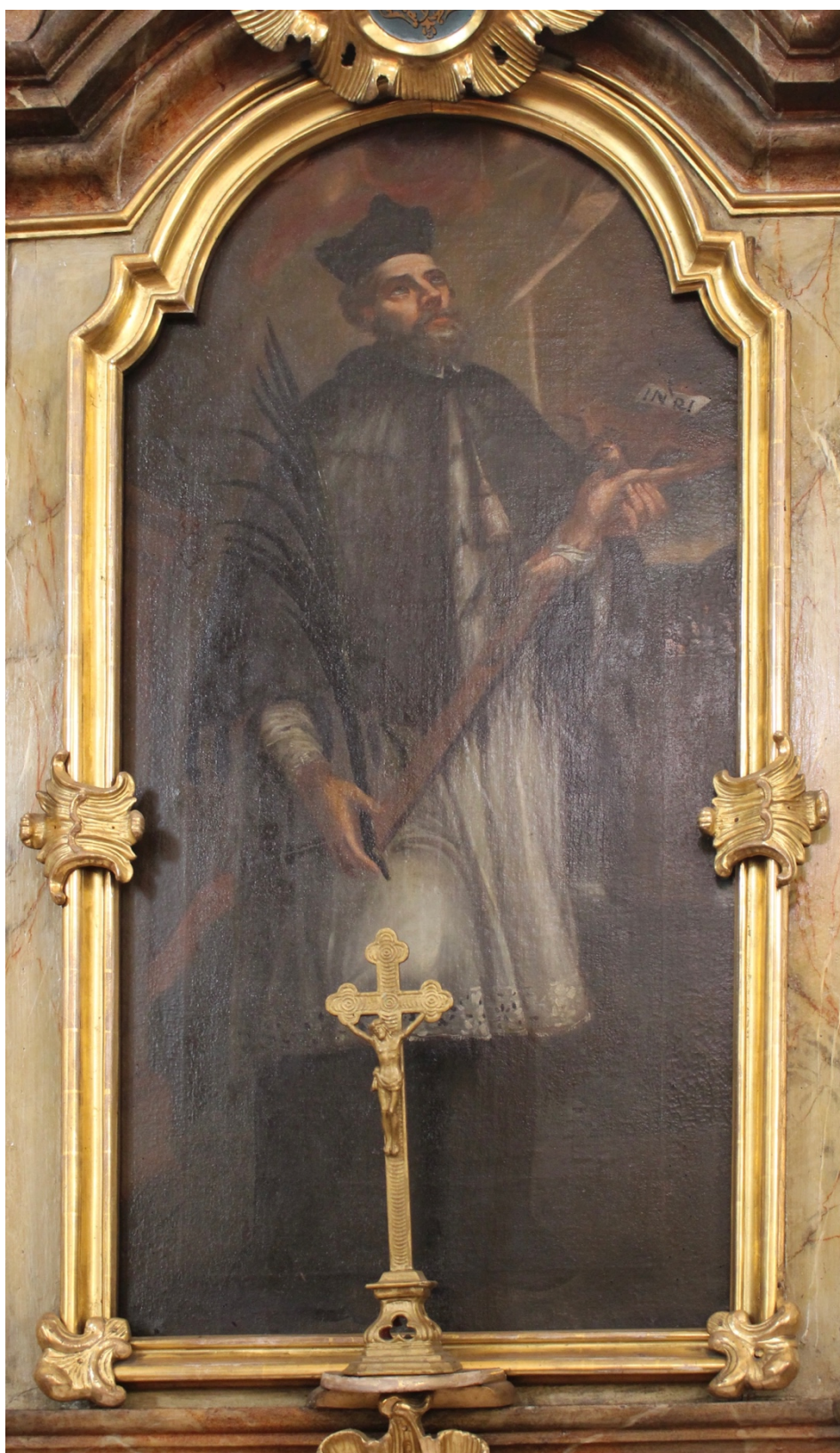
Obr. 25: Sv. Jan Nepomucký, první čtvrtina 18. století (?), olej, plátno, Žebrák, kostel sv. Vavřince, oltář sv. Jana Nepomuckého