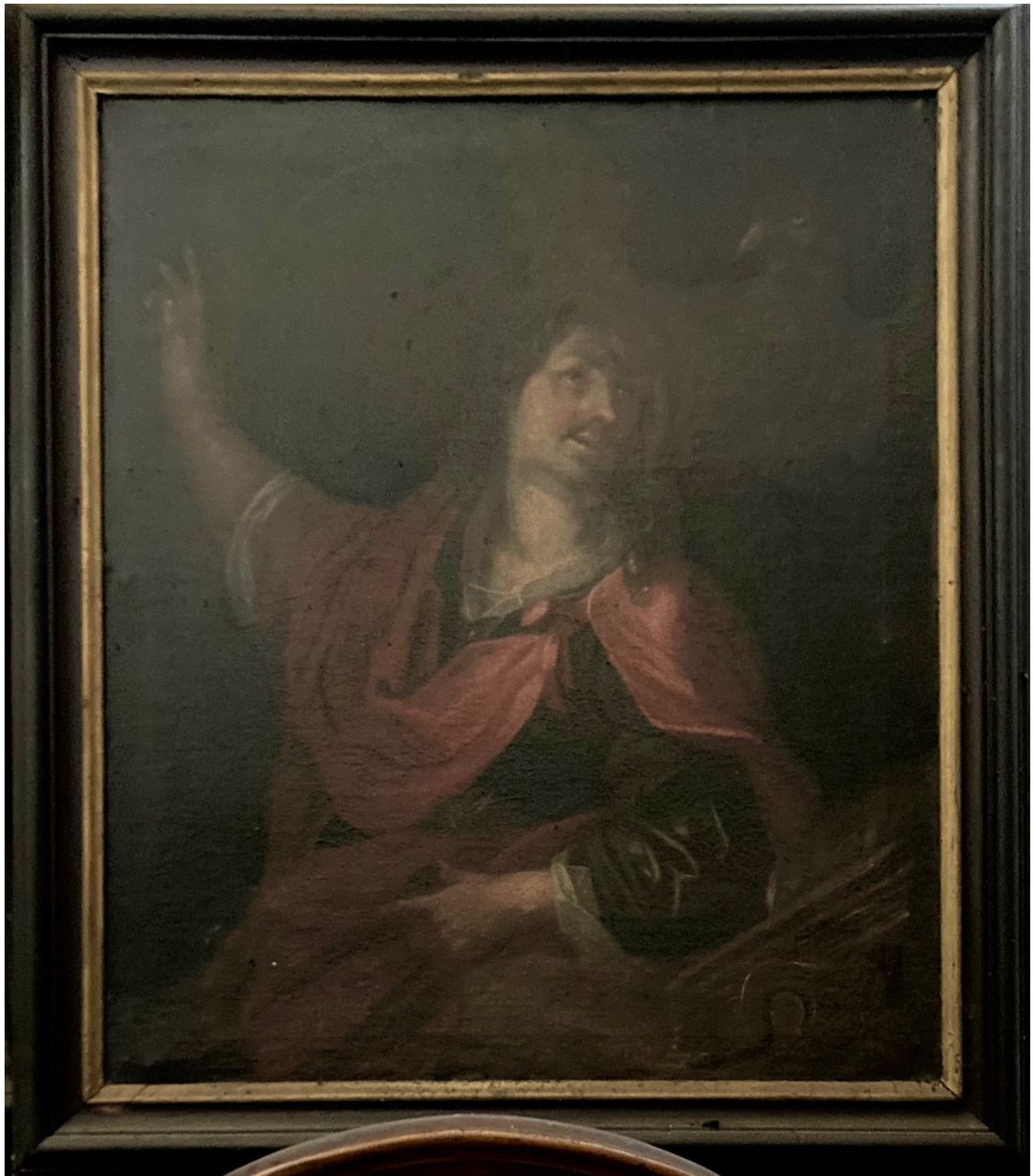
Obr. 37: Sv. Jan Evangelista, okolo 1750 (?), olej, plátno, Žebrák, kostel sv. Vavřince, chór