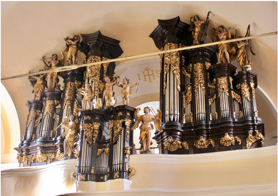
Obr.42: Ignác Platzer (dílna) (?), varhanní skříň, šedesátá léta 18. století (?), dřevo, zlacení, Žebrák, kostel sv. Vavřince, kruchta