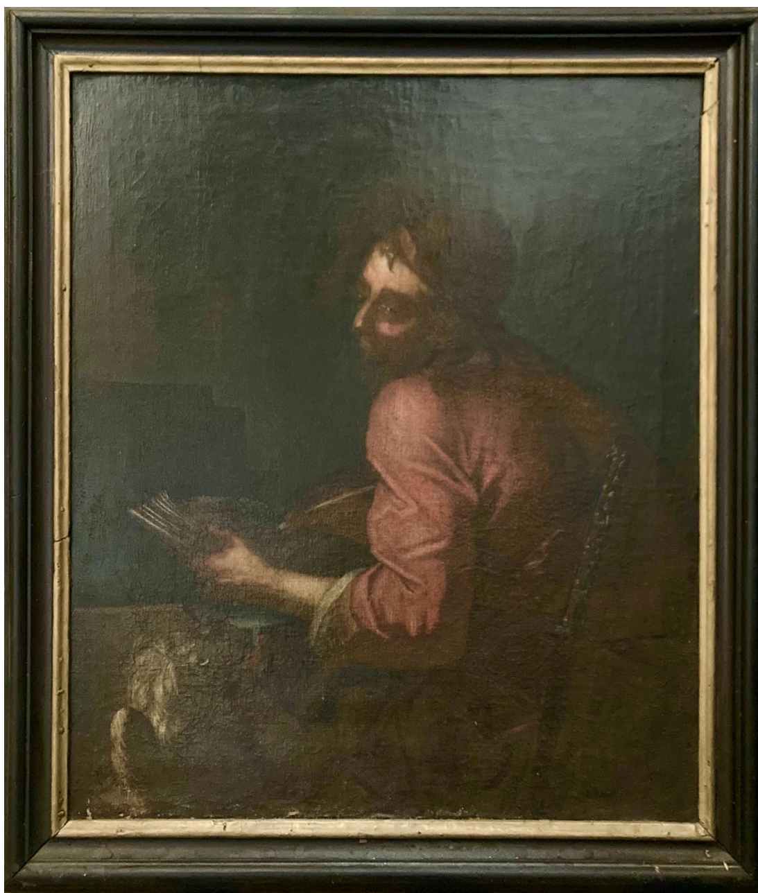
Obr.35: Sv. Marek, okolo 1750 (?), olej, plátno, Žebrák, kostel sv. Vavřince, chór