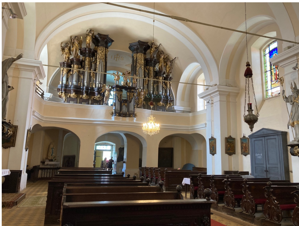
Obr. 12: Žebrák, kostel sv. Vavřince, interiér, pohled k východní kruchtě