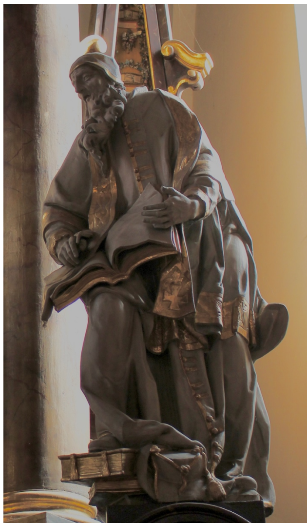
Obr. 18: Matěj Václav Jäckel (dílna) (?), Sv. Ambrož, 1736 (?), štafírované a zlacené dřevo, Žebrák, kostel sv. Vavřince, hlavní oltář Obr. 19: Matěj Václav Jäckel (dílna) (?), Sv. Jeroným, 1736 (?), štafírované a zlacené dřevo, Žebrák, kostel sv. Vavřince, hlavní oltář