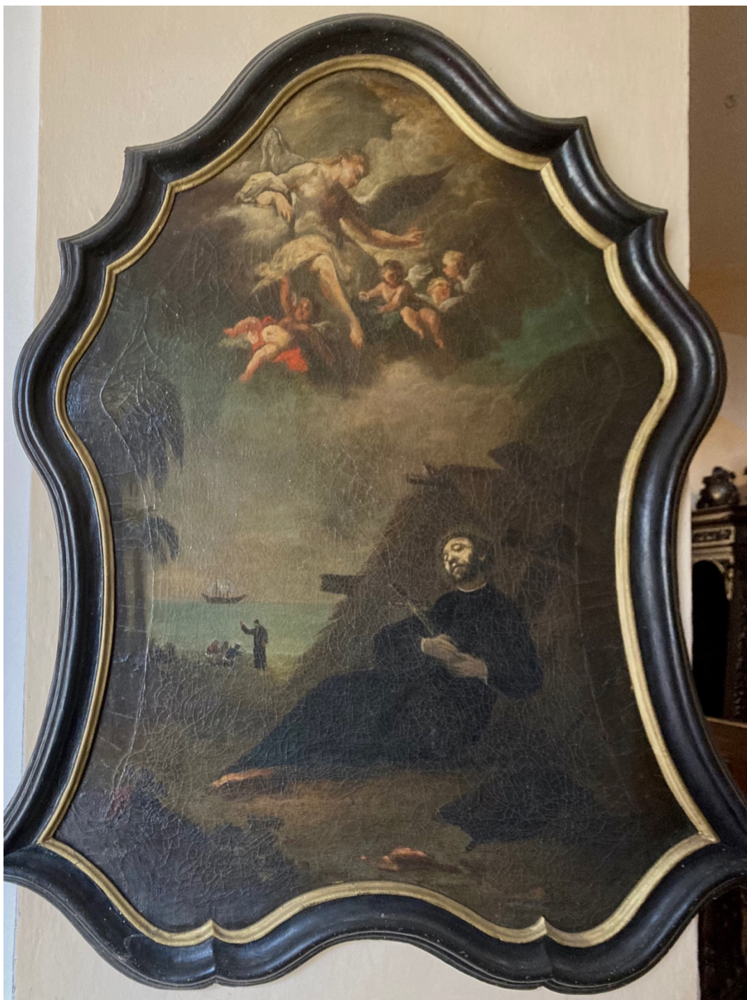
Obr. 39: Smrt Františka Xaverského, 2. polovina 18. století, olej, plátno, Žebrák, kostel sv. Vavřince, západní stěna jižního pilíře v podkruchtí