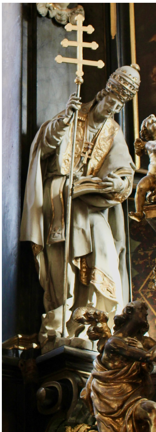
Obr. 17: Matěj Václav Jäckel (dílna) (?), Sv. Řehoř Veliký, 1736 (?), štafirované a zlacené dřevo, Žebrák, kostel sv. Vavřince, hlavní oltář