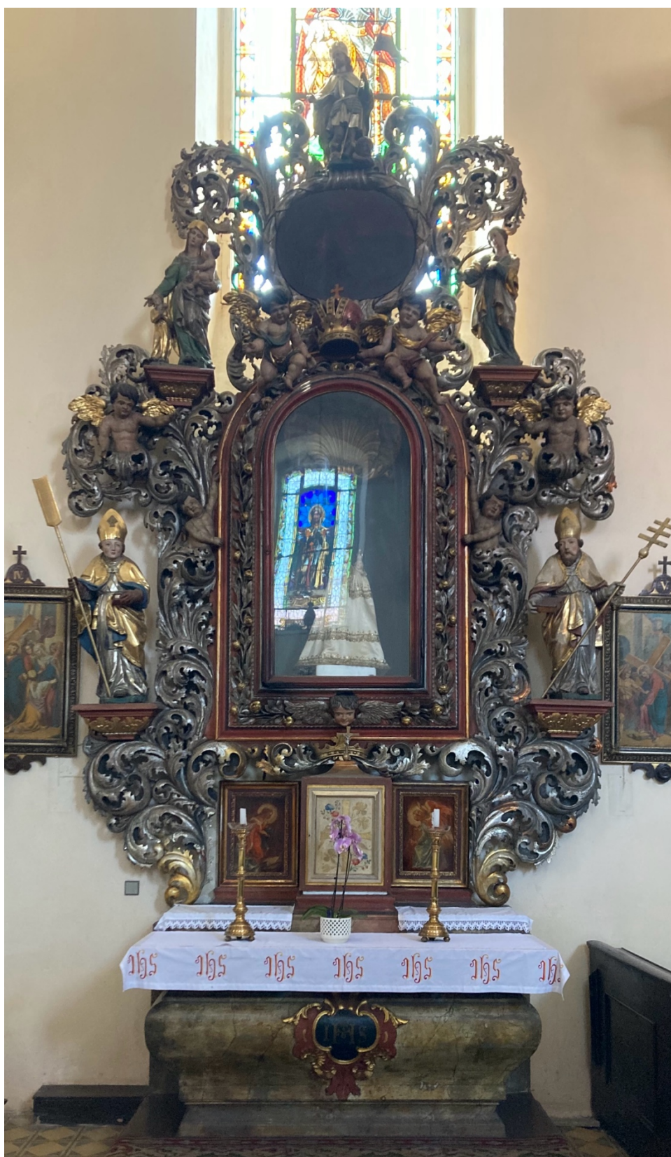
Obr. 26: Oltář Panny Marie, před 1691, dřevo, polychromie, zlacení, Žebrák, kostel sv. Vavřince, jižní stěna hlavní lodi