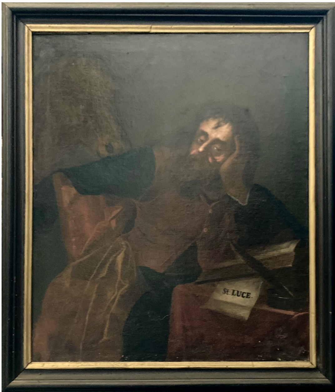
Obr. 36: Sv. Lukáš, okolo 1750 (?), olej, plátno, Žebrák, kostel sv. Vavřince, chór