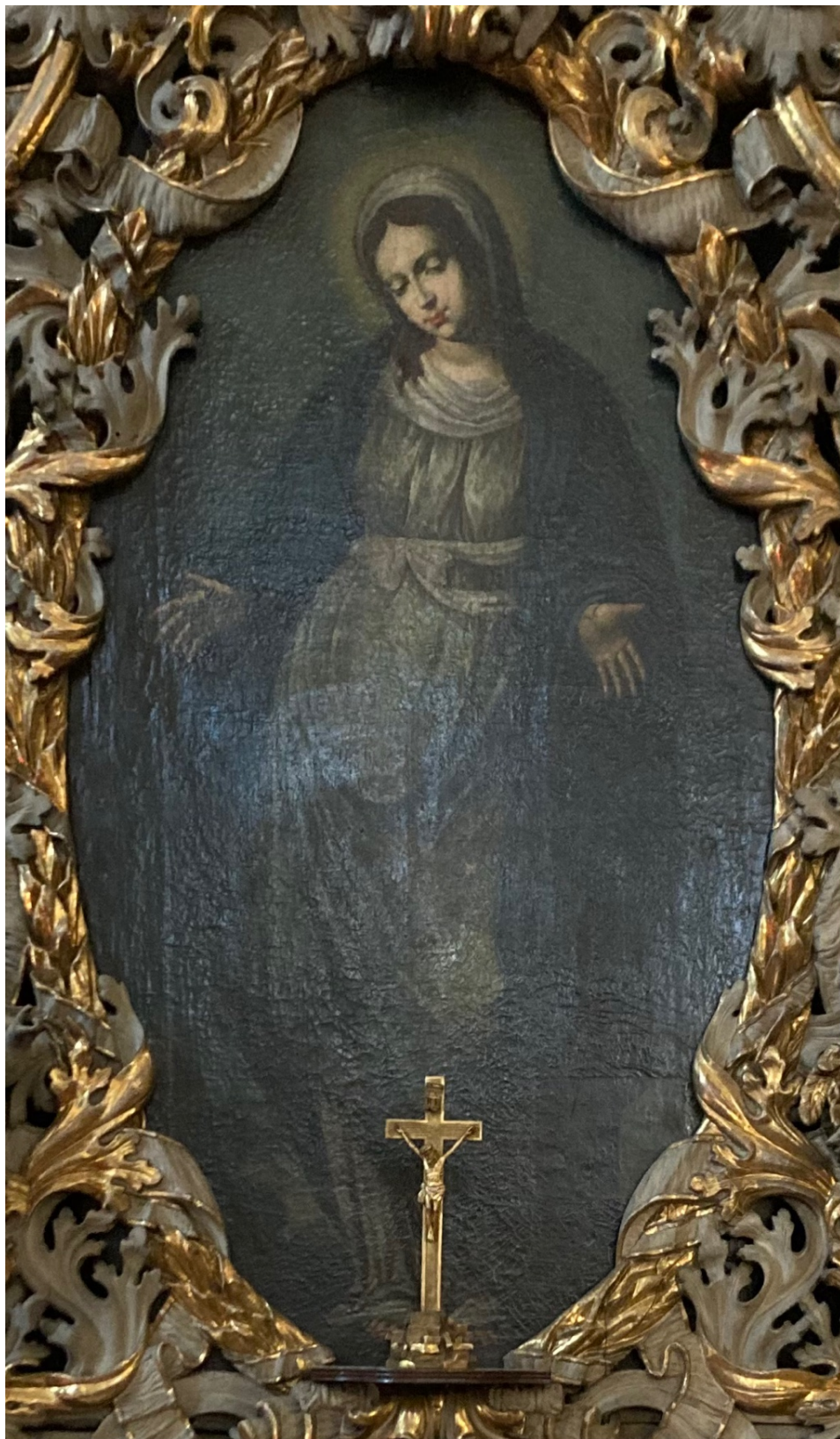
Obr. 28: Panna Marie Karlovska, počátek 18. století (?), olej, plátno, výřez rámu asi 210 x 125 cm, Žebrák, kostel sv. Vavřince, oltář Panny Marie Karlovské