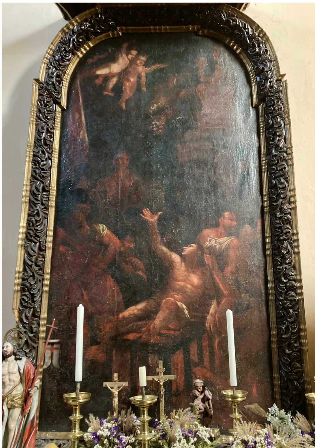
Obr. 21: František Karel Seeblumer (?), Umučení sv. Vavřince, osmdesátá léta 17. století (?), olej, plátno, Žebrák, kostel sv. Vavřince, chór