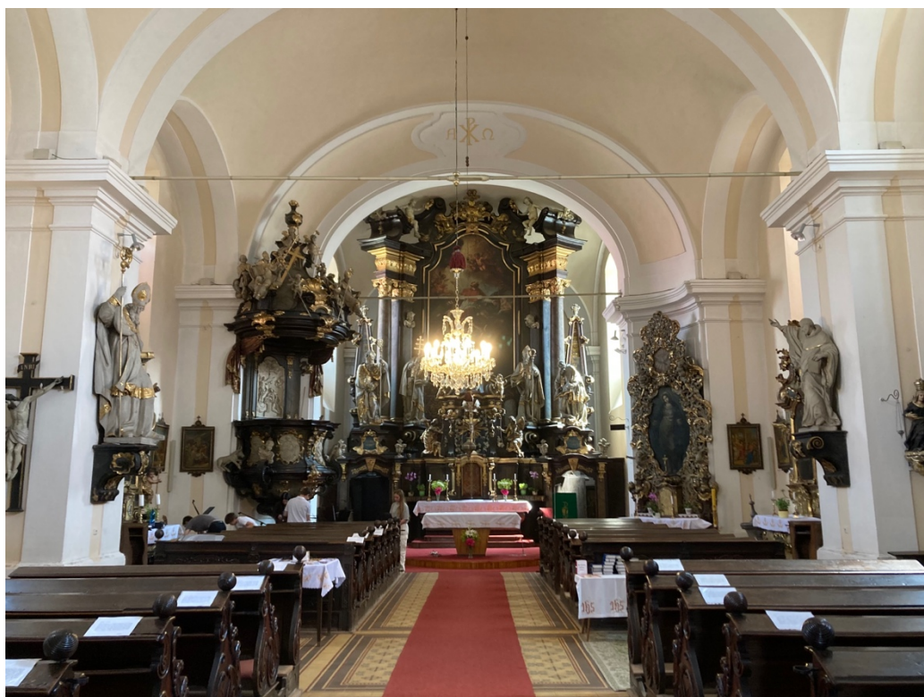
Obr. 11: Žebrák, kostel sv. Vavřince, interiér, pohled k západnímu chóru