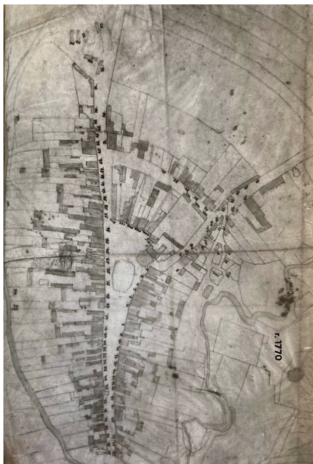
Obr. 2: Plán města v roce 1770