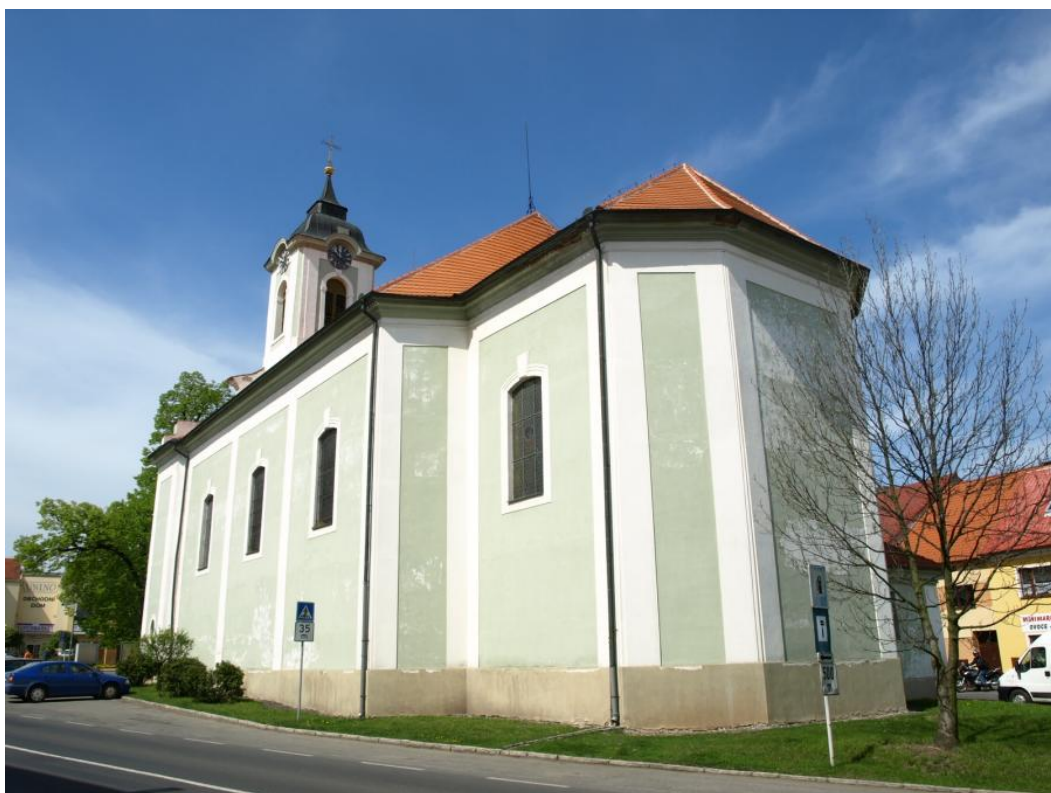
Obr. 9: Žebrák, kostel sv. Vavřince, pohled od jihovýchodu