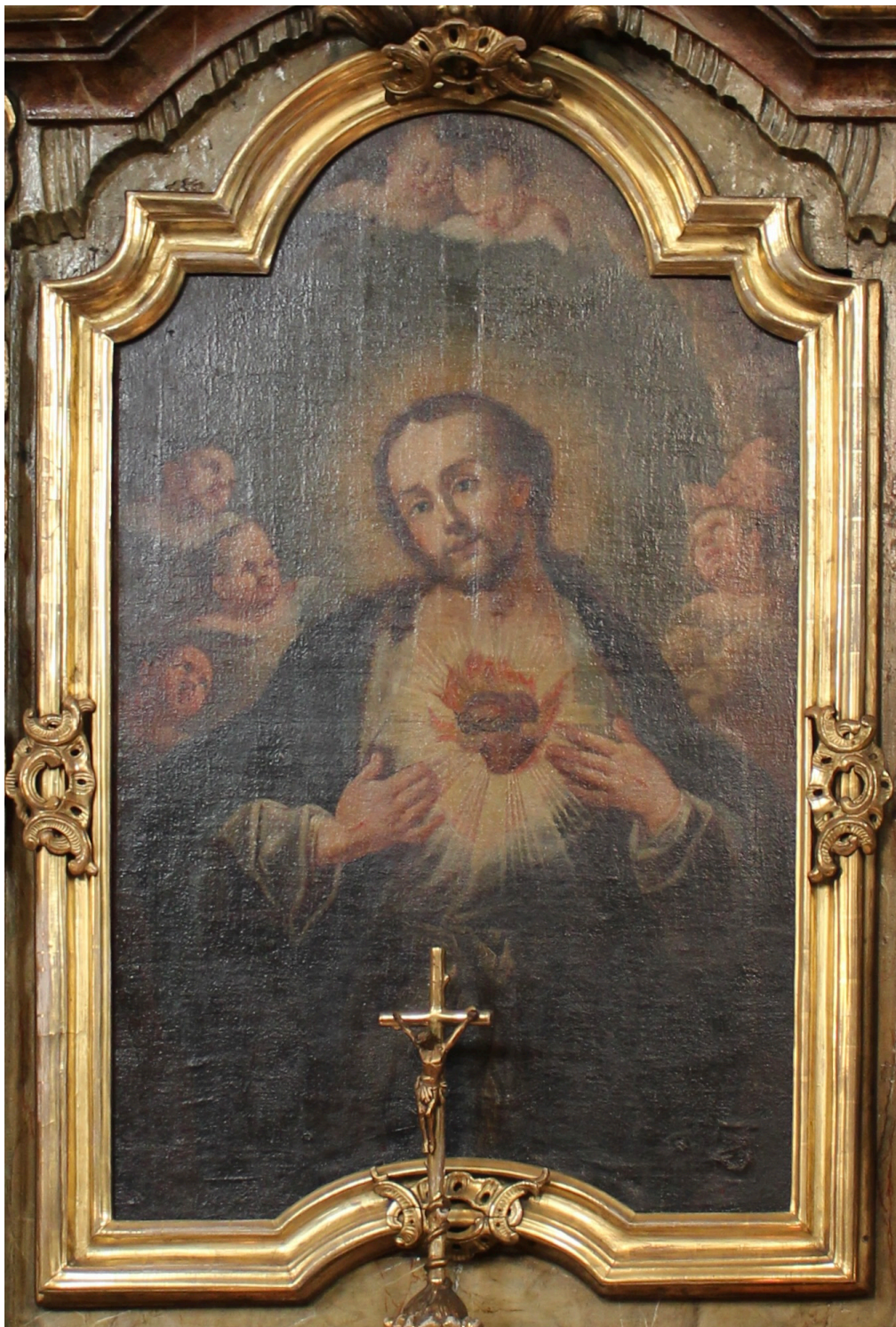
Obr. 30: Ignác Raab, Nejsvětější Srdce Páně, 1779, olej, plátno, Žebrák, kostel sv. Vavřince, oltář Nejsvětějšího Srdce Páně