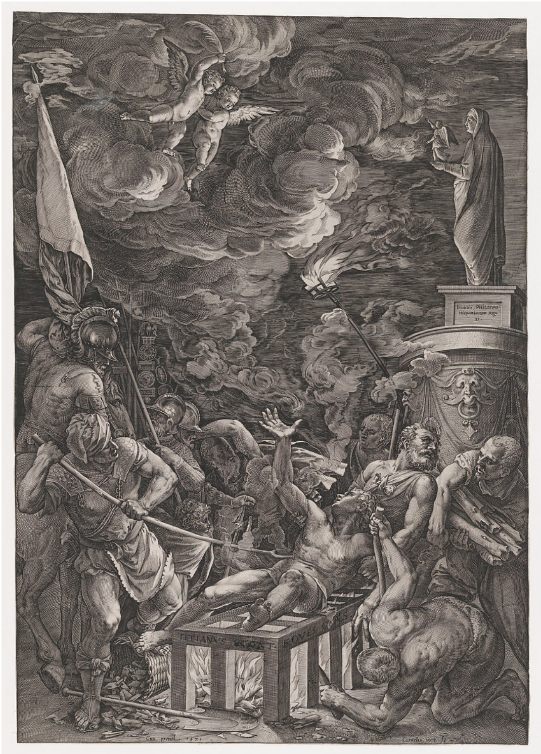
Obr. 22: Cornelis Cort, Umučení sv. Vavřince , 1571, rytina, 50,3 x 34,9 cm