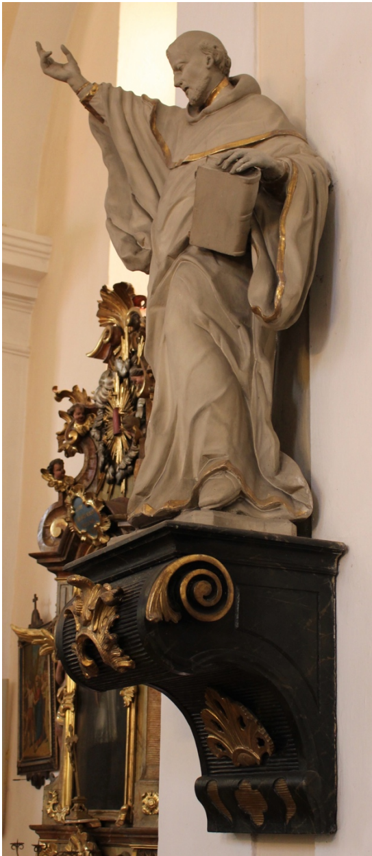
Obr. 31: Ignác František Platzer (dílna) (?), Sv. Bernard (?), šedesátá léta 18. století (?), dřevo, štafírování, zlacení, Žebrák, kostel sv. Vavřince, pilastr při jižní stěně hlavní lodi