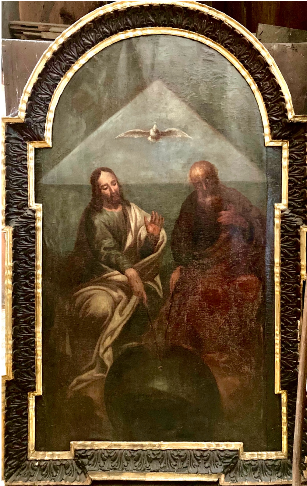
Obr. 23: Karel Seebumer (?), Nejsvětější Trojice, osmdesátá léta 17. století (?), olej, plátno, Žebrák, kostel sv. Vavřince, chór