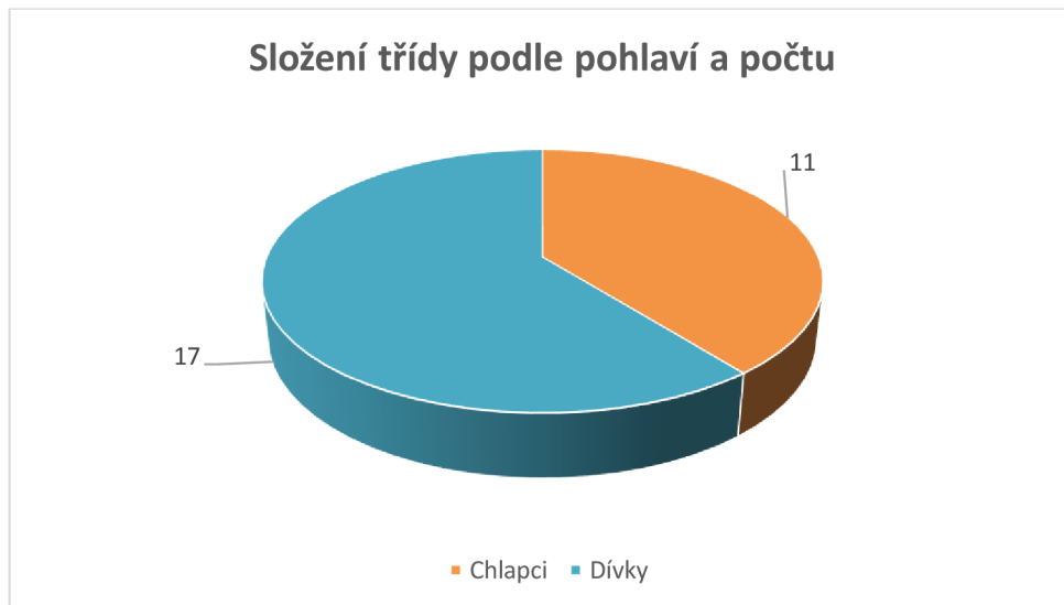
Graf č.1 – Složení třídy podle pohlaví a počtu dětí

narušeného vnímání, pozornosti a nedostatečně rozvinutých grafomotorických dovedností.