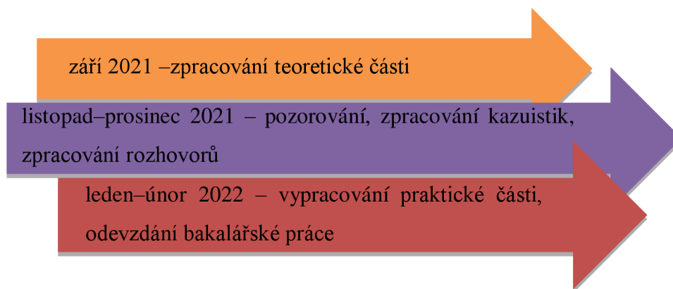
Schéma č. 1 Harmonogram výzkumu