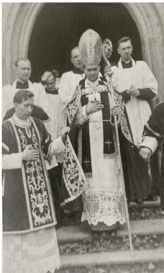
Příloha č. 2: Josef Hlouch již jako biskup českobudějovický.