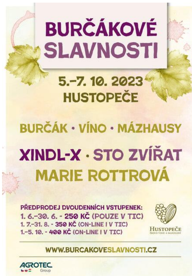
Obrázek 3 – Plakát Burčákové slavnosti 2023