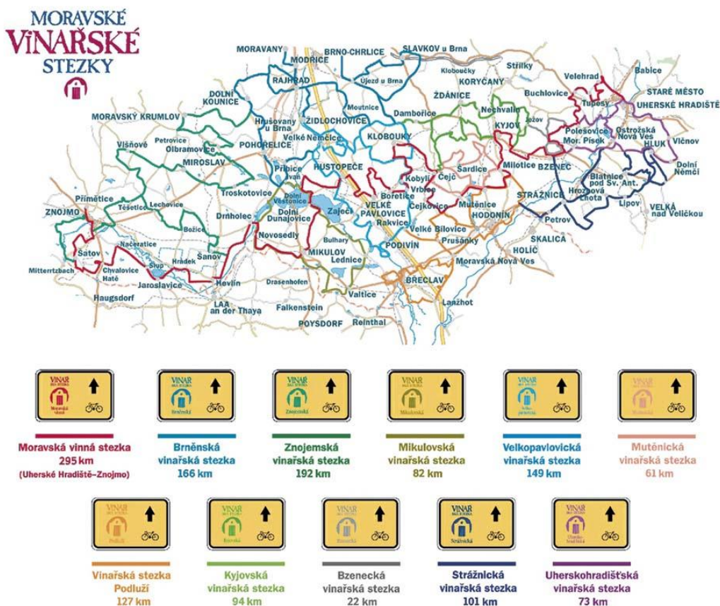
Obrázek 5 - Schéma - Moravské vinařské stezky, zdroj: Celyoturismu.cz (2023)