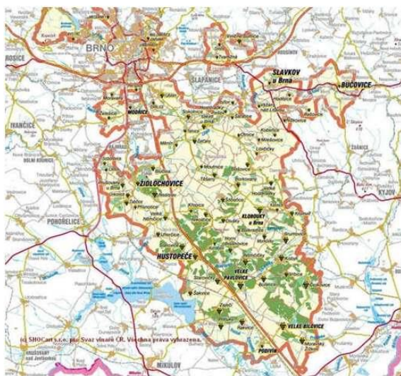
Obrázek 2 - Výřez mapy velkopavlovické podoblasti, zdroj: Vinotéka vinečko (2023)

Velkopavlovická vinařská podoblast se podle webu vína z Moravy vína z Čech (2023b) dělí na severní a centrální, případně jižní. Upřesňuje, že se v centrální části pěstují především červené odrůdy na půdách, které obsahují vysoký podíl hořčíku. Jako příklady tamních vinařských obcí zmiňuje Hustopeče, Velké Pavlovice anebo Vrbici. Dodává, že v severní části se nejvíce daří především aromatickým odrůdám. Jako hlavní vinařské obce severní části pak uvádí Žabčice, Hrušovany u Brna a Viničné Šumice.