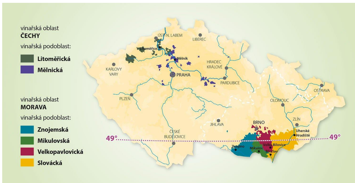
Obrázek 1 - vinařské oblasti ČR