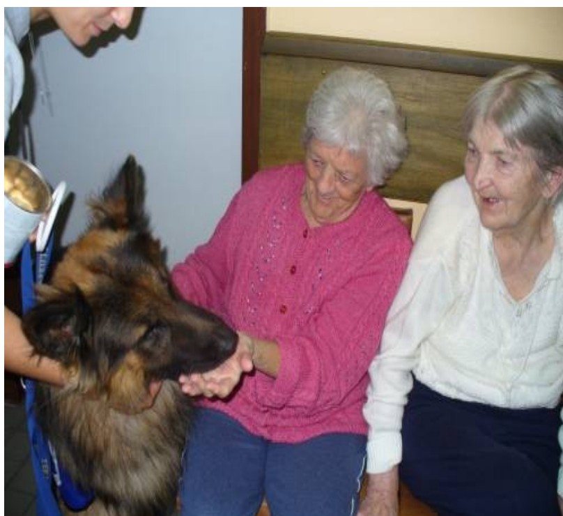
Skupinová canisrehabilitace na oddělení se zvláštním režimem