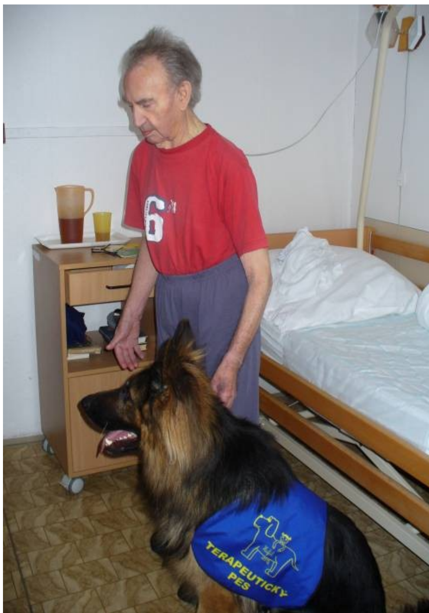
Individuální canisrehabilitace