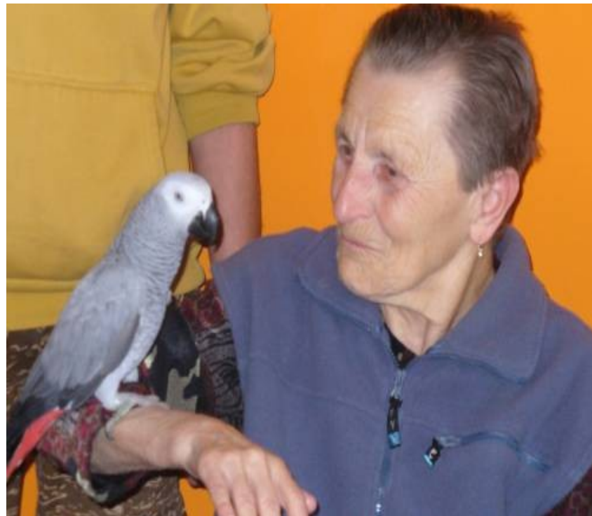
Skupinová ornitorehabilitace