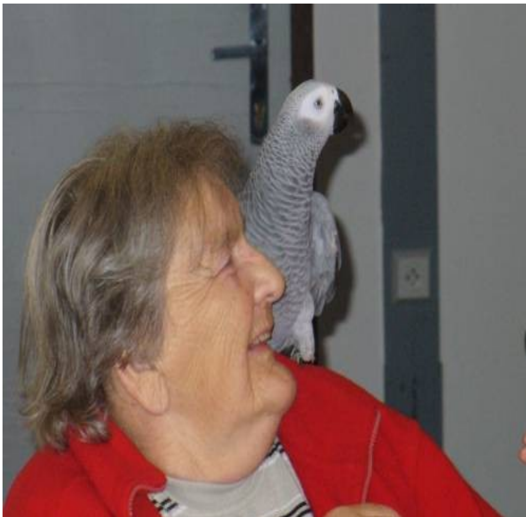
Skupinová ornitorehabilitace