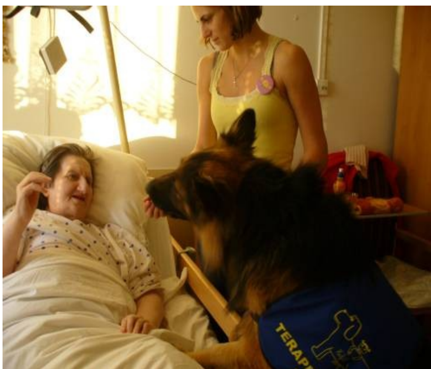
Individuální canisrehabilitace