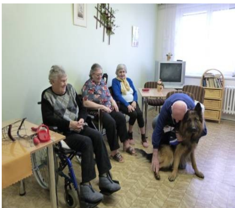
Skupinová canisrehabilitace (vlastní zdroj)