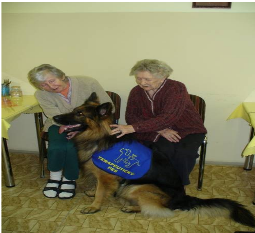
Skupinová canisrehabilitace