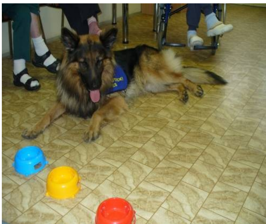
Německý ovčák Ringo- terapeutický pes