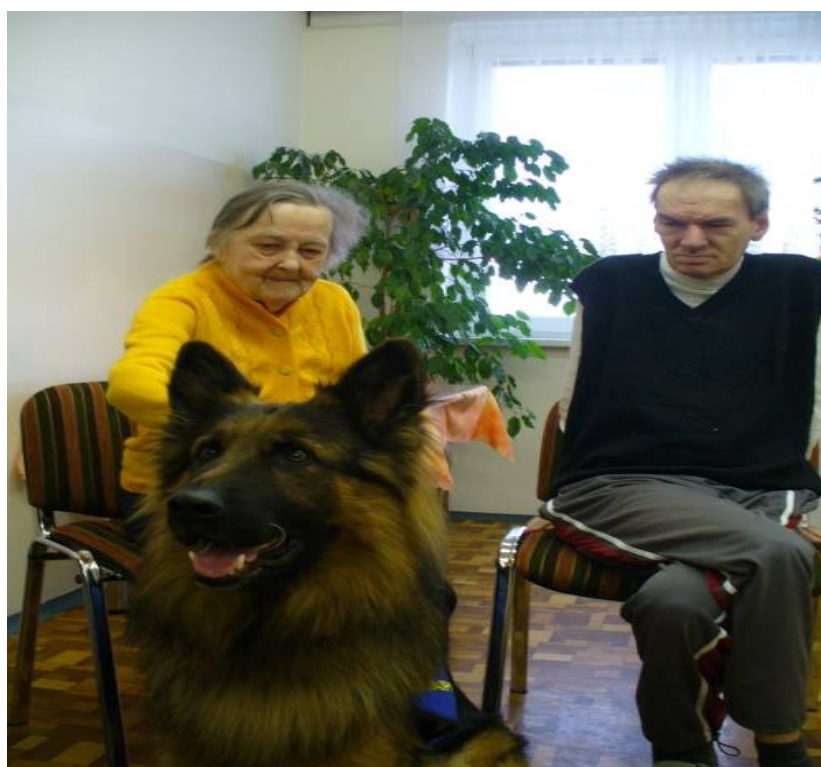
Skupinová canisrehabilitace