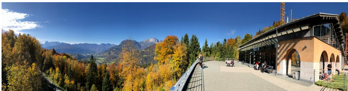
Obr. 13: Terasa Dokumentace Obersalzberg

První pohled na komplex budov, které tvoří tuto stavbu návštěvníkům nenapoví, co od něho čekat. Je zde ruch, kdy pravidelně kolem budovy proudí návštěvníci. Místo zvenku působí na návštěvníky obyčejným dojmem. Každý, kdo však vejde dovnitř zpozorní. Celé místo je zasvěcené Adolfu Hitlerovi a hrůzám, které jeho prostřednictvím musel svět během druhé světové války, ale i před ní prožít. Přestože interiér je během otevíracích hodin většinou zaplněný, návštěvníci zde působí v naprosté tichosti. Temná stránka historie tohoto místa působí na každého a pocity temna pohltí nejednoho návštěvníka. Celý komplex je rozdělen na