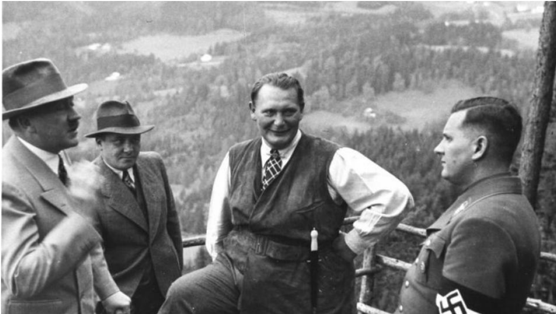
Obr. 7 – Adolf Hitler na Orlím Hnízdě s Hermannem Goringem