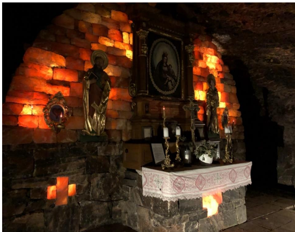
Obr. 9: Kaple svaté Barbory

V tomto prostoru na každého dýchne zvláštní atmosféra se závanem duchovna. Je zde cítit jedlové chvojí a jsou zde zapálené svíčky. Toto místo se