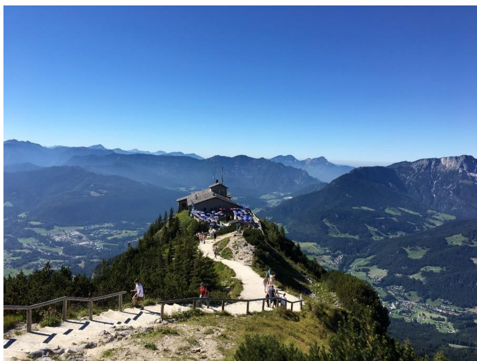
Obr. 15: Orlí hnízdo

Kehlstein. Tunelem se pomocí ozvěny rozléhají kroky návštěvníků, kteří míří ke konci temné chodby. Zde na ně čeká něco, co zdaleka nečekali. Vrchol honosného bohatství hory Kehlstein tvoří výtah, který z nitra hory návštěvníky doveze až do budovy zvané Kehlsteinhaus. Návštěvníci však nejsou uchvázeni z tohoto výtahu proto, že by je měl vyvézt až nahoru. Důvodem je podoba výtahu, která je velkolepá a i zde už je opět cítit kult vůdce třetí Říše. Výtah je rozlehlý a jeho interiér vyplňují kožené sedačky, které v kombinaci s obložením zrcadlovou mosazí působí velice