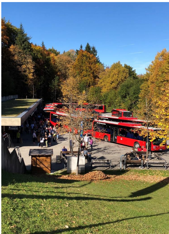
Obr. 14: Místo odjezdu k Orlímu Hnízdu

Cestou z Dokumentation Obersalzberg k místu, ze kterého odjíždí autobus na Orlí Hnízdo vede krátká upravená cesta, na které se míjejí davy návštěvníků. Mezi návštěvníky panuje veliký zájem poznat a objevit bájně Orlí Hnízdo, které stojí dle Kelblové na hoře Kehlstein. Už jen tento název tomuto místu dodává pocit