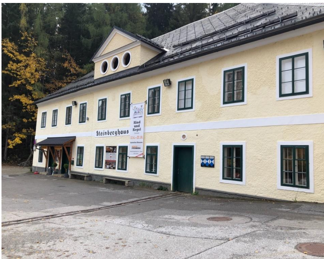
Obr. 8: Budova Steinberghaus

Prohlídka solného dolu začíná v budově „Steinberghaus“, která je podle výkladu Beerové pojmenována dle štolý „Steinberg“ z roku 1319. Touto štolou se dle ní lze dostat do komplexu solných dolů, což v minulosti nebylo lehké. Jak dále uvádí, tunel do nitra solné hory byl otevřen veřejnosti až v roce 1920, do té doby ho mohli navštěvovat pouze hosté se šlechtickým titulem nebo zvláštním pozváním.