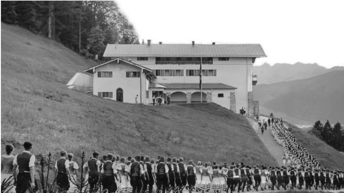
Obr. 5 - Wachenfeld/Berghof a zástupy obdivovatelů Adolfa Hitlera