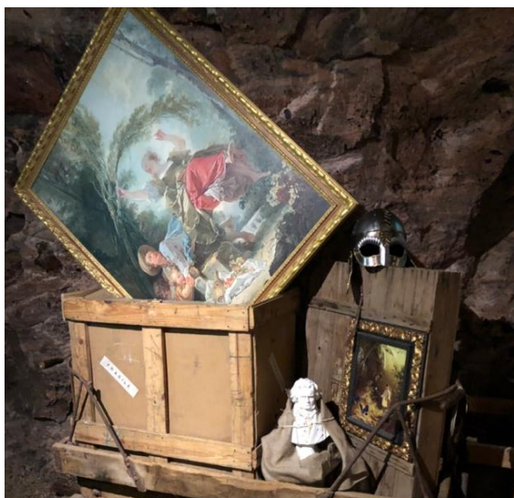
Obr. 11: Důlní vozík naložený uměleckými díly

Beerová informuje, že vzhledem k tomu, že se jednalo o několik tisíc kusů drahocenného umění, museli být pro tyto exponáty vyčleněny zvláštní haly, kterých