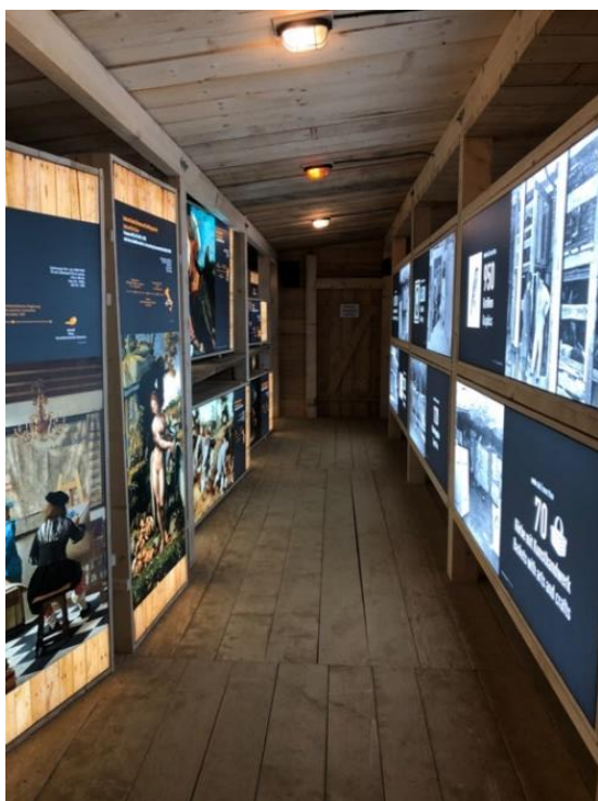
Obr. 12: Umělecký depozitář

Jak dále Beerová informuje, uměleckých děl, která zde byla skladována je opravdu veliké množství. Součástí Springwerku je dle ní umělecký depozitář, kde se nachází kopie nejzajímavějších uměleckých děl, která zde byla uschována. Každý se