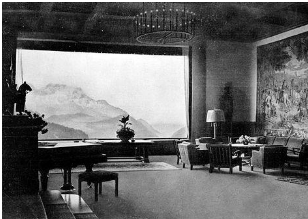
Obr. 6 – Výhled z okna Berghofu na Alpskou krajinu

kterém se nacházel konferenční sál obsahující slavné okno s výhledem na okolní hory. Dle něho se Hitler pyšnil tímto oknem, jako největším v Evropě.