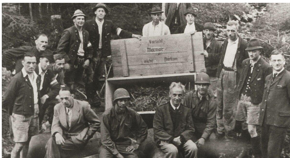
Obr. 4 – Američtí vojáci s horníky ze solného dolu v Altaussee, kteří zachránili umění před výbuchem bomby, která se nacházela v bedně na obrázku

Jak uvádí Ueno (2014), když horníci viděli, že tyto bedny snáší do dolu cizí lidé, kteří zde nepracovali, rozhodli se obsah beden zkontrolovat. Dle něho po zjištění, že je obsah beden je plný výbušnin, rozhodli se horníci solný důl i umělecká díla zachránit.