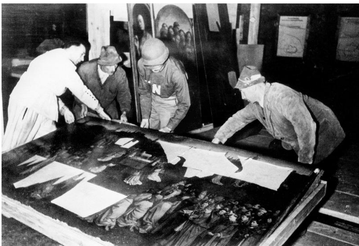
Obr.2 - Američtí vojáci s odborníky prohlížející nalezená umělecká díla v depozitáři solného dolu v Altaussee