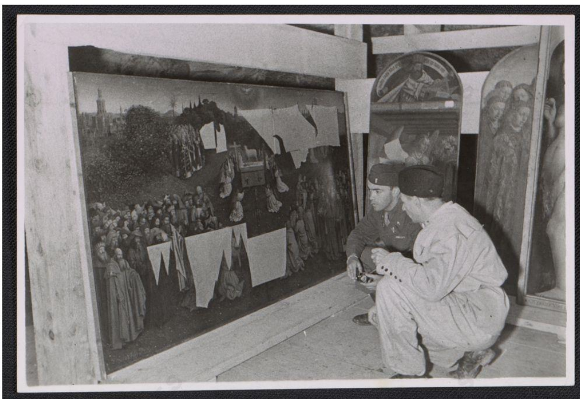
Obr. 3 - Panel Gentského oltáře v podzemí solného dolu v Altaussee