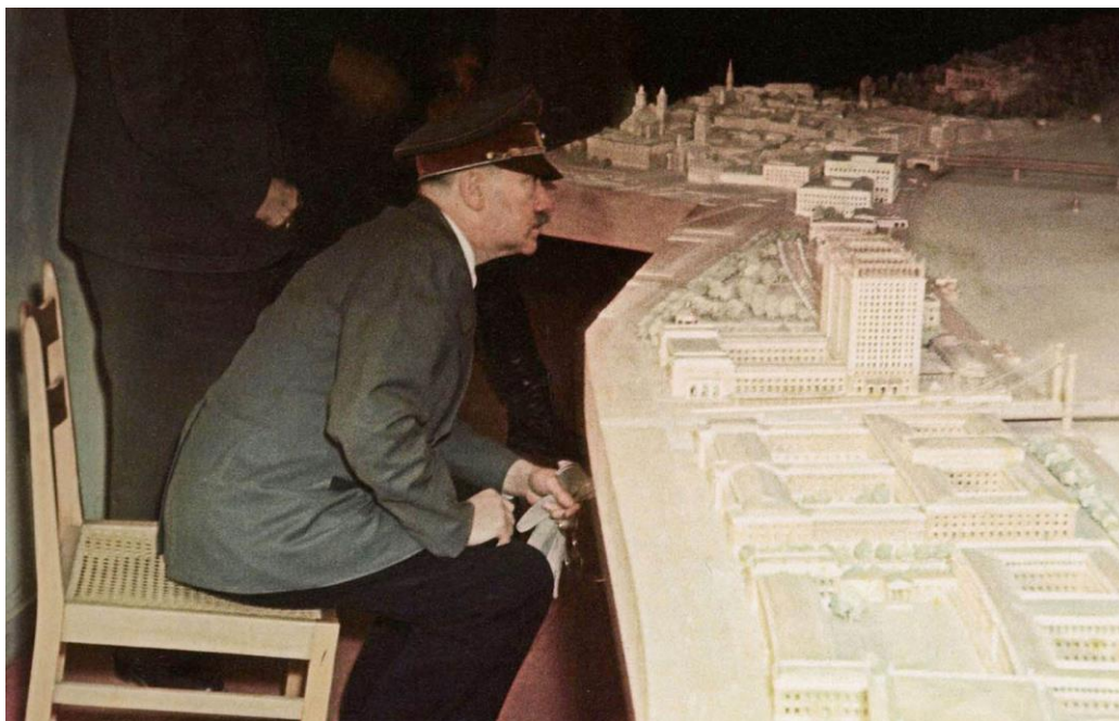
Obr.1 - Adolf Hitler prohlížející své „Führermuseum“ ve svém podzemním bunkru v Berlíně v únoru 1945