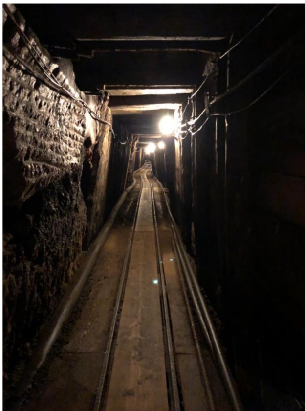
Obr. 10: Tunel do Springwerku

Z kaple svaté Barbory vede krátký tunel směrem do nitra hory. Po pár metrech chůze tunelem se nachází rozlehlá jeskyně, která je, jak uvádí Beerová pojmenována „Springwerk“. Již při příchodu z této jeskyně dýchá tajemná atmosféra. Tato jeskyně je dle Beerové osudovým místem celého příběhu solného dolu v Altaussee. Jak informuje, do tohoto prostoru byly naváženy od roku 1943 až do roku 1945 bedny s uměleckými díly. Návštěvníci dolu se mohou vrátit v čase do roku 1943, kdy zde začala být ukrývána umělecká díla prostřednictvím videa, které je