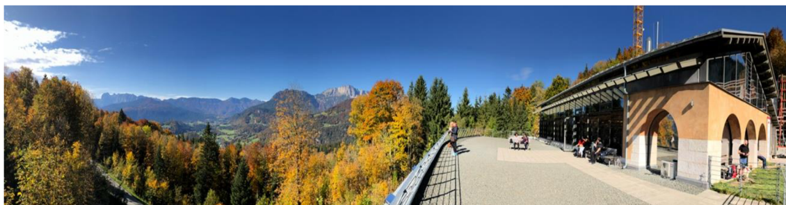
Obr. 13: Terasa

První pohled na komplex budov, které tvoří tuto stavbu návštěvníkům nenapoví, co od něho čekat. Je zde ruch, kdy pravidelně kolem budovy proudí návštěvníci. Místo zvenku působí na návštěvníky obyčejným dojmem. Každý, kdo však vejde dovnitř zpozorní. Celé místo je zasvěcené Adolfu Hitlerovi a hrůzám, které jeho prostřednictvím musel svět během druhé světové války, ale i před ní prožít. Přestože interiér je během otevíracích hodin většinou zaplněný, návštěvníci zde působí v naprosté tichosti. Temná stránka historie tohoto místa působí na každého a pocity temna pohltí nejednoho návštěvníka. Celý komplex je rozdělen na