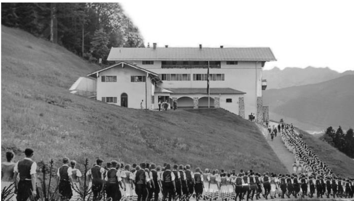
Obr. 5 - Wachenfeld/Berghof a zástupy obdivovatelů Adolfa Hitlera