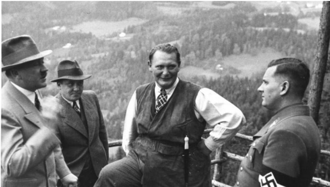
Obr. 7 – Adolf Hitler na Orlím Hnízdě s Hermannem Goringem