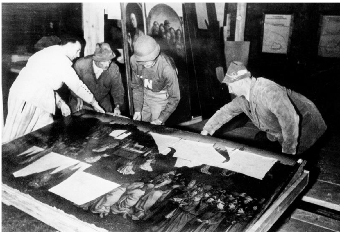
Obr.2 - Američtí vojáci s odborníky prohlížející nalezená umělecká díla v depozitáři solného dolu v Altaussee