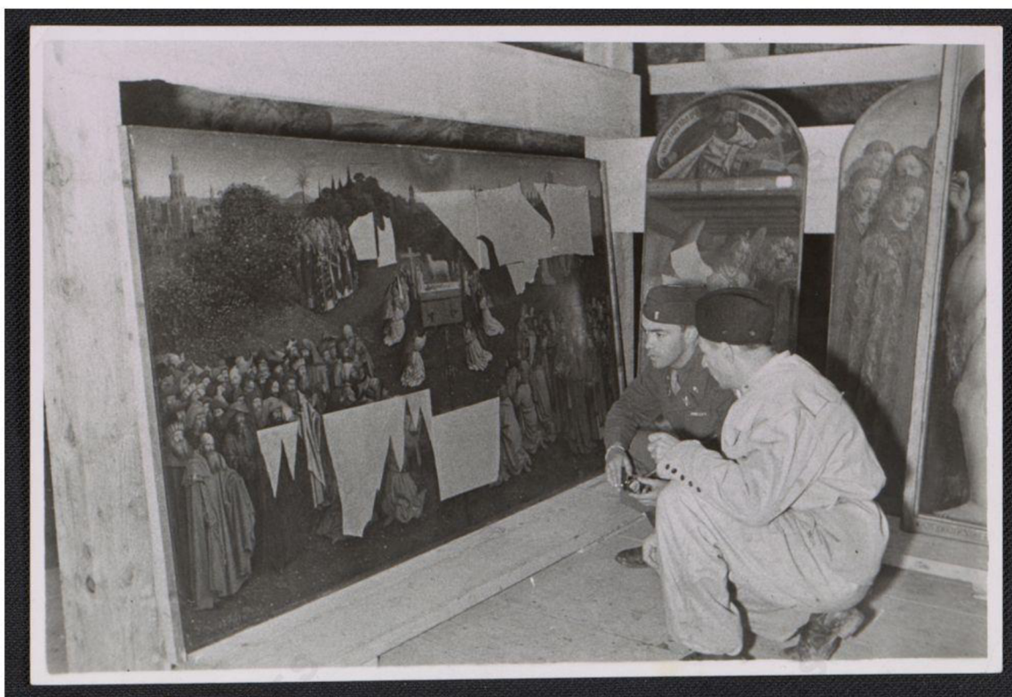
Obr. 3 - Panel Gentského oltáře v podzemí solného dolu v Altaussee