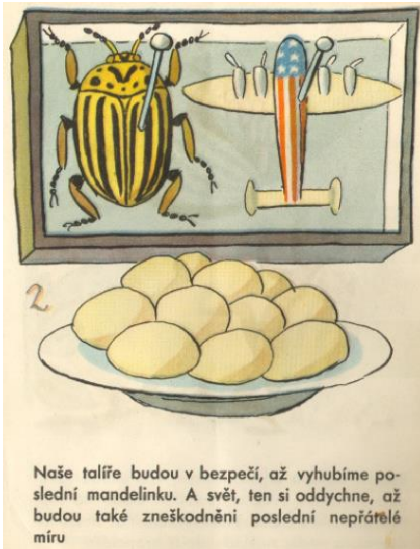
Obrázek 7 - O zlém brouku Bramborouku, detail