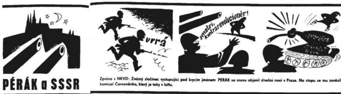
Obrázek 8 - Pérák a SSSR