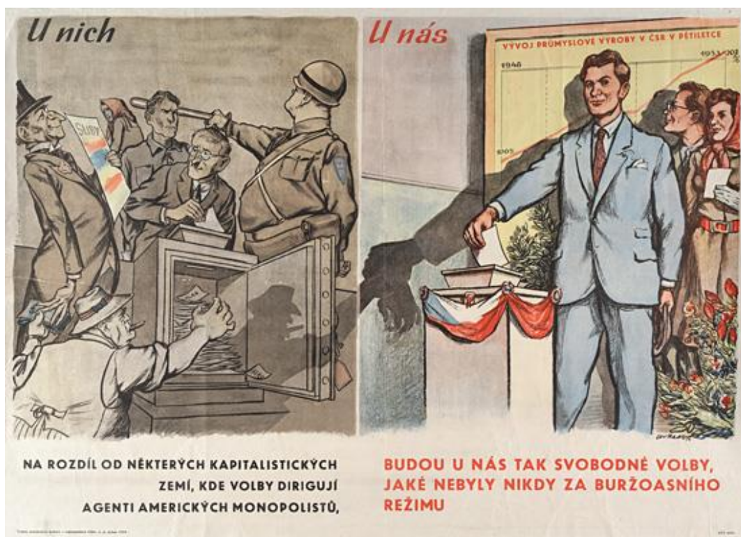
Obrázek 5 - Lev Haas, volební plakát