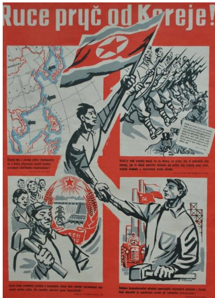
Obrázek 4 – Plakát „Ruce pryč od Koreje“, 50. léta, detail