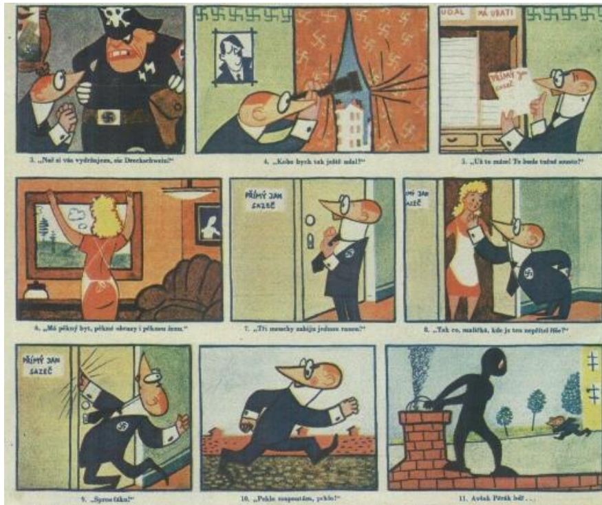
Obrázek 3 – Vladimír Dvořák, Pérákovy další osudy, detail