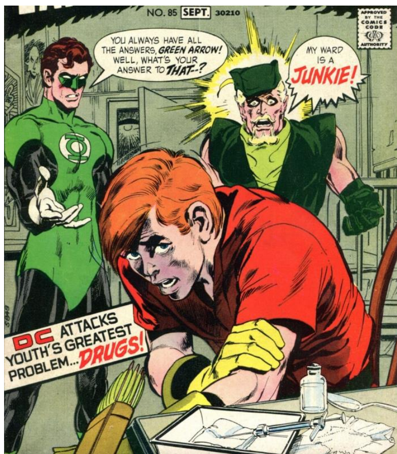
Obrázek 2 – Neil Adams – Jack Adler, Green Lantern Vol 2 #85 , 1971, detail obálky