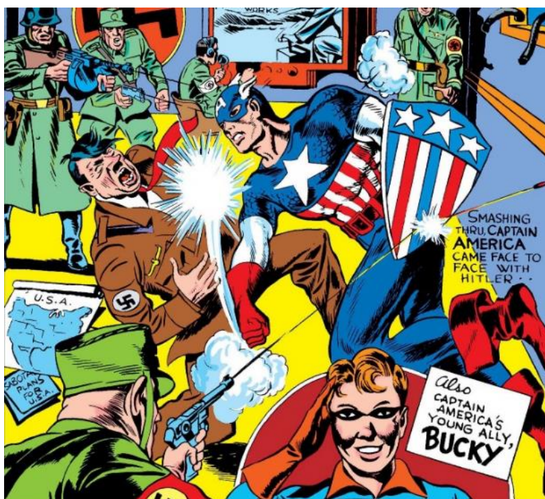
Obrázek 1 – Jack Kirby, Captain America Vol 1 , detail obálky