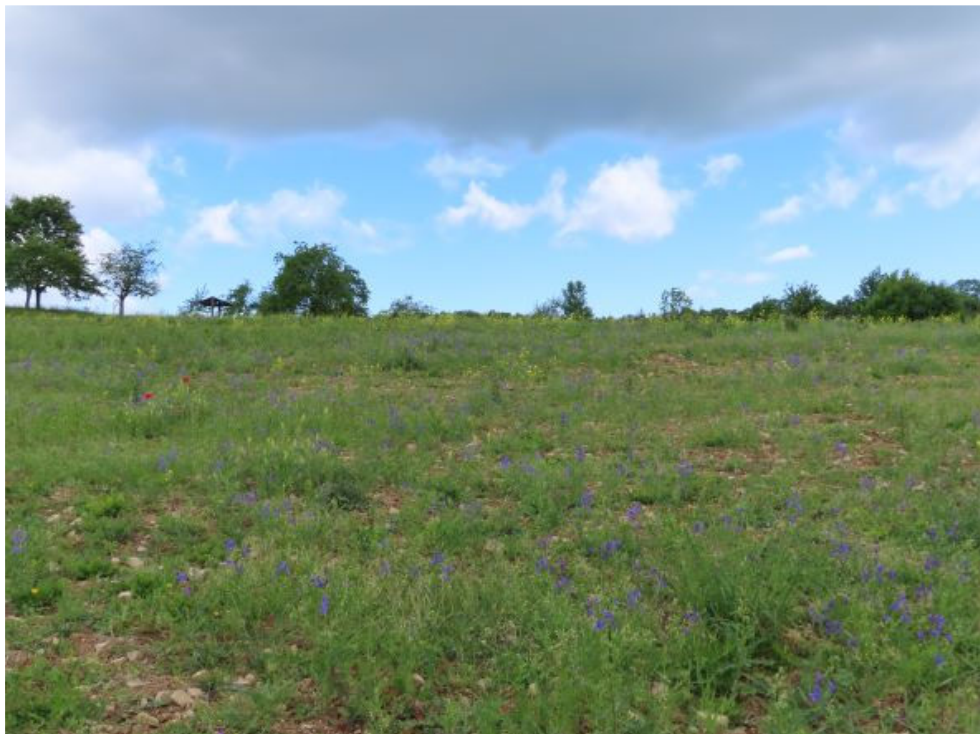
Obr. 12 Zelený úhor s kvetoucí ostrožkou stračkou a hořčicí bílou