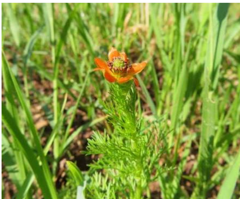
Obr. 6 Hlaváček letní pravý