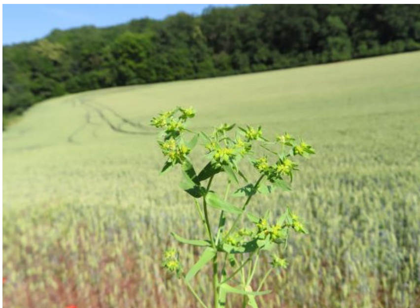
Obr. 9 Pryšec drobný