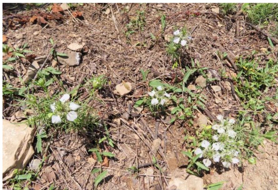
Obr. 1 Černucha rolní.