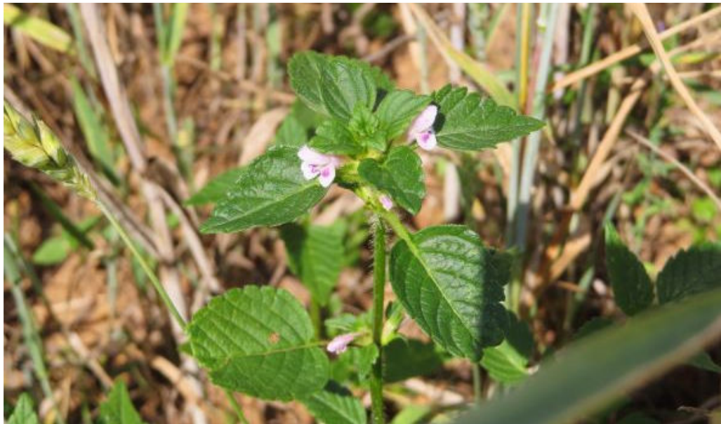
Obr. 8 Konopice širolistá