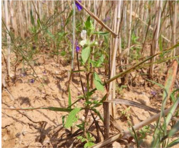
Obr. 3 Čistec roční