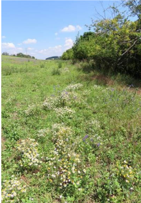
Obr. 11 Rmen rakouský na zeleném úhoru