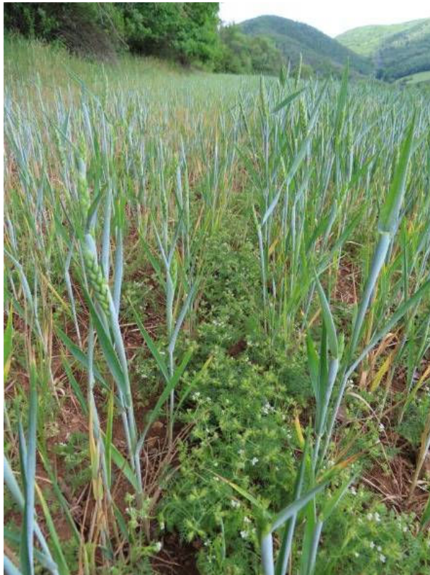
Obr. 4 Dejvovec velkoplodý pravý