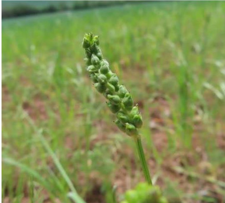
Obr. 7 Hlaváček plamenný