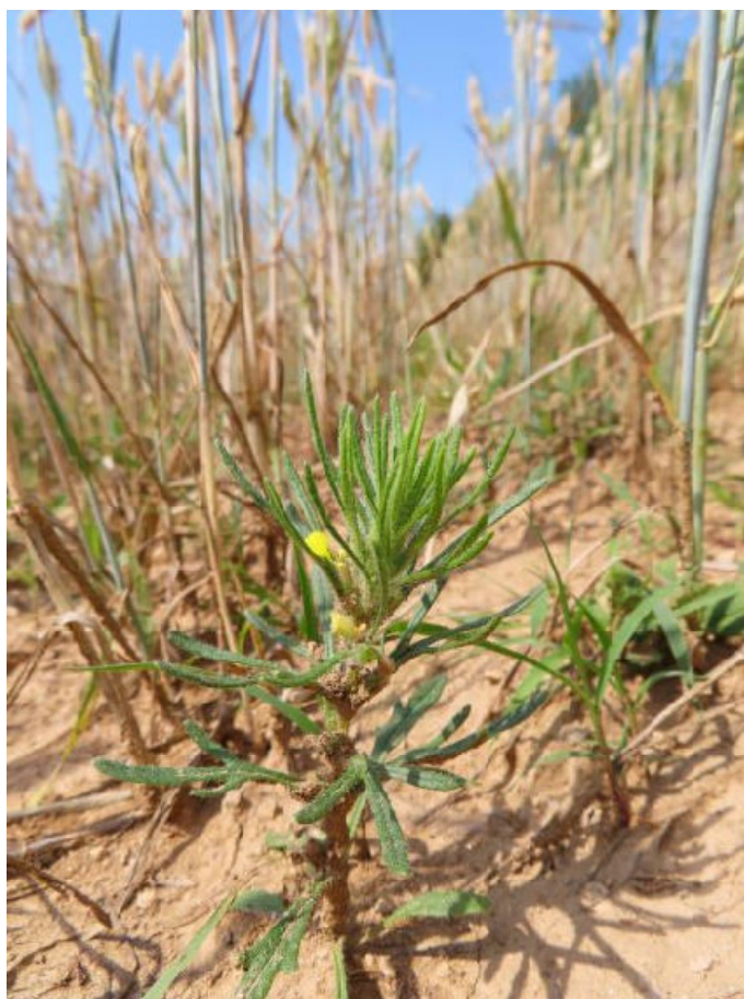
Obr. 10 Zběhovec trojklaný