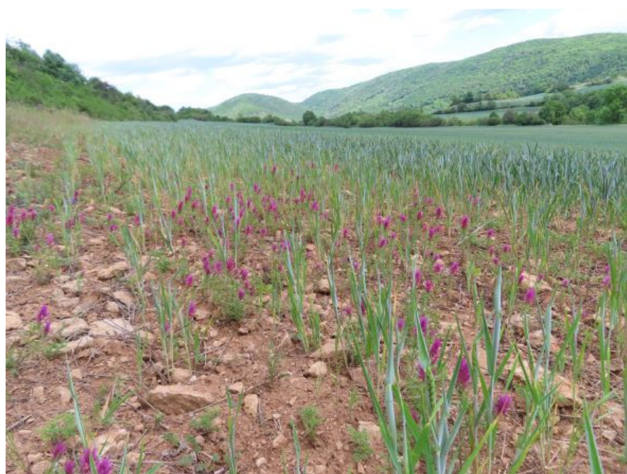
Obr. 2 Černýš rolní